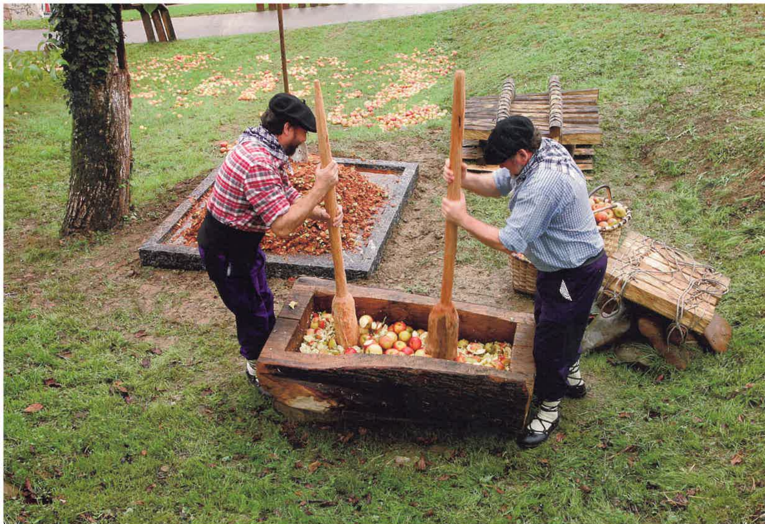
Arriba, el prensado tradicional de la manzana. A la derecha, interior de la sidrería Lizeaga.