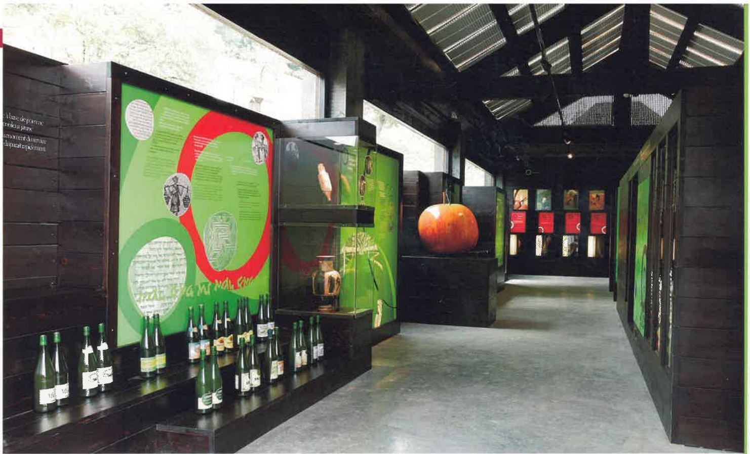
Dos rincones de Sagardoetxea, la Casa-Museo de la Sidra Vasca.

de la producción sidrera en Astigarraga desde 1382.