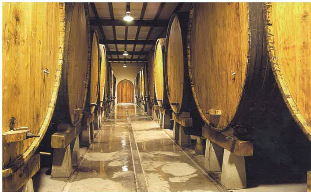
A la izquierda, de arriba a abajo, las kupelas de diferentes sidrerías guipuzcoanas: Saizar, Petritegi y Zapiain.