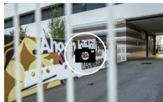
📷 Así viven la jornada de huelga en la enseñanza vasca los centros educativos de Álava