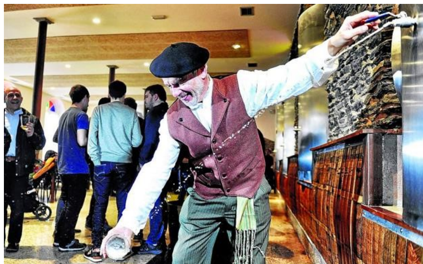
Un hombre llena su vaso de sidra en las kupelas de Kuartango.

Las sidrerías abren mañana la temporada con una nueva marca en la denominación de origen. La cosecha ha sido «irregular» por zonas