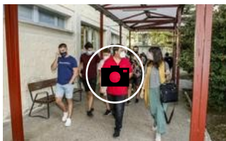
📷 1.800 alumnos alaveses de FP regresan a las aulas