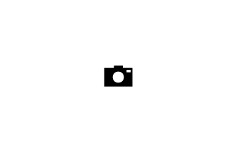
📷 Olárizu sin romería y la visita a los mojones, como en la Guerra Civil