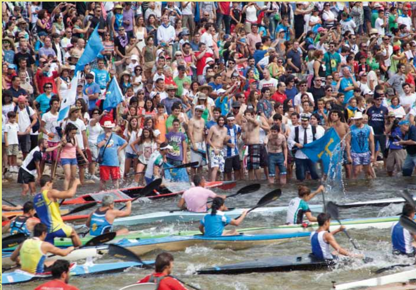
Piragües y sidre corrieren al empar nel Seya.

sofitu institucional, finando con una tradición que cumpliría cinco años.