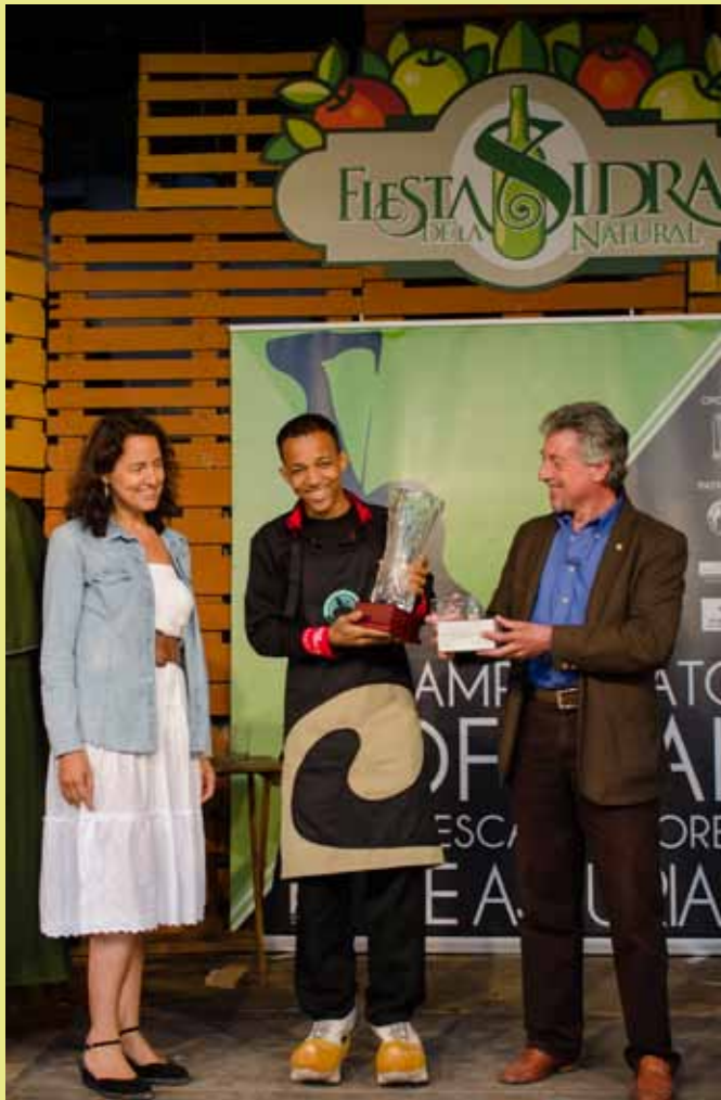
Entrega premios na Fiesta de la Sidre de Xixón.

13 - Navia esfrez nel puertu la sidre pal XIII Festival de la Sidre natural. 11 llagares y 5 chiges participen.