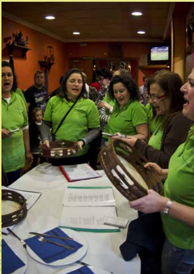
Los cancios de chigre van recuperándose pasu ente pasu.