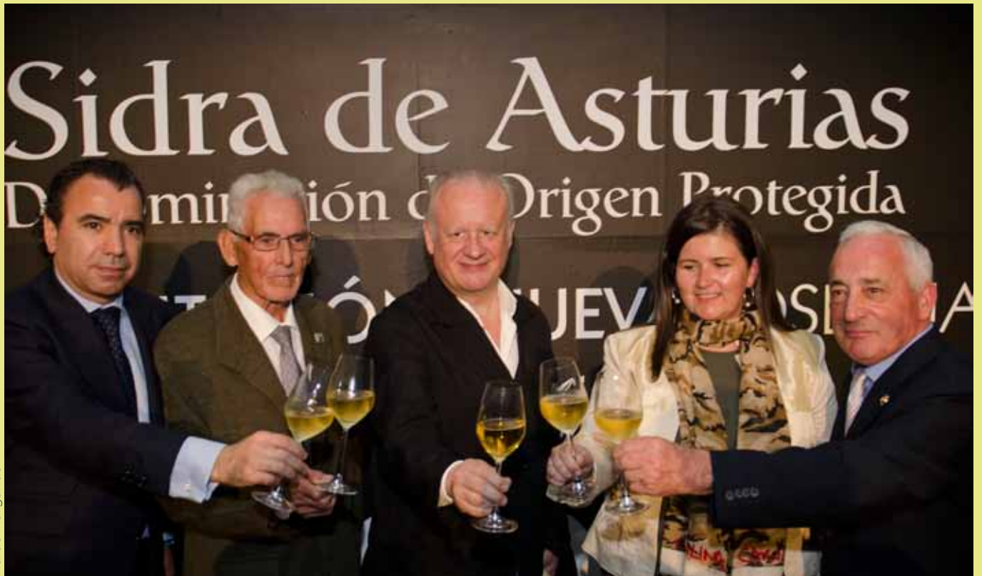
La DOP presentó la so sidre n'Avilés.

18 - El IV Salón de la sidre con DOP tuvo llugar nel Niemeyer d'Avilés, onde'l públicu pudo a la fin prebar la collecha de 2012, una de les más prometedores.