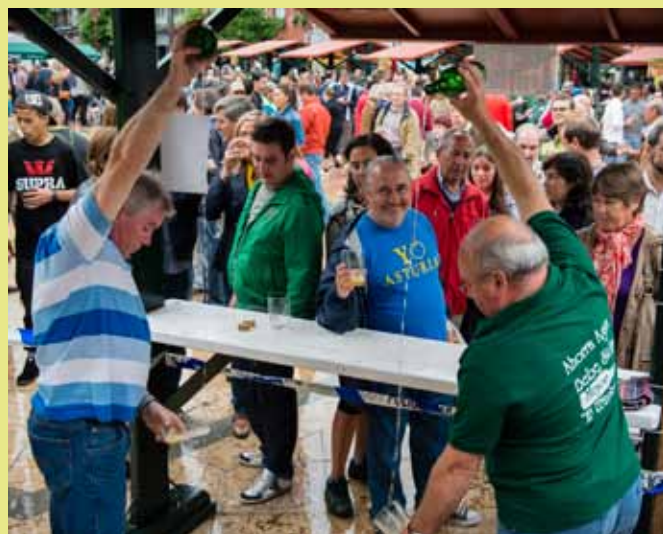
Los festivales sidreros, ésitu de públicu.

8/9 - La Pola tornó a canciaar cola VII Edición del Certame de Cancios.