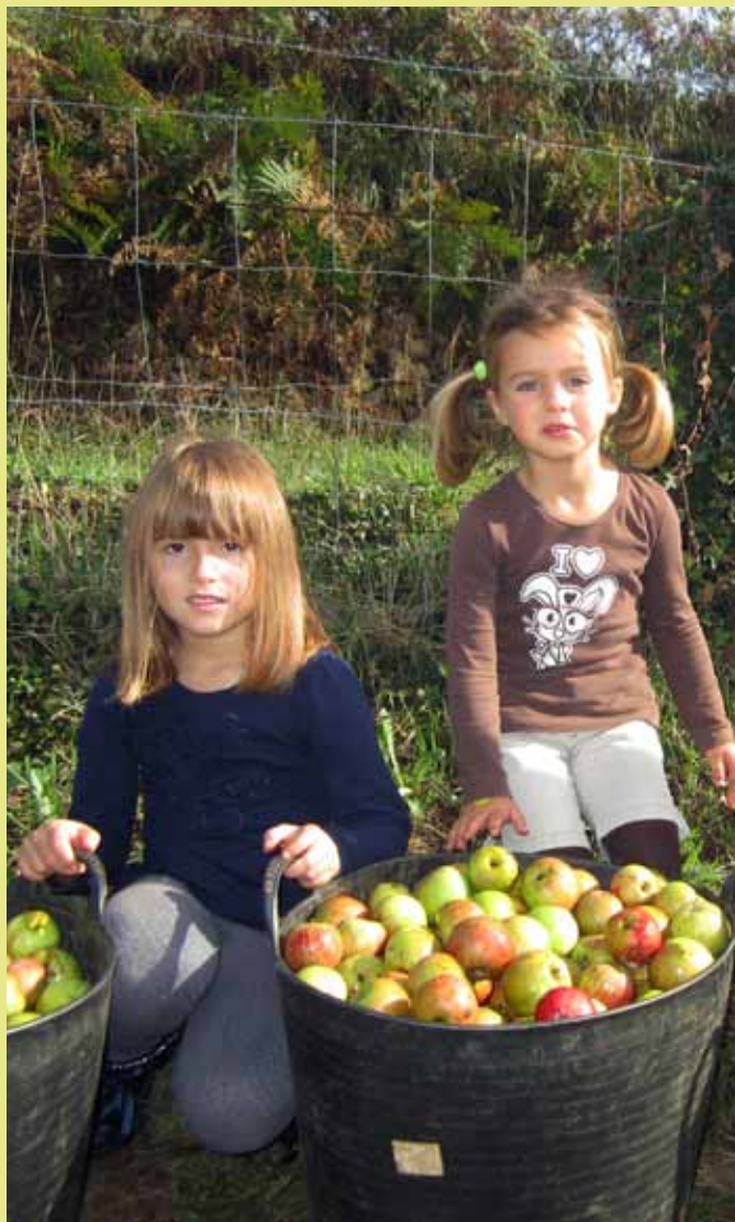
Los sidrocoles averen a los neños a la cultura asturiana de la sidre.