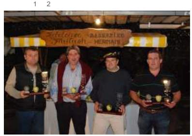
Los ganadores durante la noche del viernes.

Txantxangorri celebró este viernes por la noche una nueva edición del concurso de sidras. Este año se ha proclamado ganador Akarregi, que consiguió 1151 puntos. Le seguía por detrás en la clasificación Itsasburu, con la misma puntuación. Para elegir al ganador, se decidió tener en cuenta qué sidrería había conseguido más puntuaciones de 10. Akarregi consiguió 19 mientras que Itsasburu 8. En cuanto al tercer lugar, este año ha ido a parar a la sidrería Herrero que ha logrado 1150 puntos. Cuarta, por último ha quedado Lizeaga con 1130. Txantxangorri congregó a multitud de amigos en la sociedad. Hubo buen ambiente, buena comida y, sobre todo, buena sidra.