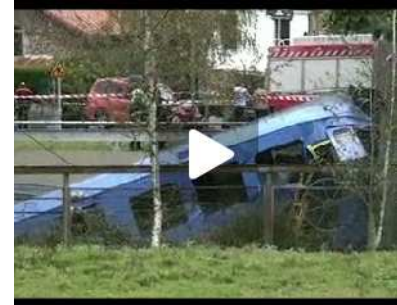
GIPUZKOA Fallece un maquinista y tres viajeros resultan heridos al descarrilar un tren en Lezama