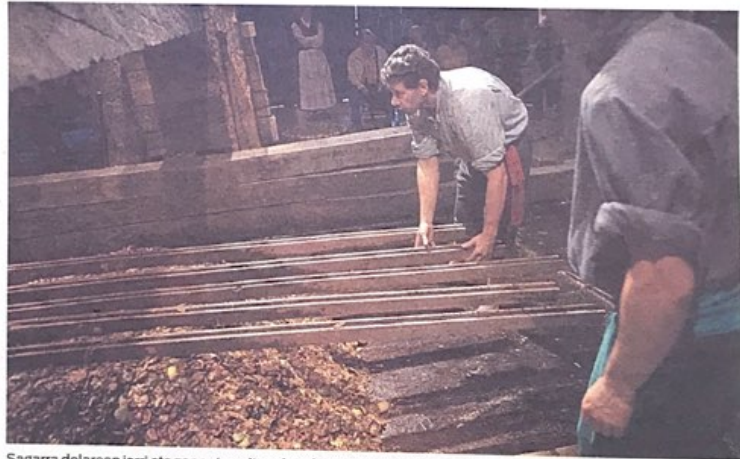
Sagarra dolarean jarri eta zanpatu egiten dute fruituaren zukua jasotzeko.

bospasei urtetan desegin zuten, piezaz piezaz».