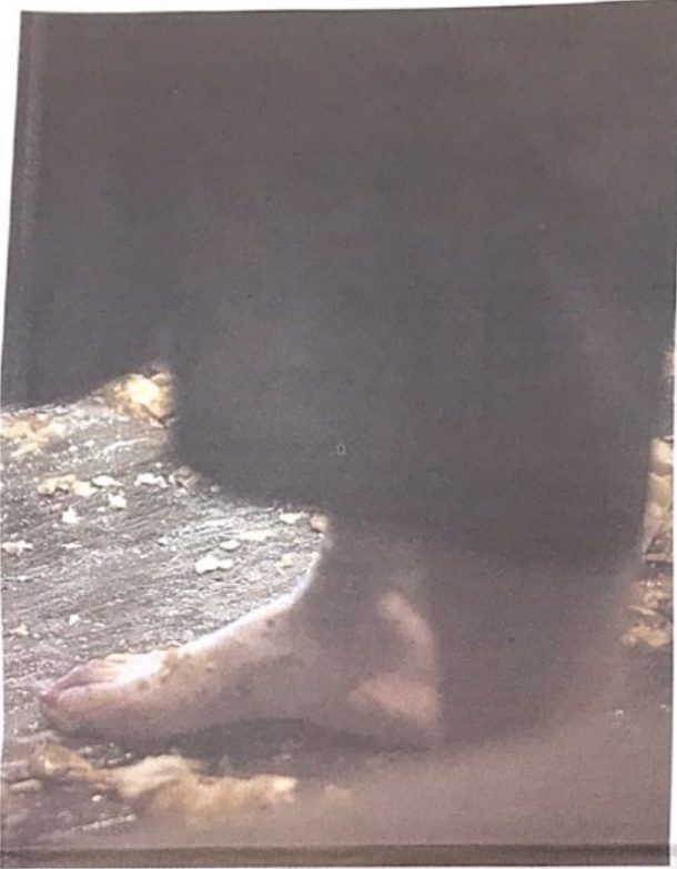
Igartubeitiko Sagarraren Astean.

«Orain dela 500 urteko biziaren bertsioa egiten ari gara gaur egun, hori galduguenelako. Ez da 500 urtetako ohiturarik mantendu, horri balioa ematen ari gara». XX. mendean baserri mundua alboraturik geratu dela uste du: «Orain gutxi arte jendeak lotsa sentitu izan du baserri bizimodu horren inguruan, garai hartan baserriar esatea irain ere bihurtu zen ia». Gaur egun pentsaera hori aldatzeko bidean gaudela pentsatzen du.