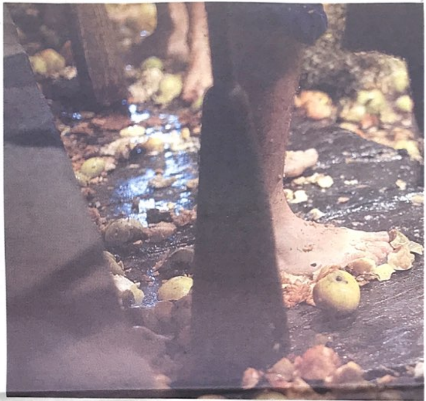
Mendeetako ohitura berreskuratuz, Jo ala Jo elkarteak kideak kirrikoketa erritmoa jarraituta zanpatzen ari dira

Etorkizun iluna zuten Igartubeitik duela ez asko. Jabeek baserria bota eta berri bat ezerezetik eraiki nahi zuten. Foru Aldundiak, baina, trabak jartzen zizkien baserriarrei. Igartubeiti bezalako baserriak ondare kulturala dira, eta hainbat legeg babesten dituzte; ezin dira besterik gabe bota eta txikitu. Azkenean, Aldundiak erosi zuten eraikina, eta hura ikeretzeko aukera egokia ikusi zuen. «500 urtetan egin zen baserria,