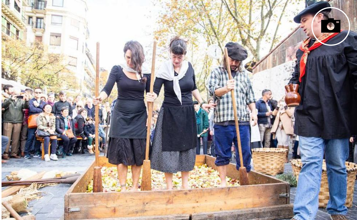
Kirikoketa con la que se inauguró el V Sagardo Apurua este jueves en el Boulevard.

Un caserío histórico situado en el Boulevard recrea la historia de Donostia como capital de la sidra