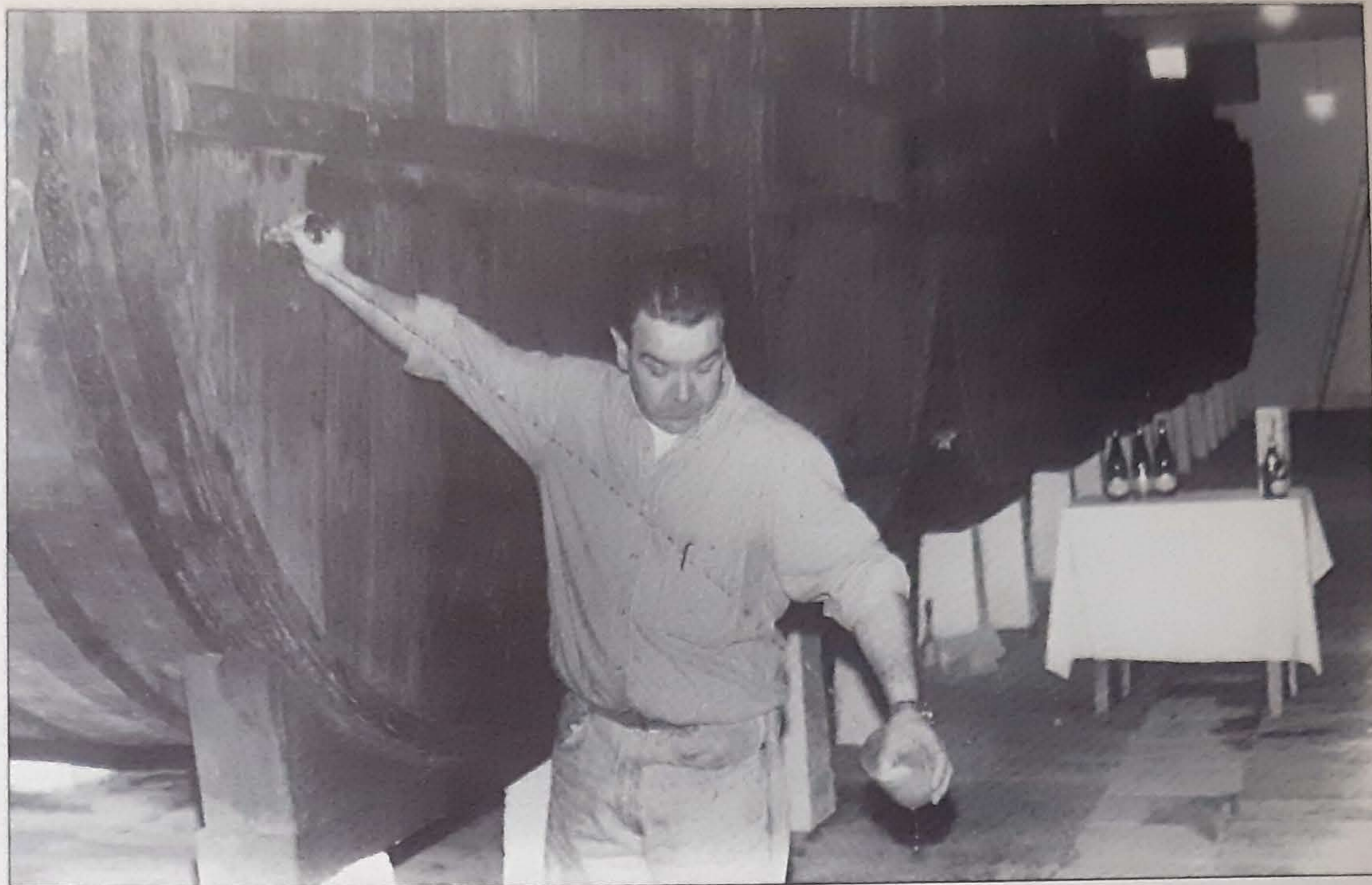
Txotxeko sasoian promozionatu ondoren, botiletan jokatzen du etorkizuna sagardoak.