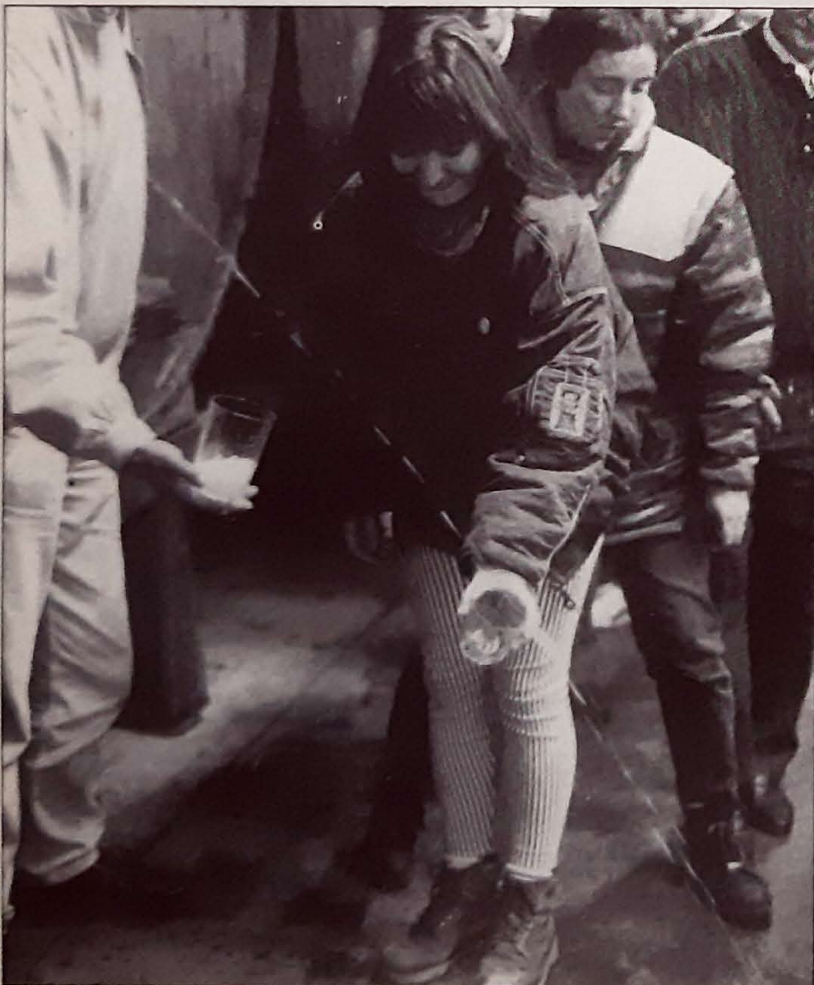
Edari naturala, alkool gutxikoa, freskagarria...

S agarrari ateratako muztioa modu ezberdinez erabil daiteke, madariarenarekin nahasi, azukrea erantsi, pasteurizatu, legami bereziak edo koloranteak erantsi, eta abar. Baina Euskal Herriko berezko sagardoa «sagardo soila» da, sagar hutsen zukua modu naturalean irakitetik sortua. Ondorioz, edari bizia da eta gustura edateko janaria edo egarriak egotea eskatzen du.