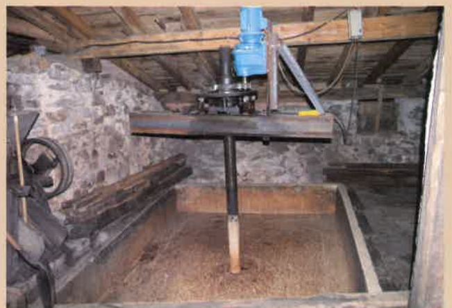
Ermañako tolare mekanizatua