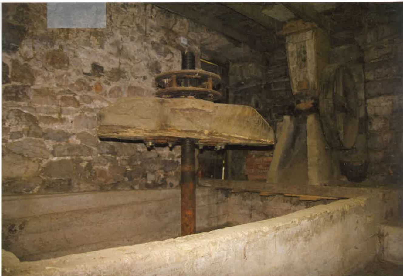
BORTANeko ESKUZKO TOLAREA