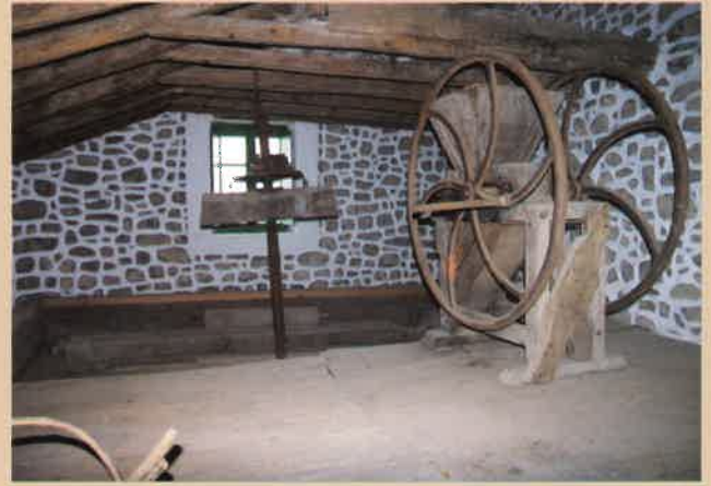
Goikoetxeko tolare eta matxaka

Amaitzeko, ezin gera gaitzke, dolarea eduki edo ez, etxe guztietan jasotako harrera beroa eskertu gabe. Abegitsu hartu gaituzte, dolarea ikusteko eta argazkiak ateratzeko atea den bestean zabaldu, eta gogon dutena kontatu digute. Bide beraz, Sagardoetxeari ere gure esker ona adierazi nahi diogu elkarren artean lan hau burutzeko emandako aukeragatik.