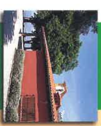
Santiamendi Aterpetxea Alberque de Montesantiago