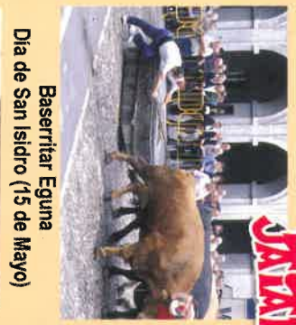
Baserriar Eguna Dia de San Isidro (15 de Mayo)