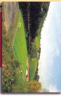
Zarkumendegiko futbol zelaia Campo de futbol de Zarkumendegi