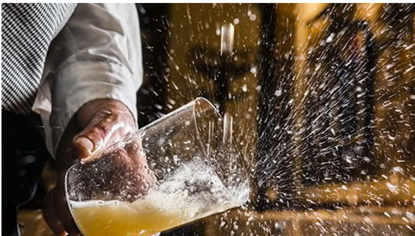
▲Un profesional escancia un culín de sidra.