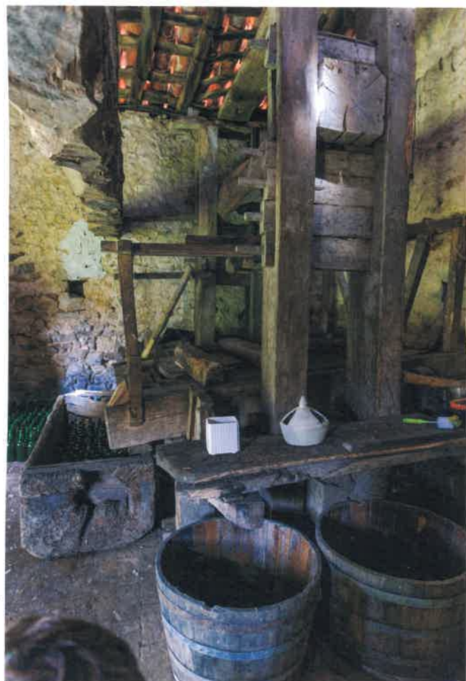
La conservación del llagar en tan bones condiciones ye tou un exemplu de compromisu col padremuñu material asturianu