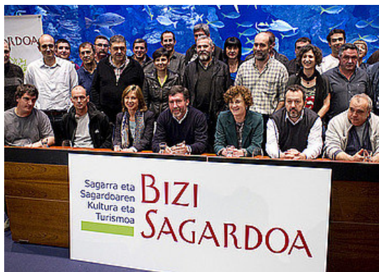
Hegoaldeko lau lurraldeetako sagardogileen elkarteek, zenbait udalek eta bestelako eragilek bat egin dute Bizi Sagardoa elkartearen.

Sagardoaren kultura eta turismoa sustatzea. Helburu hori du Bizi Sagardoa elkarte berriak. Lehenbizikoz, Gipuzkoako, Nafarroako, Arabako eta Bizkaiko sagardogileen elkarteek bat egin dute proiektu batean, sektorearen alde lan egiteko. Horrez gain, eragile publiko zein pribatuen parte hartzea ere izango du Bizi Sagardoa elkarteak, hainbat udalek eta bestelako elkarteak elkar hartu baitute proiektuan. Guztira, 67 sagardotegi, bederatzita udal eta hainbat fundazio, museo, enpresa eta bestelako eragile bildu dira Bizi Sagardoa elkartearen. Donostiako Aquirumean egin dute sinadura ekitaldia.