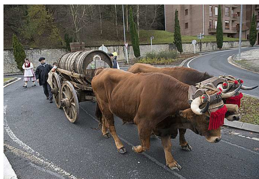
Donostian, Aietetik upelean jaitsi zuten sagardoa Bretxara.