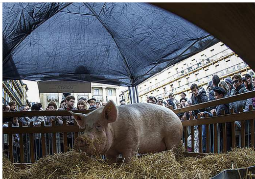
Donostiako Konstituzio plazan egon zen Jaxinta zerrama.