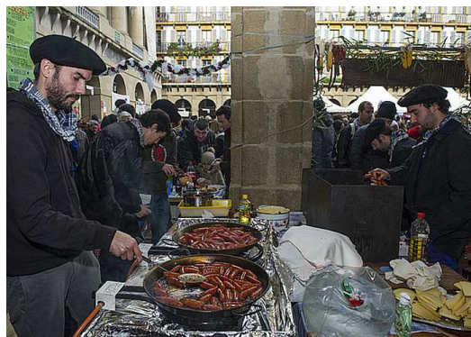
Taloea eta txistorra izan ziren eguneko protagonistak; jendeak ilara luzeak egin zituen jateko.