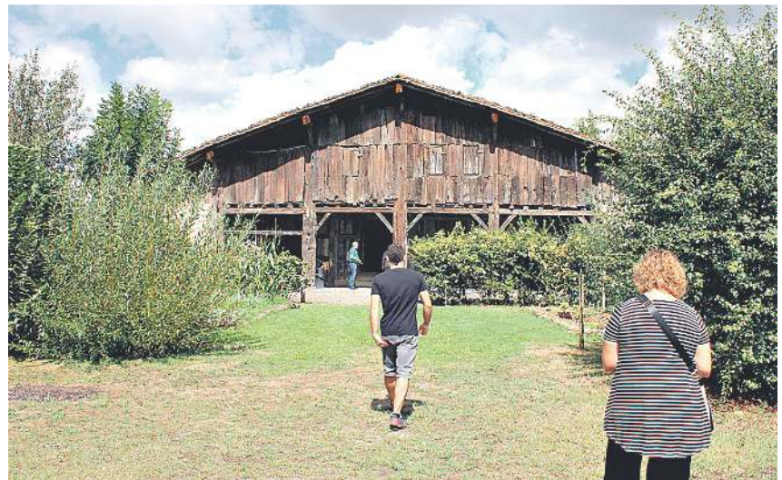
Igartubeiti baserri museoa inguru eder batean dago, Ezkio-Itsason.