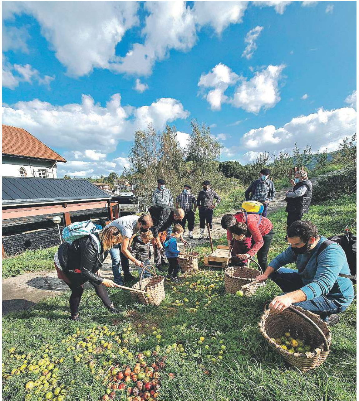
Sagardoa nola egiten den erakusteko, bisita gidatuak egiten dituzte Sagardoetxean, haurrentzat zein helduentzat. Irudian, sagarrak biltzen, Sagardoetxearen ondoko sagastietan. SAGARDOETXEA

Sagardoetxaren 15. urteurrena ospatzeko egitaraua www.sagardoetxea.eus webgunean argitaratuko da. Jardueretan parte hartu ahal izateko, aurretik izena eman beharko da.