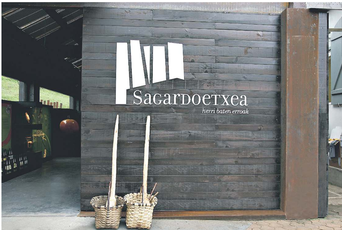
Astigarragako Sagardoetxea Euskal Sagardoaren Museoaren ataria. SAGARDOETXEA