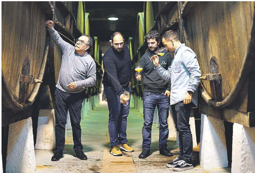
Zapiain sagardotegiko kideak.

2020ko uzتان jasotako sagarretan, sagardo ederra ekoizti dute,