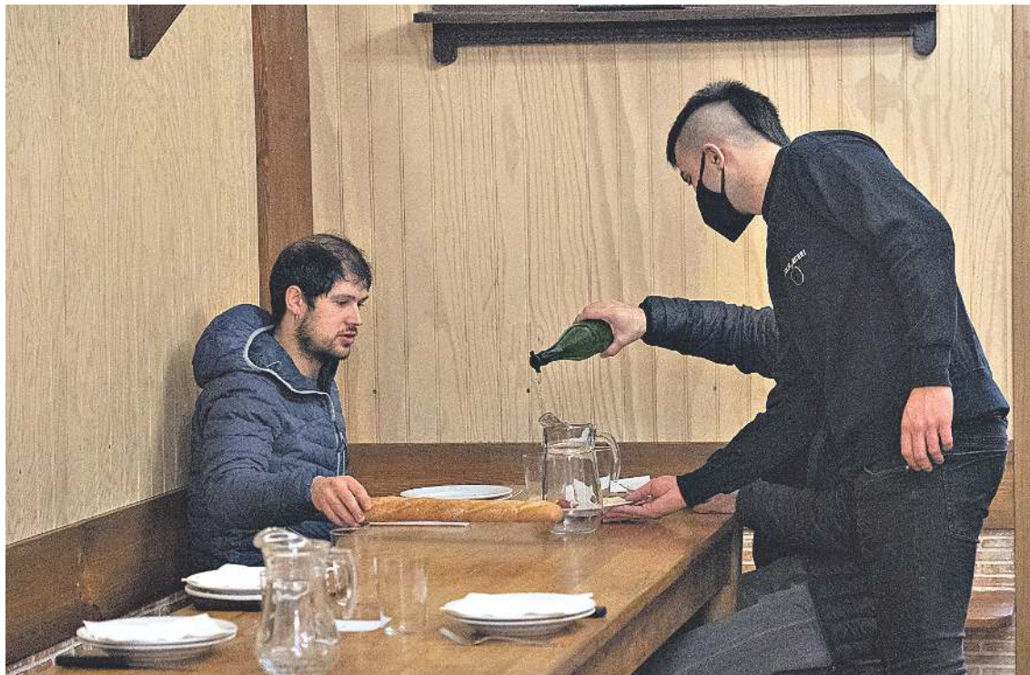
2020ko uztako sagarrekin, oro har, izaera eta gorputz handiko sagardoa egin da, fruta usaina duena eta txinparta finekoa.

Sagardotegietan ere dasta daiteke, COVID-19a dela-eta behar diren segurtasun eta osasun neurri guztiak beteta. Nahiz eta sagardotegi garaia berez amaituta dagoen eta zenbait sagardotegi kateak itxiko dituzten datorren denboraldira arte, beste hainbatek atek irekiko dituzte udako sasoiari, otorduak eskaintzeko edo bisita gidatuak eta dastatzeak antolatzeko. Horrela, Gipuzkoako Sagardogileen Elkartearen Sagardoa Route egitasmoak sagardote-