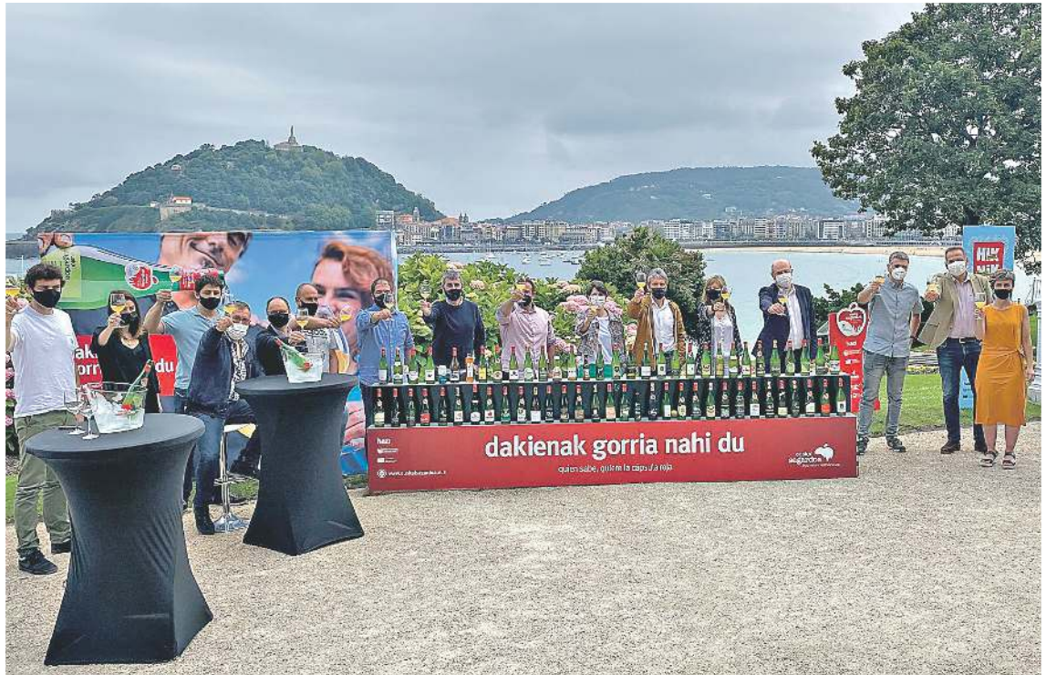
Euskal Sagardoa jatorri izenaren 2020ko uztako sagardoaren aurkezpena, Miramar Jauregian. EUSKAL SAGARDOA

Denboraldi zaila izan bada ere, bezeroek oso ongi erantzun dute, eta egoera berri honetara ere egokitu da estimatuz ondo landutako