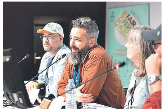
Sagardogintzari buruzko Euskal Herriko eta kanpoko egitasmo interesgarriak ezagutu ahal izango dira IV. Sagardo Forumean, aurreko ekitaldietan bezala. SAGARDOAREN LURRALDEA

IV. Sagardo Forumaren inguruko informazioa www.sagardoforum.eus webgunean eskuragarri egongo da, eta jarduera hauetan parte hartzeko izen ematek webgunetik egin ahal izango dira.