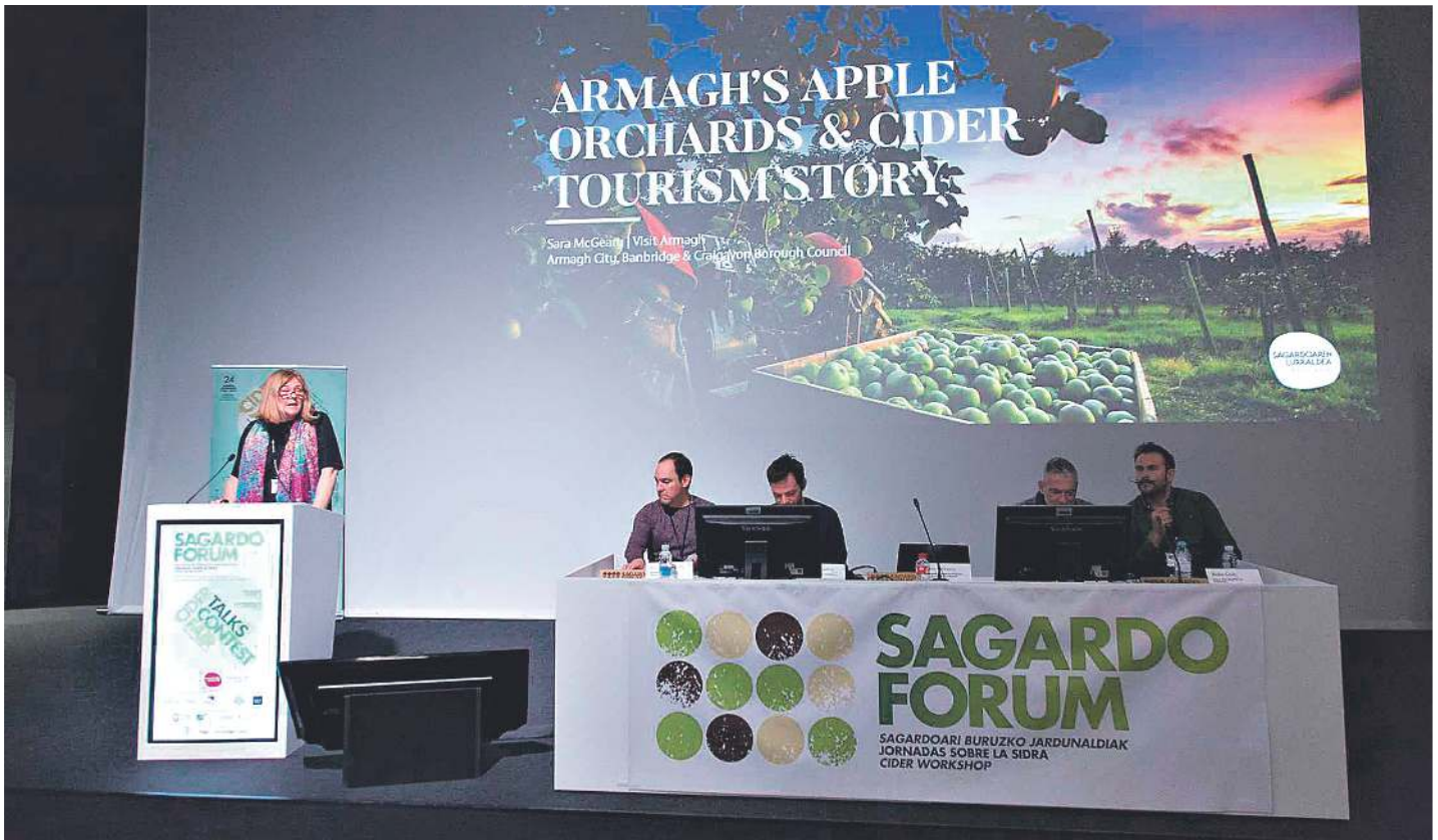
III. Sagardo Forumean bezala, aurtengoan ere Euskal Herriko eta kanpoko hainbat adituk parte hartuko dute jardunaldi teknikoetan. SAGARDOAREN LURRALDEA

sagardoak (elaborazioa, ezaugarriak), nazioarteko arrakasta kasuak eta gaur egun munduan ekoizten diren bederatzi sagardo mota ezberdinen inguruko taillerak.