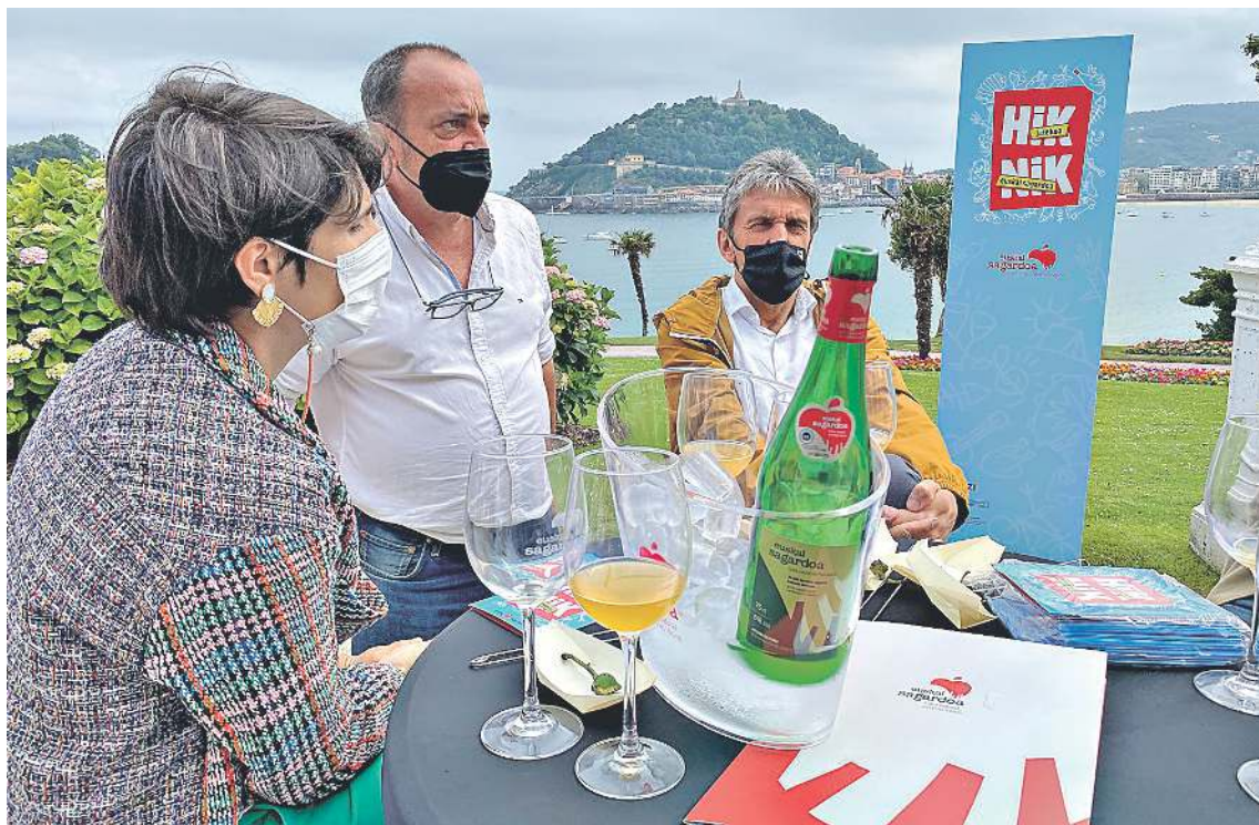
HikNik kanpaina Euskal Sagardoa sor-markako sagardoaz eta euskal produktuez gozatzeko gonbita da. EUSKAL SAGARDOA

2020koa uzta txikia izan da kopuruz: guztira, 1,2 milioi litro Euskal Sagardo ekoiztu dira bertako 2 milioi kilo sagarrekin, aurreko urtean bildutako hirutik bat. Egin diren sagardoak izaera handiko-