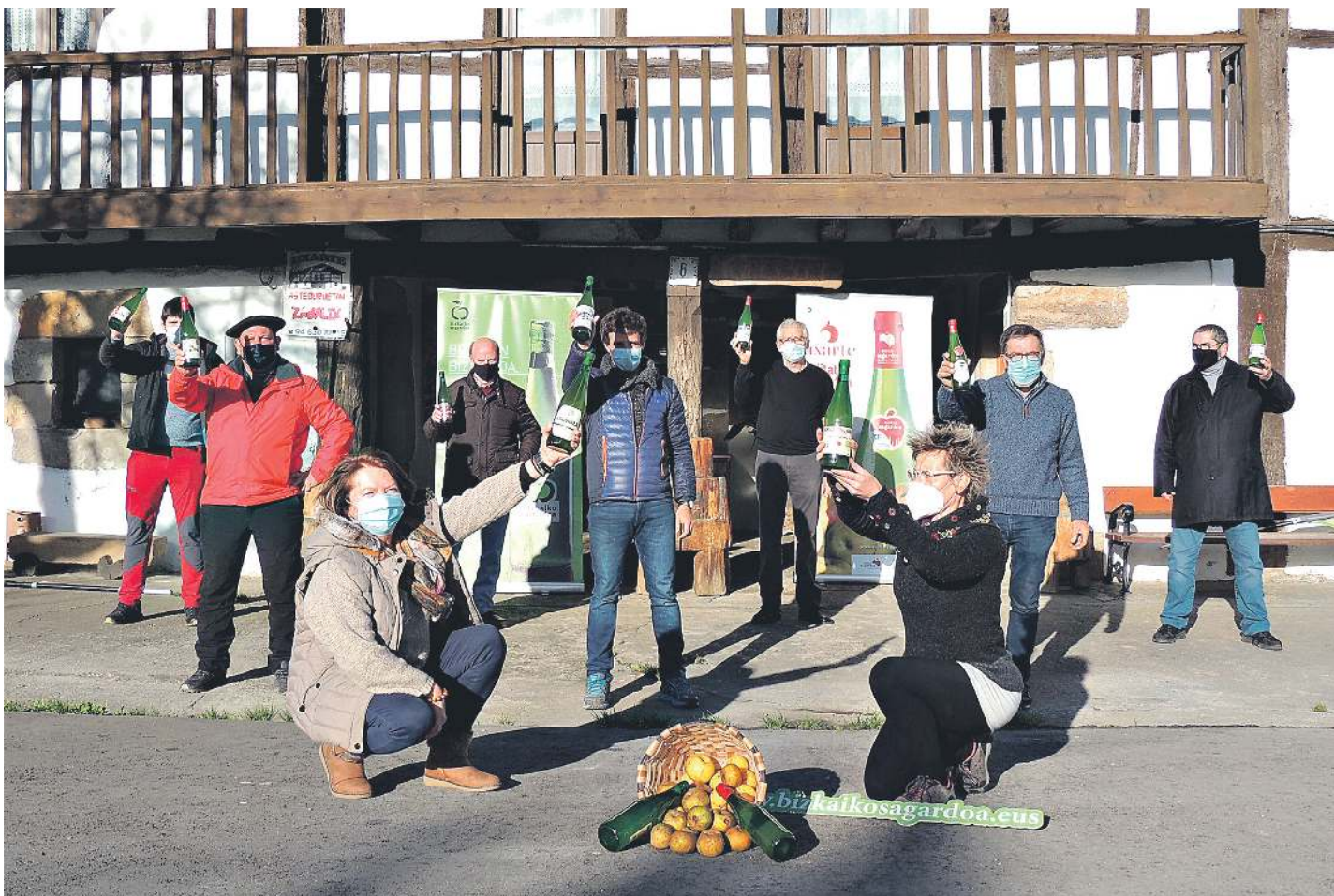
Bizkaiko sagardo garaia ren aurkezpena Zornotzako Uxarte sagardotegian. BIZKAIKO SAGARDOGILEEN ELKARTEA

bat garatu baitu, egun indarrean dauden arauak betetzeko jarraitu behar diren jendeak jasotzen dituen baina, baldintza batzuk ulertzen dituen, jendeak sagardo berriaz ahalik eta segurtasun handienarekin gozatu ahal izan dezan eta esperientzia erakargarriagoa eta berritzaileagoa izan dadin.