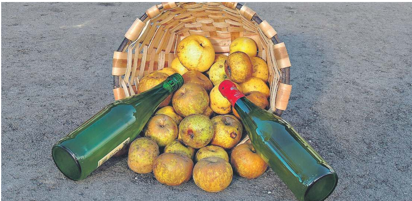
Bizkaian 2020ko sagar uztarekin egindako sagardoak izaera handikoak dira. BIZKAIKO SAGARDOGILEEN ELKARTEA