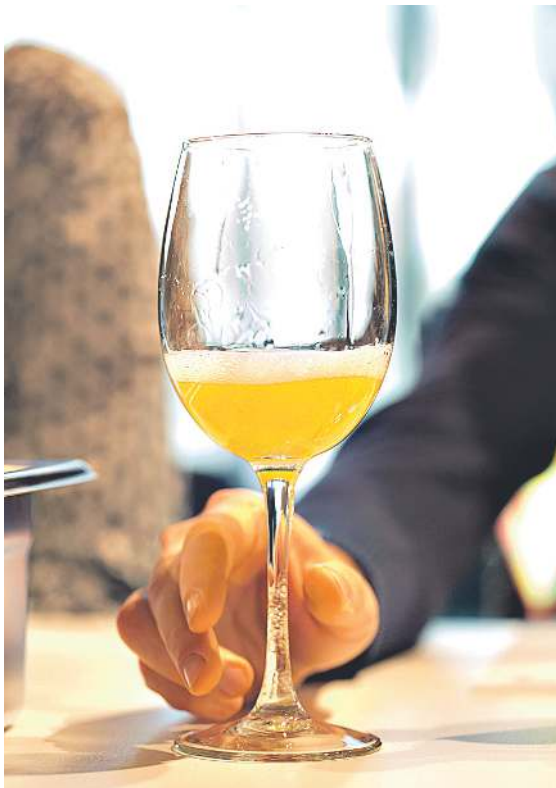
Euskal Herriko eta beste zenbait herrialdetako sagardo motak dastatu ahal izango dira IV. Sagardo Forumean egingo den Nazioarteko Sagardo Azokan. SAGARDOAREN LURRALDEA