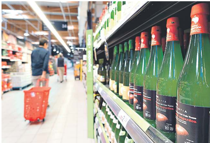
Sagardo botilak, Eroski kooperatibaren saltoki bateko apal batzuetan. MITXI

Euskal Sagardoa jatorri izena daraman sagardoa bertako sagarrek bakarrik egiten da. Sagarraren ekoizpena profesionalizatzen ari dira pixkanaka, sagarrak ahalik eta kalitate onenekoak eta uztak orekatuak izan daitezten eta, era berean, Euskal Sagardoaren kalitatea bermatzen. «Horrekin batera, Eroski bera, banatzaile den aldetik, funtsezkoa da sagardoaren sektorearen etorkizuna