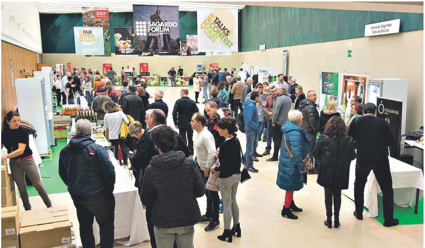
III. Sagardo Forumean egin zen Nazioarteko Sagardo Azoka, Donostiako Kursaal jauregian. SAGARDOAREN LURRALDEA