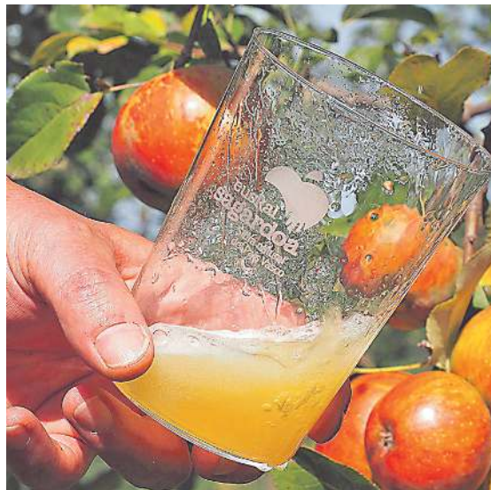
Euskal Sagardoa sor-markako sagardoa dastatzen, sagarrondo baten ondoan. EUSKAL SAGARDOA

baititzake, hala nahi bada, kaxa berean nahastuta gainera. Beraz, plataformak Euskal Sagardoa bertako kontsumitzaileei eta munduko txoko gehienetakoei jartzen die eskura, klik bakarrean.