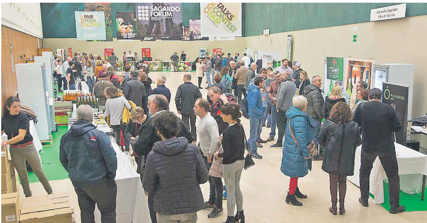
III. Sagardo Forumean egin zen Nazioarteko Sagardo Azoka, Donostiako Kursaal jauregian. SAGARDOAREN LURRALDEA