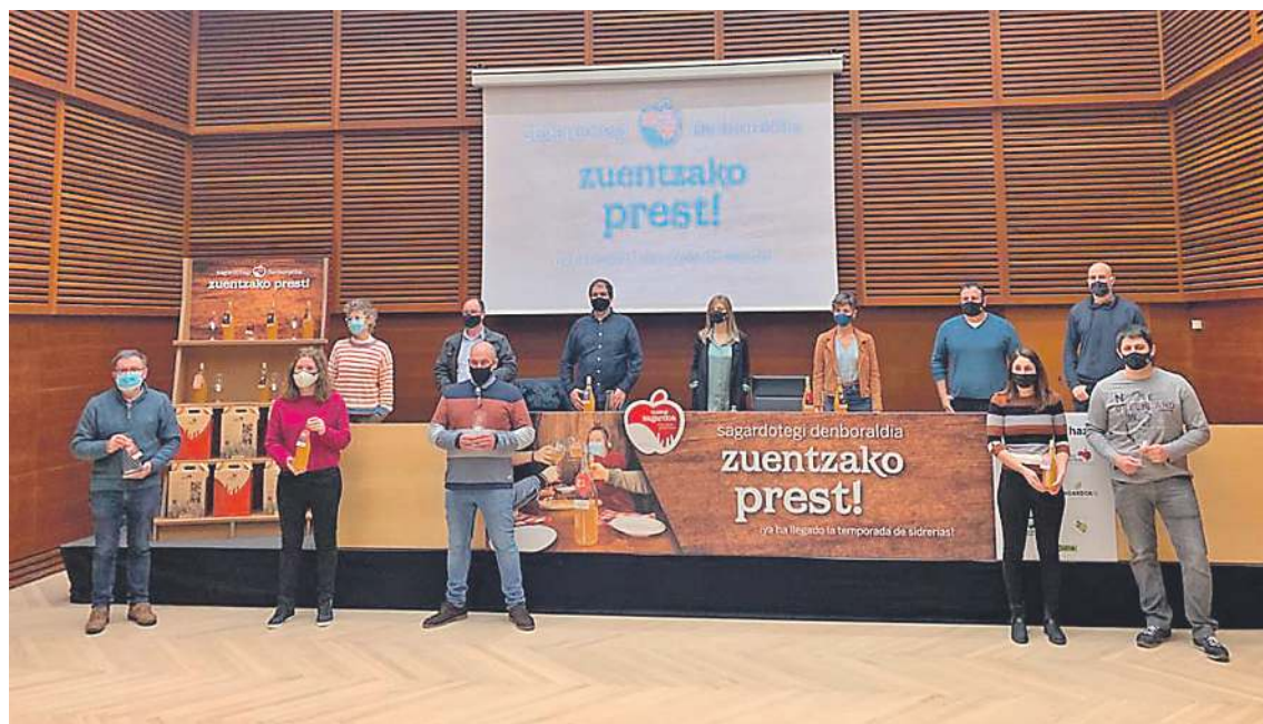
Sagardotegi garaiaaren aurkezpena, Donostiako Kursaallean, urtarrilaren 19an. Euskal Sagardoa jatorri izeneko ordezkariak eta Arabako, Bizkaiko eta Gipuzkoako sagardogileen elkartetako ordezkariak, sagardo botilekin. GIPUZKOAKO SAGARDOGILEEN ELKARTEA

Uzta berria mahaian kontsumitzea berritzailea da, baina, aldi berean, antzinako kontsumitze modua berreskuratzeko pausoa. Garai batean pitxerretan zer-