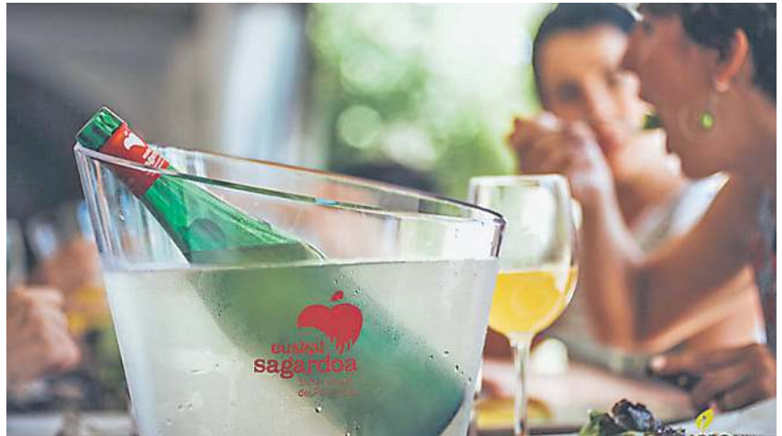
Euskal Sagardoa sor-markako sagardo botila bat, taberna bateko terraza batean. EUSKAL SAGARDOA

Horrela, herritarrek Euskal Sagardoa bakarrik lortu beharrean, Euskal Sagardo desberdinak lor-