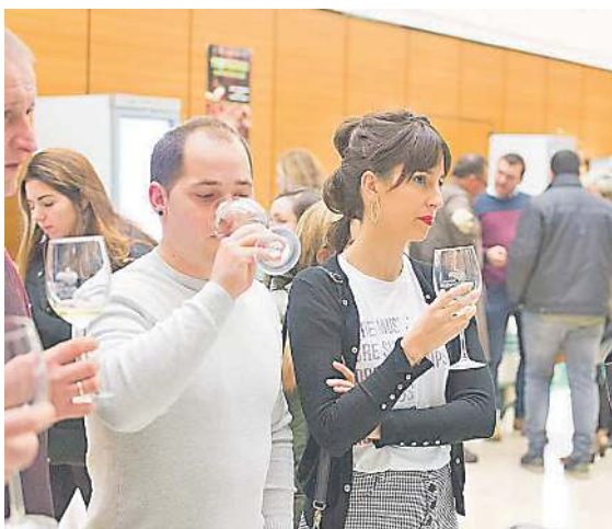
Euskal Herriko eta beste herrialde batzuetako ekoizleen sagardo motak dastatu ahal izango dira IV. Sagardo Forumean egingo den Nazioarteko Sagardo Azokan, aurrekoan bezala. SAGARDOAREN LURRALDEA

IV. Sagardo Foruma egingo da azaroaren amaieran; sagardoari buruzko jardunaldi garrantzitsu bihurtu da nazioartean.