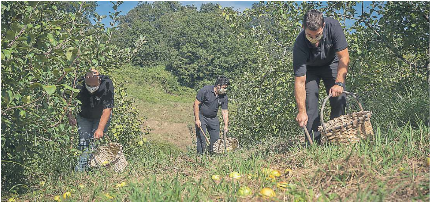
Sagarrak jasotzen, Petritegi sagardotegiaren sagastietan, iazko irailean.