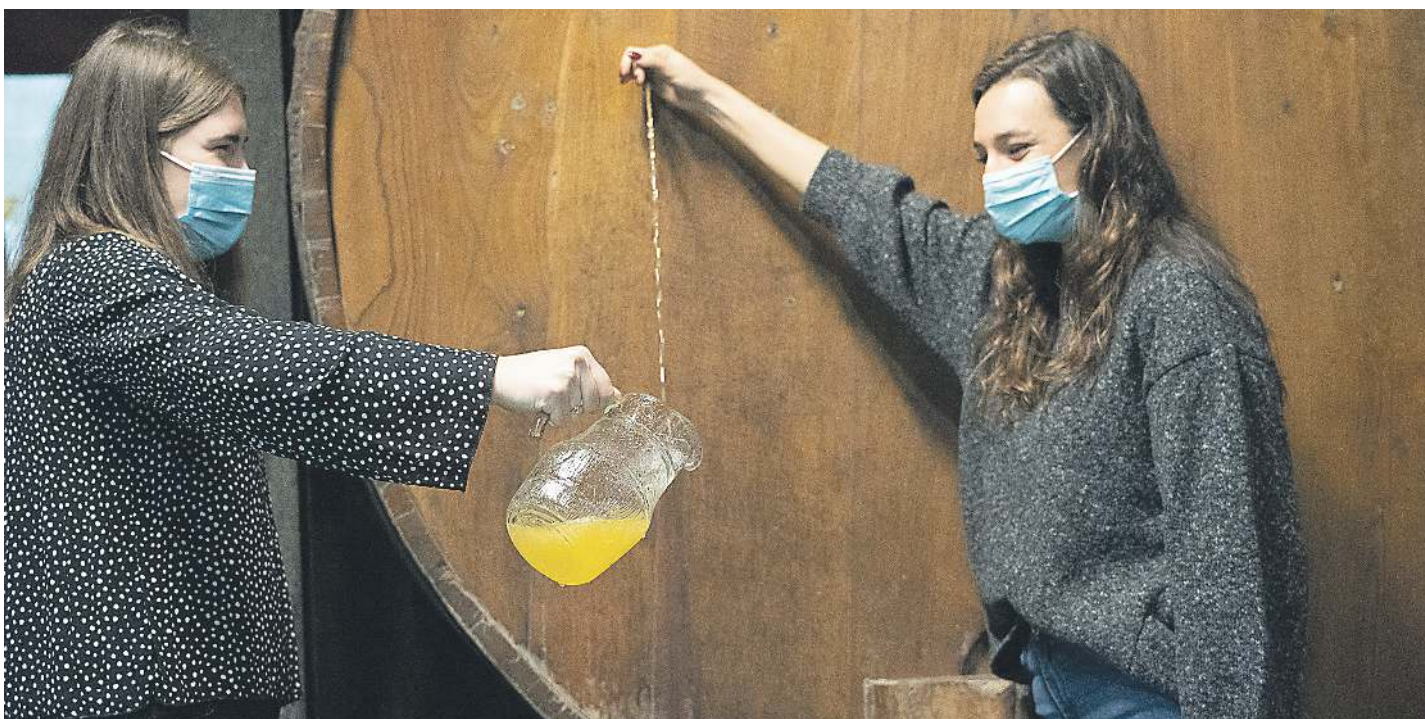
Sagardo ona dastatu ahal izango da sagardotegietan, gorputz eta izaera handikoa. Irudian, Usurbilgo (Gipuzkoa) Aialde-Berri sagardotegian.

2020ko uztako sagarrekin egindako sagardo ederra dastatu ahal izango da sagardotegietan.