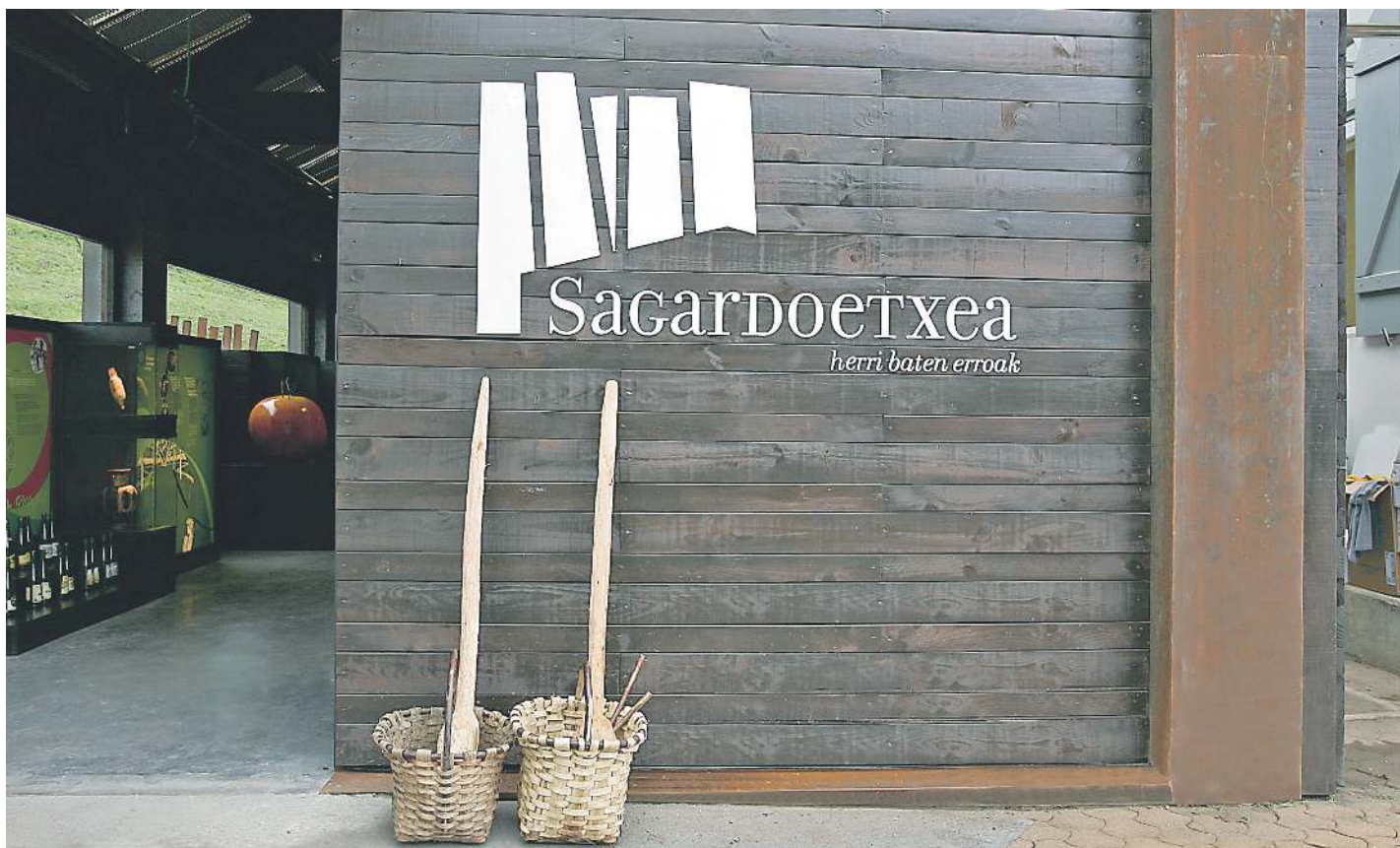
Sagardoetxea Euskal Sagardoaren Museoaren ataria SAGARDOETXEA