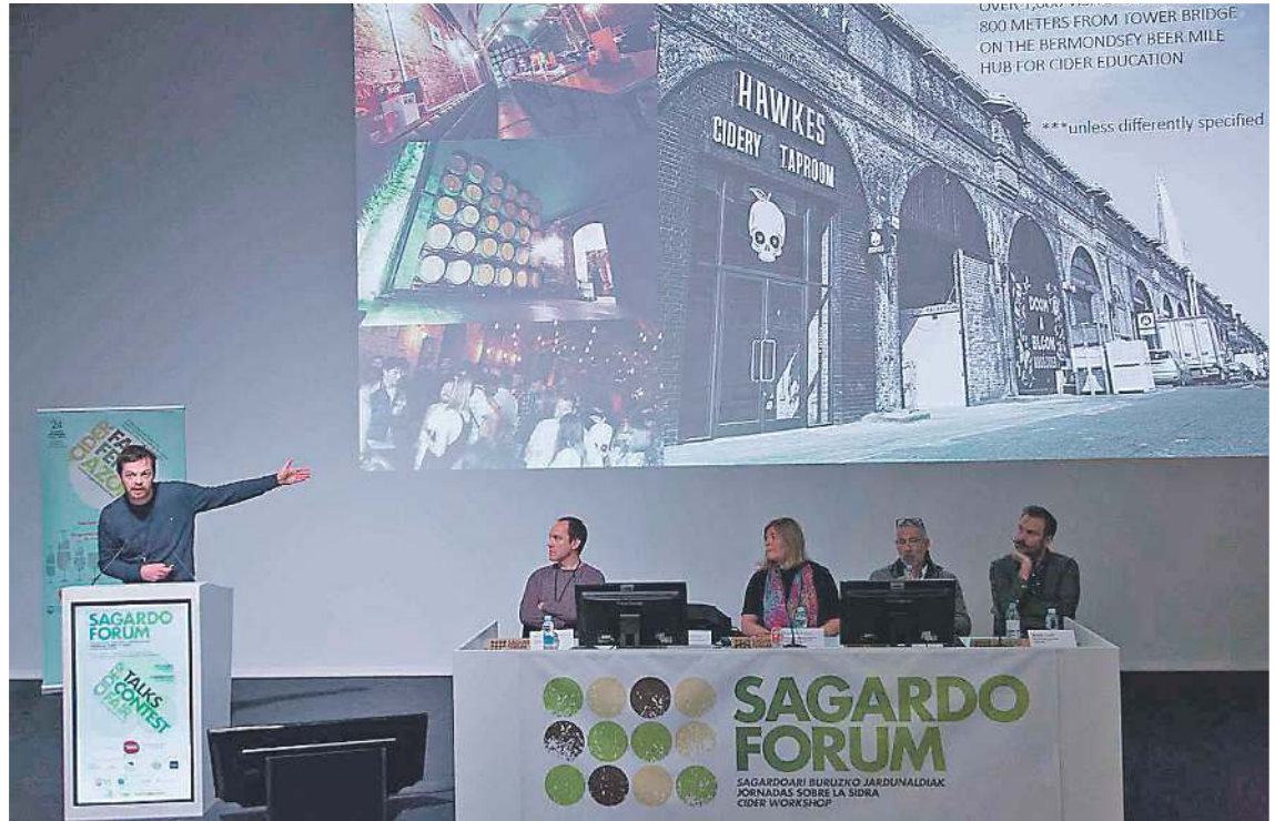
III. Sagardo Forumean antolatutako jardunaldi teknikoetako saio bat SAGARDOAREN LURRALDEAN

Aurten ere, bertako, nazioko zein nazioarteko epaileek, beste-