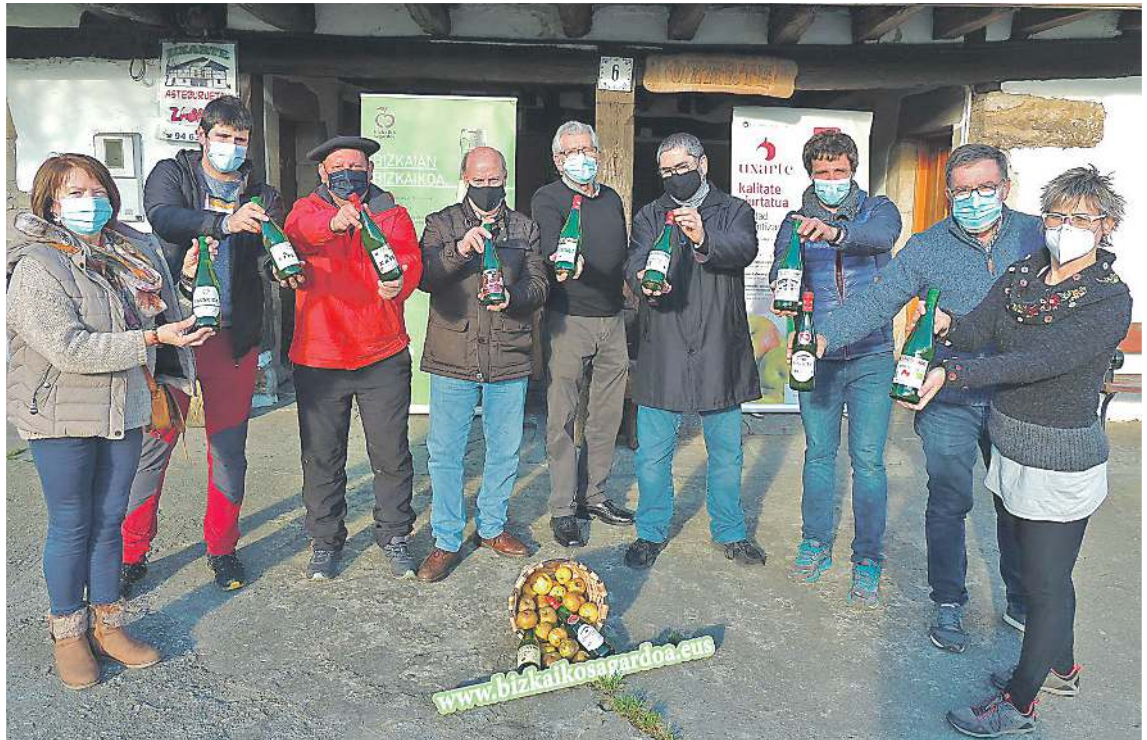
Bizkaiko sagardo denboraldiaren aurkezpena Zornotzako Uxarte sagardotegian.

Euskal Herri osoan bezala, Bizkaian sagar uzta beste urte batzuetan baino urriagoa izan da. Aurreko uzta-aren ugartasunak (150.000 litro) sagarrondoak agortzea eragin zuen, eta 2020ko neguko klimatologiak, hotzik