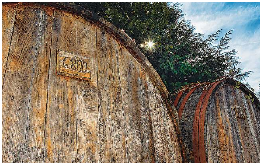
Sagardoa egiteko sagarrak eta upelak. SAGARDOAREN LURRALDEA - JOSE LOPEZ JAUREGI