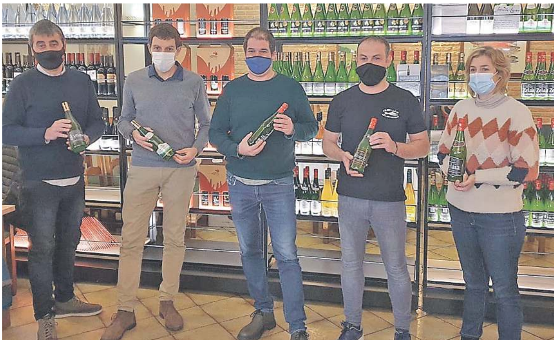
Ibailur Sagardotekaren aurkezpena. EUSKAL SAGARDOA