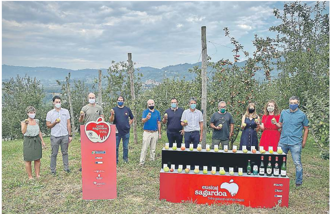
Euskal Sagardoa sor-markarako sagar bilketaren aurkezpena, Villabonako (Gipuzkoa) Otararreko sagasti esperimentalean, irailaren 17an. EUSKAL SAGARDOA

@ Informazio gehiago bildu nahi izanez gero, bisitatu webgune hau: www.euskalsagardoa.eus