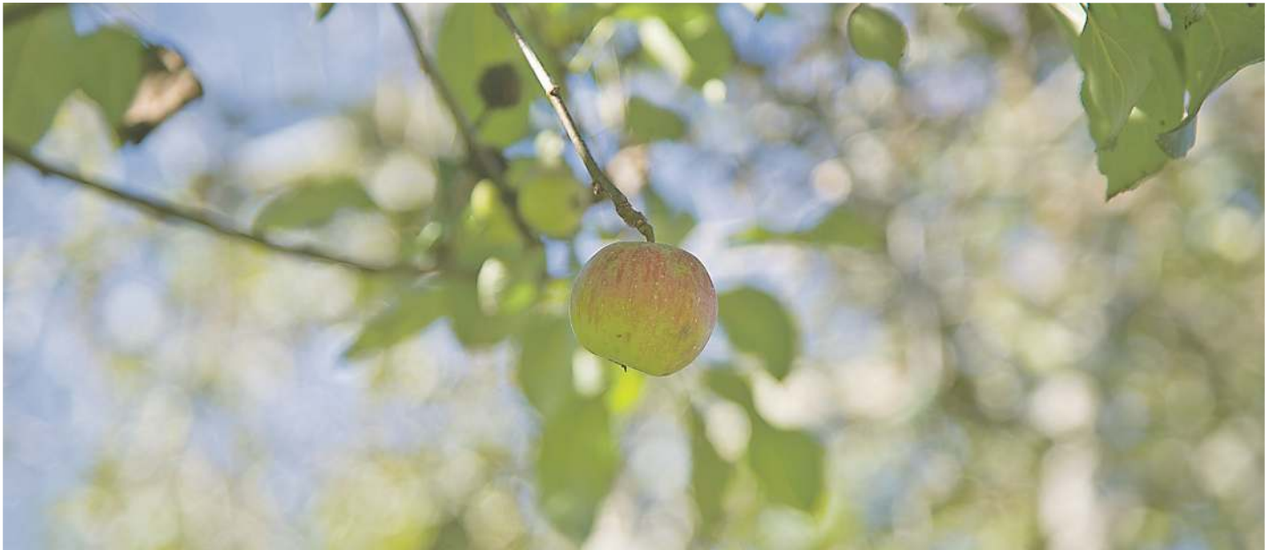
Sagasti batzuk, sagardoa egiteko sagarrekin. SAGARDOAREN LURRALDEA