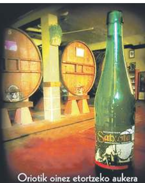
Oriotik oinez etortzeko aukera

Santio Erreka Auzoa AIA (Oriotik kilometro batera) 943 83 57 38 - 618 303 584 www.sidrerasatxota.com