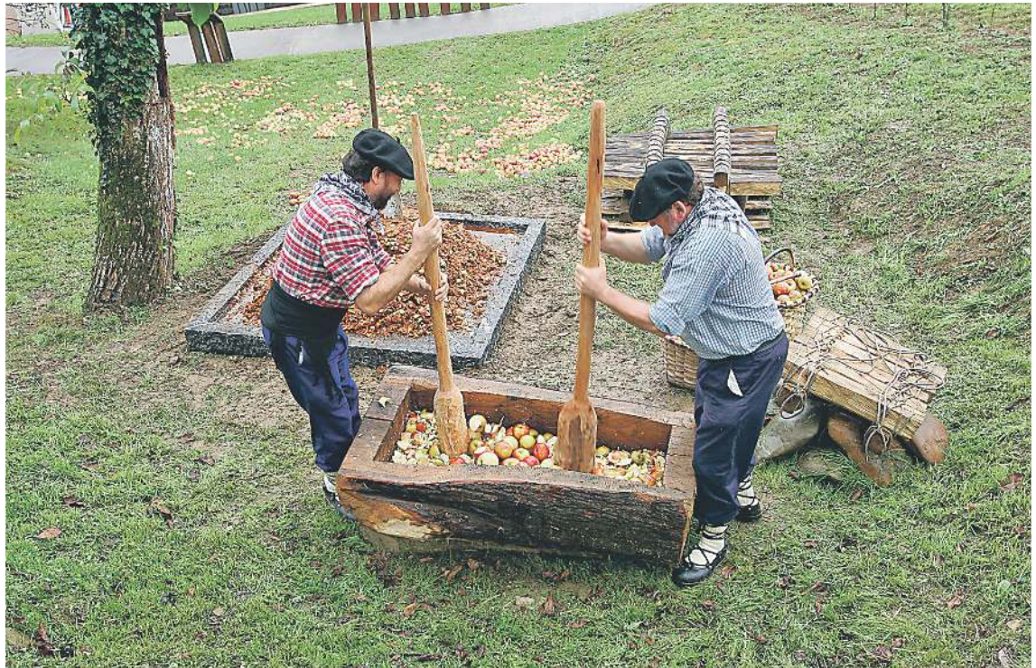
Sagarra jotzen, Sagardoetxearen kanpoaldean dagoen sagastian. Bisitariak Sagardoetxeko dolarean egiten den muztioa dasta dezakete. SAGARDOETXEA

bala dago katalogatua Sagarraren eta Sagardoaren Dokumentazio Zentroan: hemerrotekako 11.634 albiste, 178 liburu, 2.866 dokumentu, 325 bideo eta 40.713 argazki. Informazio hori online kontsultatu ahal izateko, Sagard