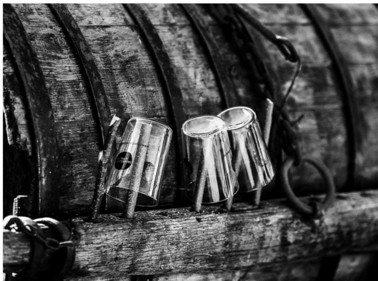
Las arrugas centenarias de la madera y el fino cristal se abrazan en el ritual del Txotx.