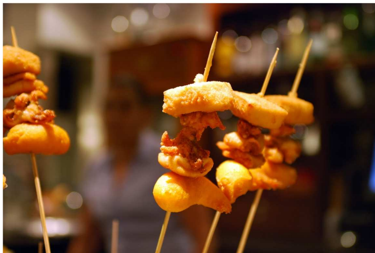
La sencillez de una fritura ensalza la barra de La Casa del Patrón.