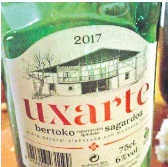
Uxarte sagardotegiak ekoiztiriko sagardo botila bat. UXARTE