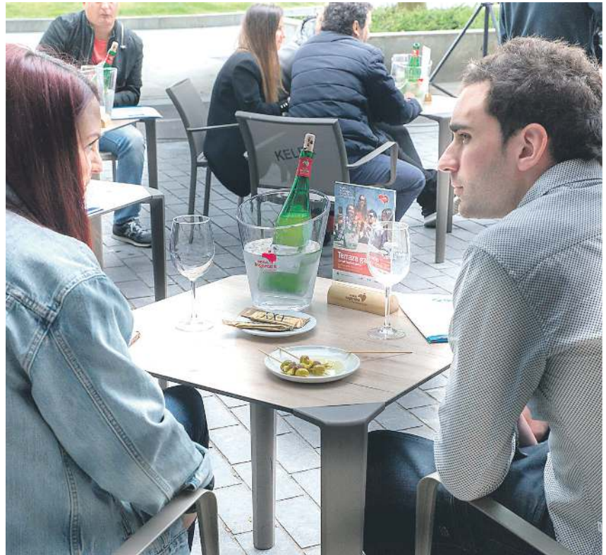
Euskal Sagardoa ederra da mokadu gozoi laguntzeko. EUSKAL SAGARDOA

Irailean eta urrian bildu zuten Euskal Sagardoa jatorri izeneko sagarra, azken urteetako uztarik emankorrenean; sagar asko bildu baita. 4 milioi litro inguru sagardo egin dira Euskal Sagardoa jatorri izeneko sagardoa ekoizteko, eta, horretarako, Arabako, Bizkaiko eta Gipuzkoako 6 bat milioi sagar baliatu dira. Horretarako, 250 hektareako sagastietako sagarra erabili da. Sor-markan 115 sagar mota daude onartuta, baina 24