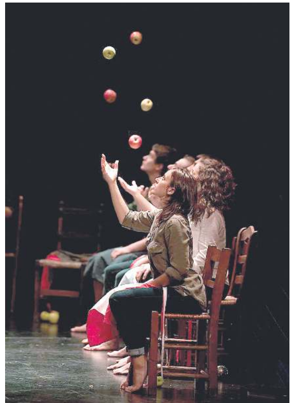
Oinkari dantza taldearen eta Hika Teatroa taldearen Sagartu ikuskizuna.

Hika Teatroa konpainiak eta Oinkari taldeak Sagartu ikuskizuna sortu dute, hasieran kalean emateko, eta Kalerki Zarauzko 24. Kale Antzerki Jaialdian estreinatu zuten iaizko uztailaren 8an; baina aretorako ere moldatu dute, eta Bilboko Campos antzokian aurkeztu zuten aurtengo