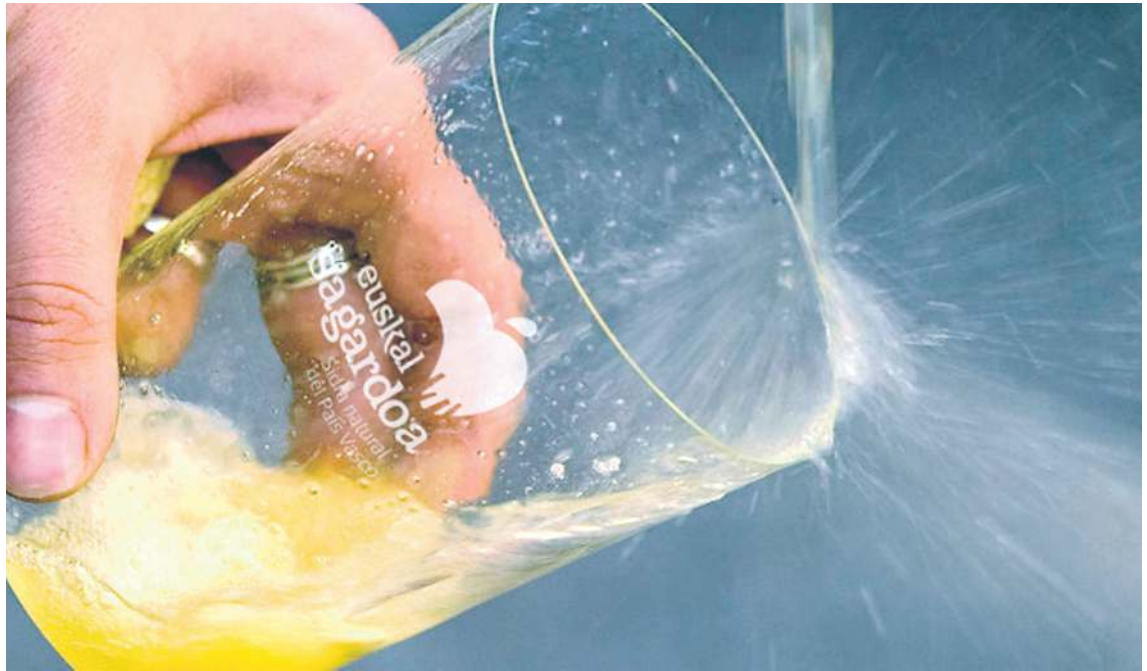
Txotx egiten, Euskal Sagardoa jatorri izena duen sagardoarekin eta edalontzi batekin. EUSKAL SAGARDOA

ri izenaren bidetik, sagardogileen sektoreak egindako ahaleginak eraginda eta Gipuzkoako Foru Aldundiak lagunduta, sagasti berriak aldatzen ari dira Gipuzkoan, eta datozen urteetan sagasti berri ugari izatea aurreikusten da. Horretarako, Gipuzkoako Foru Aldundiak sagardoa ekoizteko sagarrondoak landatu,