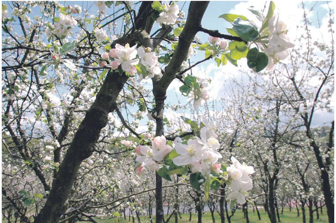
Eztigar kooperatibaren sagarrondo batzuk, loretan, Donaitxin.

18:00. Elektro-Patxaranga musika taldea kaleetan zehar.