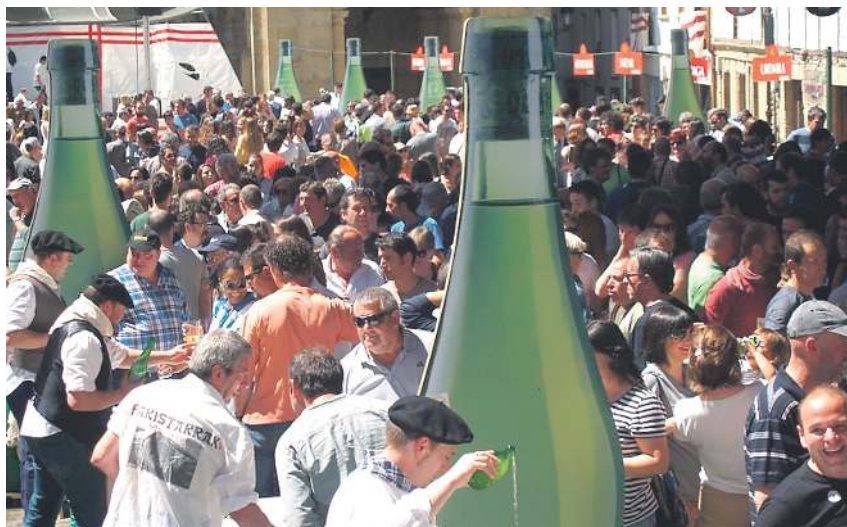
Sagardo eta talo ederrak dastatu, eta lagunekin eta familiarekin ederki pasatu ahal izango da Usurbilgo Sagardo Egunean, maiatzaren 20an. NOAUA!