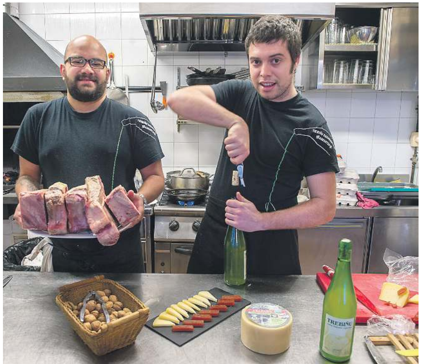
Upelak eta sagardo botilak, Lekarozko Larraldea sagardotegian, eta, botila bat irekitzen, Askartzako Trebiñu sagardotegian.

%100 Euskal Herriko sagarra erabili dute, Arabako Sagartzale eta Sagardozale Elkarteak azaldu duenez. Arabako sagarra izan da gehiena. Aramaion 2017ko uzta oso handia izan da, baina Trebiñun, beranduko izotza dela eta, ingurutik ekarri behar izan dute sagarra. Araban, oro har, sagar oso osasuntsua bildu dute, neurri onekoa.