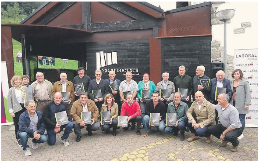
Sagardogile liburuaren egileak eta sagardogileak, Sagardoetxean, aurkezpen ekitaldian. SAGARDOAREN LURRALDEA