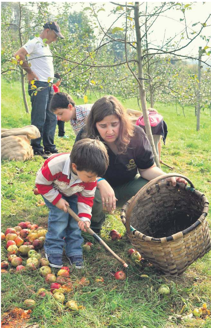
Sagarrak jasotzen Petritegi sagardotegiaren sagastietan.

Halaber, Sagari Uztako antolatzailerak jakinarazi zuten ekintza berezi bat prestatzen ari direla 2019ko Emakumeen Nazioarteko