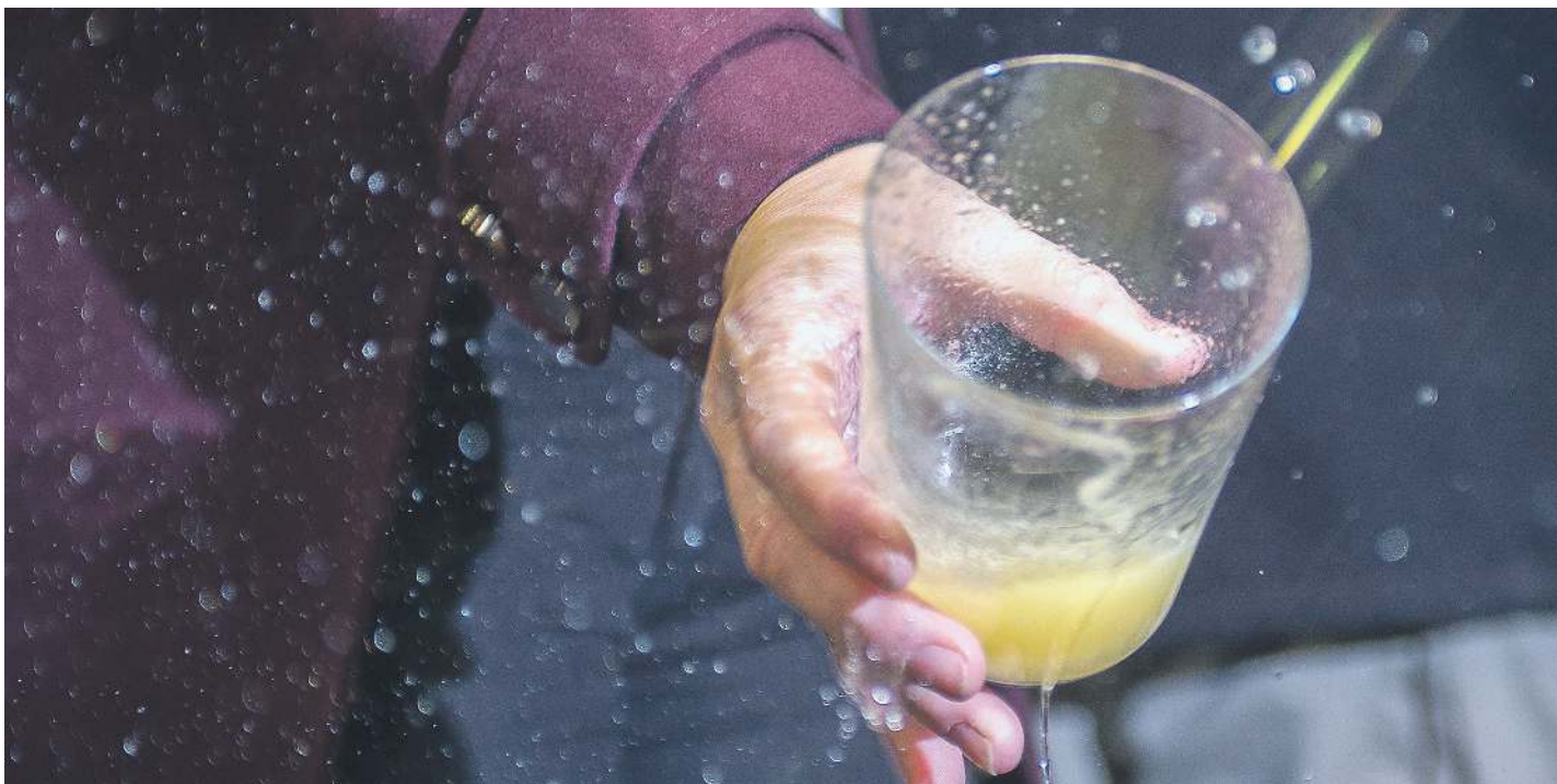
Sagardotegietan gorputz eta izaera handiko sagardoa dastatu ahal izango da, txinparta finekoa.

2018ko uztako sagardoa dastatzeko, lagun ugari bilduko da Euskal Herriko sagardotegietara aurtengo txotx sasoian.