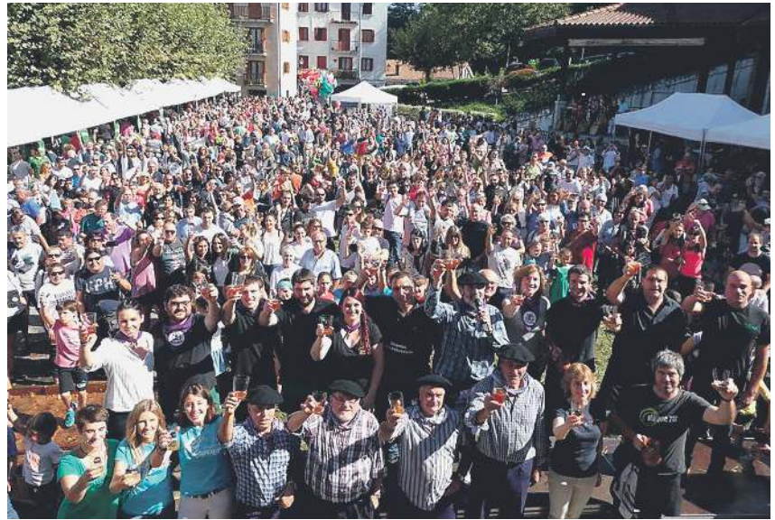
Gipuzkoako sagardogileak, 2018ko uzta ospatzeko lehen muztioarekin topa egiten, Astigarragan, irailaren 30ean.

Arabian, sagardoa egiten ez ezik, lan handia ari dira egiten bertako sagar motak berreskuratzen, aztertzen eta gordetzen, garrai batean sagardo asko egiten baitzen Araban, eta sagar aberatasun hori oraindik ere txoko askotan baitago. Sagarrondoak lokalizatzeke, sagarrak aztertzeke