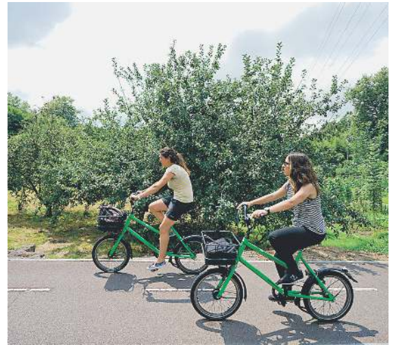
Donostiatik Astigarragara, sagastien ondotik, txango ederra egin daitezke bizikletaz, SagarBike esperientziaren bidez. SAGARDOAREN LURRALDEA

Xendazaletasuna eta ibilaldia: Santiagomendiko paisaia naturalaz oinez ( Sagartrekking ) nahiz bizikleta elektrikoan ( Cidercycling ) gozatzeko aukera, bertako baserrien historia, biztanleen bizimodua eta Gipuzkoako Doneja-