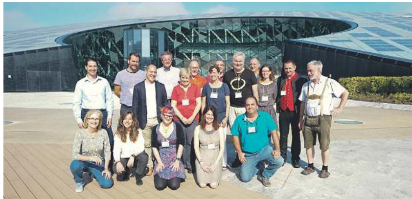
Sagardoaren Kultura eta Turismoaren Nazioarteko Topaketan parte hartu zuten herrietako ordezkariak, antolatzaileekin, Hernaniko Orona Ideo gunean. SAGARDOAREN LURRALDEA

Sagardoak hazkunde handia izan du mundu osoan, bai ekoizpen aldetik, bai turismo aldetik, eskuz modu naturalean aritzen diren sagardotegi txikiel lotuta. Horrela, lankidetzaz garrantzitsua da industria hori garatzeko eta be-