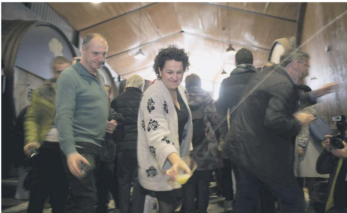
Txotx irekiera, iazko Sagardo Berriaren Egunean, Astigarragako Gurutzeta sagardotegian.