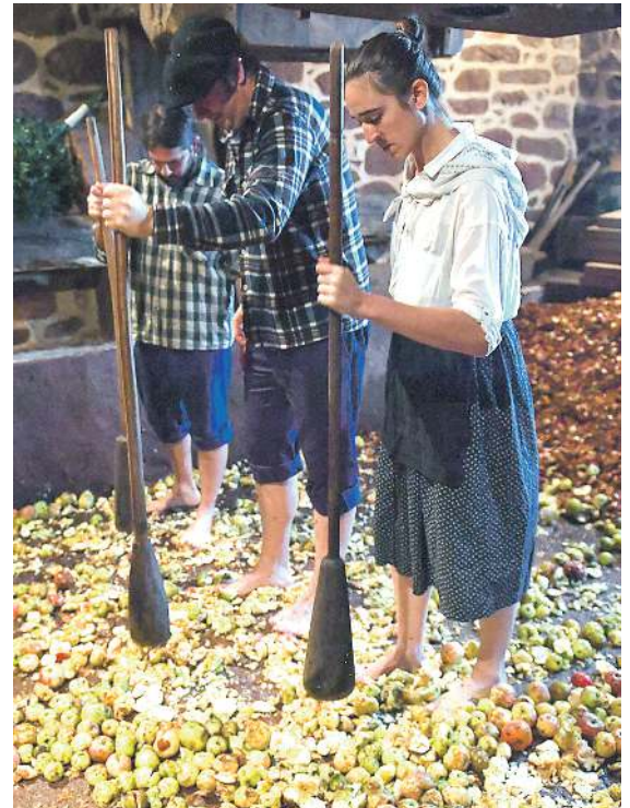
Sagarra jotzen Kirikoketa festan.

baserri-museoan dolarea martxan jarri zuten urrian, urtero bezala, 17. Sagardo Astean, eta aurreko sagarraren ziklo iraunkorren inguruan kontzientziazten ahaleginu dira. Igartubeiti baserria XVI. mendekoa da, eta 2001az geroztik museo baten zeregina betetzen du.