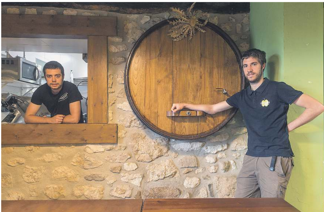
Askartzako Trebiñu sagardotegia.