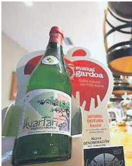
Kuartango markako sagardo botila bat. KUARTANGO SAGARDOTEGIA

doa ateratzeko eta jendeari emateko, dasta dezan».