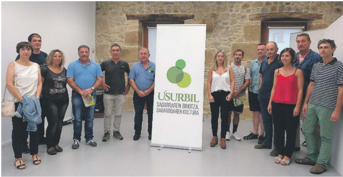
Usurbil: sagarraren bihotza, sagardoaren kultura marka aurkeztuko ekitaldia. USURBILGO UDALA