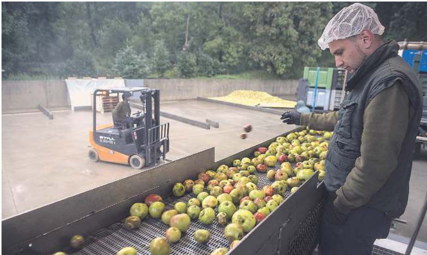
Sagarren garbitasun kontrolak egiten Zapiain sagardotegian.

Egunerako, martxoaren 8rako. Emakume sagardogileekin batera, Harituz taldeak morez jantziko ditu Sagardoetxeko sagastiko sagarrondoak, eskuz ehundutako estalki moreekin. Horrez gain, Harituz taldeko kideek grabatutako 365 hilos de sororidad dokumentala aurkeztuko dute, Matazak indarkeria matxistaren aurkako proiektuaren barruan. Gainera, martxoaren 17an, beste hainbat ekitaldi egingo dituzte. Sagar Uztan bertan antolatu zuten lehendabizikoa: kolore morekoak izan ziren sagarrak biltzeko erabilitako kizkiak.