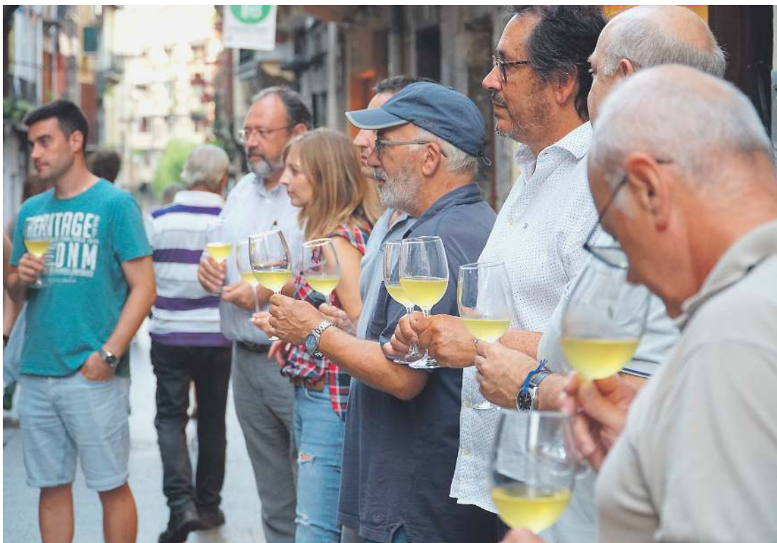
Euskal Sagardoa jatorri izena duen sagardoarekin pintxo-potea egiten Hernanin, Egin zotz! kanpainaren barruan. EUSKAL SAGARDOA