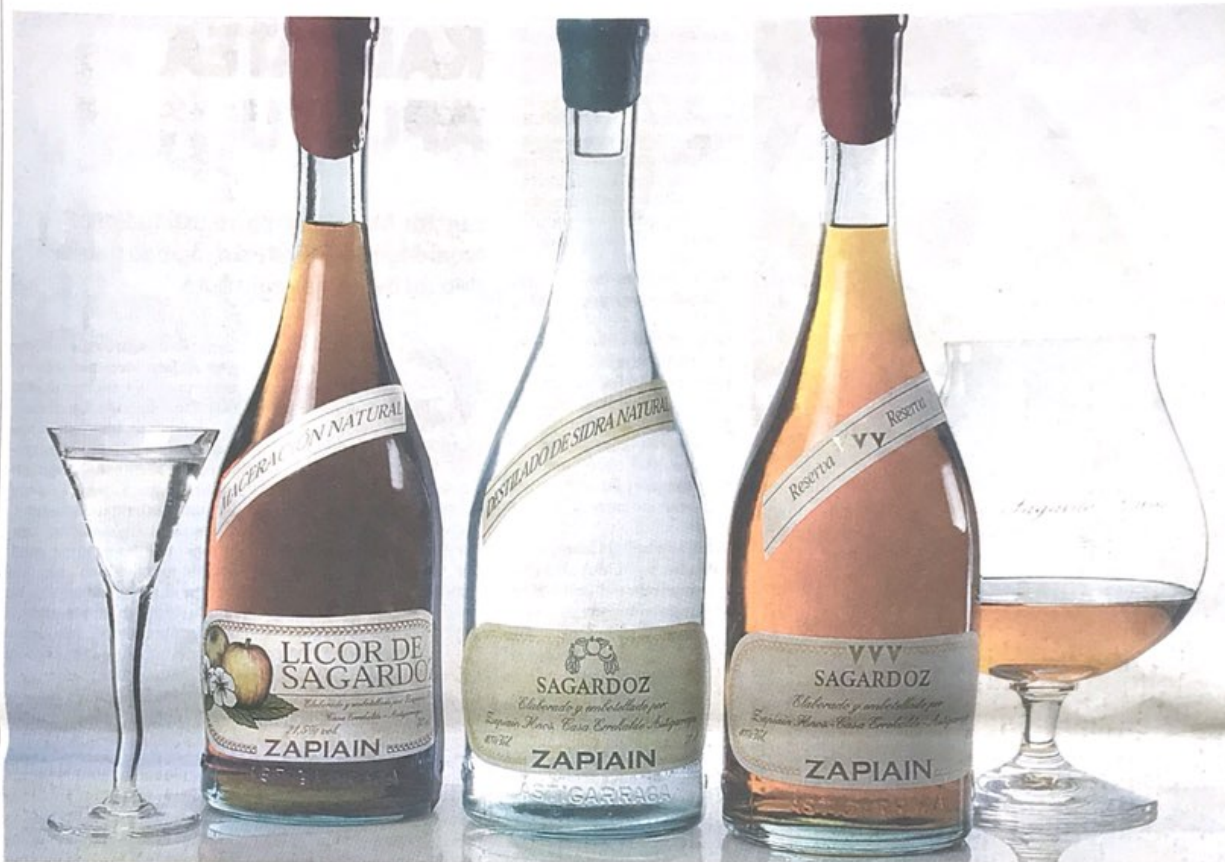
ESKAINITZA. Hainbat graduko likoreak eta ozpina egiten ditu Zapiain sagardotegiak. ZAPIAIN SAGARDOTEGIA