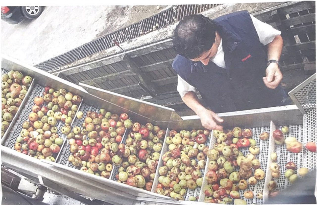
UGARI. Aurtan sagar uzta oparoa izan da, eta sagardogileek bertako sagar ugari izan dute. Argazkian, langile bat sagarra garbitzen dolarera sartu aurretik.