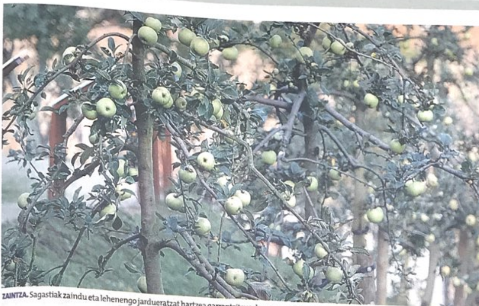
ZAINZA. Sagastiak zaindu eta lehenengo jardueratzat hartzea garrantzitsua da sagar onak izateko. BERBA