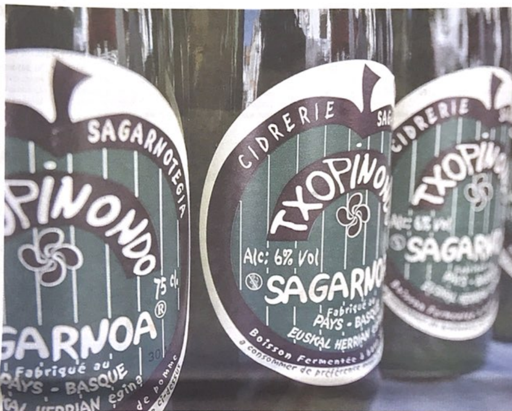
AUKERAN. Txopinondok sagardoaz gain edari ugari eskaintzen ditu. Argazkian, Txopinondoko sagardo botilak. NICOLAS MOLLO

Sagardoaz eta likoreez gain, ozipina ere egiten dute Zapiainen. Ho-