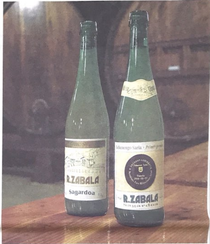
HIRUTAN. 2004, 2006 eta 2010. urteetan irabazi du Zabala sagardotegiak Gipuzkoako Foru Aldundiak antolatzen duen sagardo lehiaketa. Argazkian, 2006. urteko irabazleak etiketan txapelak duela.

gero, horrek esjittuko dizu gauzak ondo egin behar dituzula. Sagardoa hobetzeko intentzioarekin egiten duzu, eta horretarako lehenengo gauza sagarra behar duzu. Sagarra baldintza onetan etortzen bada, sagardoa ere horrela aterako da. Sagarra zaintzen bada, produktzio gehiago izango da, garbigoa eta, oro har, kalitate hobekoak izango da.