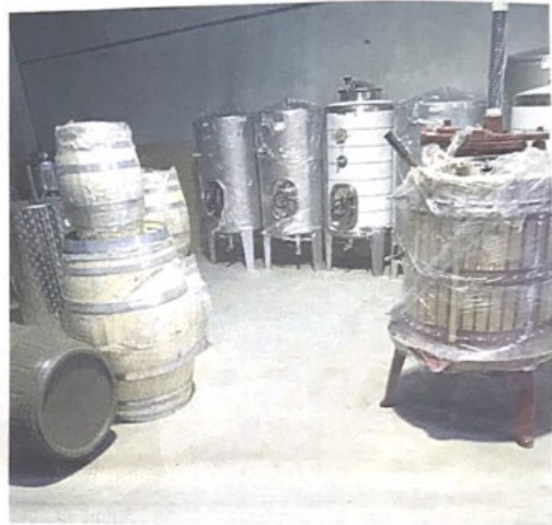
LANABESAK. Sagardogintzarako makineria eta tresnak egiten ditu Euskal Coemek.

Asturias Euskal Herriko sagardogileentzat erreferentzia izan dela aitortu du Coem Astureko zuzendariak. Bere funtzionamenduari buruz esan du makinak Italian erosi eta gero sagardotegien arabera diseinatu eta egokitzen dituztela. «Egin beharrek lanaren arabera, makina bat edo beste erosten da. Egite alorrari dagokionez, Asturiasen zein Euskal Herriko sagardotegiak hornitzen ditugunez, egunetik egunera egokitzen goazen tresneriak edo lan egiteko erak ditugu. Guk birrintzaile edo matxakatzaila berezi batzuk egiten ditugu. Prentsa pneumatikoa ere duela hamazazpi bat urte hasi gi-