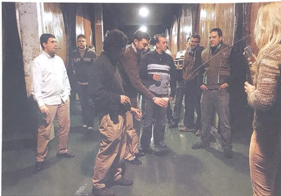
ATZERRIRA. Petritegi eta Astarbe sagardotegiek sagardoa atzerrira bidaltzen dute. Argazkian, sagardozelek txotx egiten Petritegin...