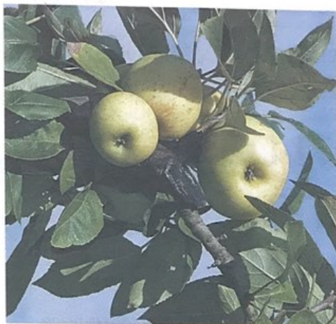
KALITATEA. Sagarrondoak zaindu eta produkzioa handitu nahi du Sagarlanek. Argazkian, sagarrak adarretik zintzilik. MARISOL VABEN

Aurten sagar uzta handiko urtea izan bada ere, sagardoa egiteko, kanpotik sagarra ekarri behar izan dute sagardotegi batek baino gehiagok. Egoera bestelakoa izango litzateke, sagastiak zaintzeko profesional egokiak egongo balira. Horretan dihardu Sagarlanek. «Sagastietan eman beharreko lan guztiei buruzko aholkuak ematen ditugu, kimaketari buruzkoak, emankortzeari buruzkoak, gaitz eta gaixotasunen aurkako plagak