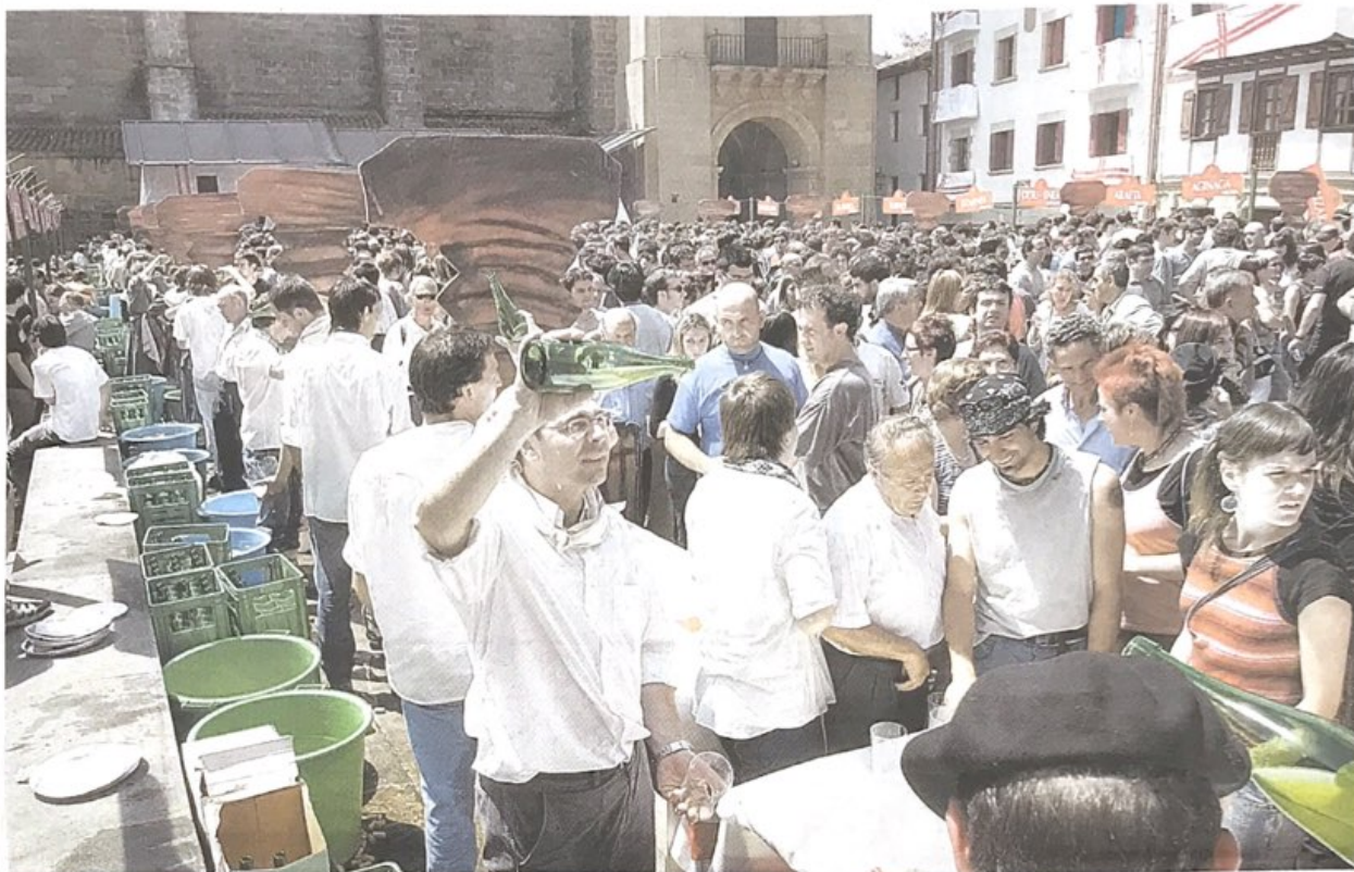
TRADIZIOA. Botilako sagardoa berreskuratzeako antolatutako duela 30 urte Usurbilgo Sagardo Eguna, eta, oraindik, arrakasta handia du.