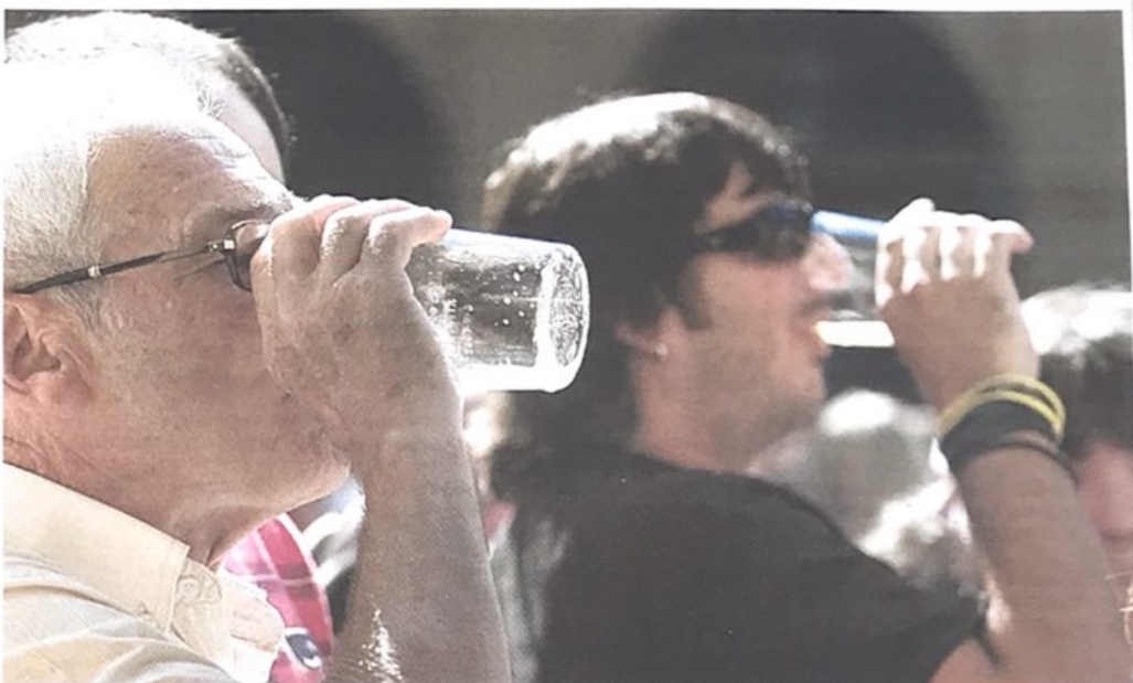
AUKERA. Sagardo mota ezberdinak dastatzeko aukera izango da. Argazkian, bi gizon, sagardoa dastatzen.

Udaberrian sartuta gaude bete-betean, eta sagastiak lorez beteta daude. Eguraldiak hainbat gora-behera izaten ditu, eta apirilko egun euritsuek maiatzeko egun beroei txanda eman diete. Horrek loraldian eragiten duela aitortu du Gipuzkoako Foru Aldundiko Fruitu Garapenerako teknikariak. «Maiatza apirila baino epelago eta euri gutxiagorekin doa. Sagarmota batzuk, goiz loratzen direnak, uzta gutxiakoak izango dira, baina maiatzean loratzen direnak asko izango direla uste dut. Oraingoz, lore asko ikusten da, eta uzta oneko urtea izango dela dirudi», esan du.