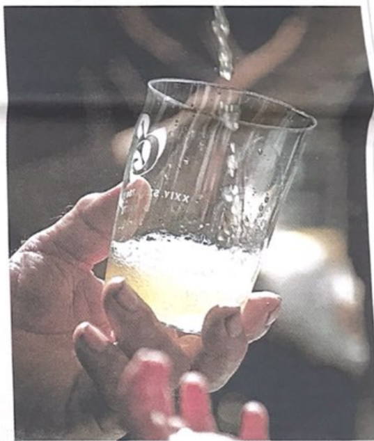
PROTAGONISTAK. Botilak eta edalontziak protagonistak izango dira Usurbilgo Sagardo Egunean.