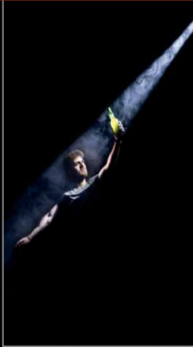
"Pintando con luz", d'Arturo Rodríguez Ortiz, semeya ganaora del pasáu Concursu de Semeyes LA SIDRA.