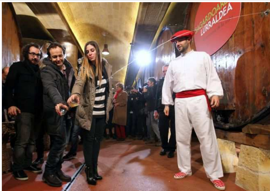
Los integrantes de la Oreja de Van Gogh (i), abren la vigésima temporada del "txotx" en Gipuzkoa, al disfrutar del honor de ser los primeros en probar directamente de la "kupela" un caldo "fresco, afrutado y con cuerpo".

Con el paso de los años, este hecho se ha transformado en la liturgia del "txotx", cada vez más extendida en Euskadi. Una tradición que consiste en compartir mesa y mantel, con el preciado caldo de manzana y que reúne a su vez otras muchas particularidades. Entre ellas, el relativo corto periodo de tiempo en el que se lleva a cabo.