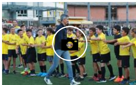
📷 Imanol Alguacil, homenajeado en Orio