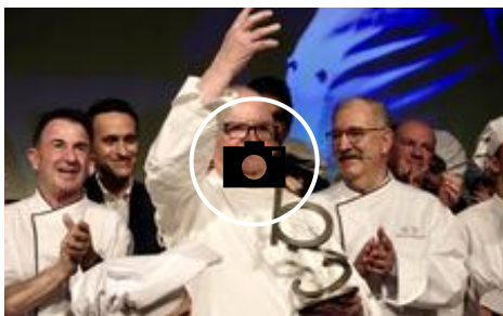
📷 Homenaje a Arzak de la gastronomía vasca