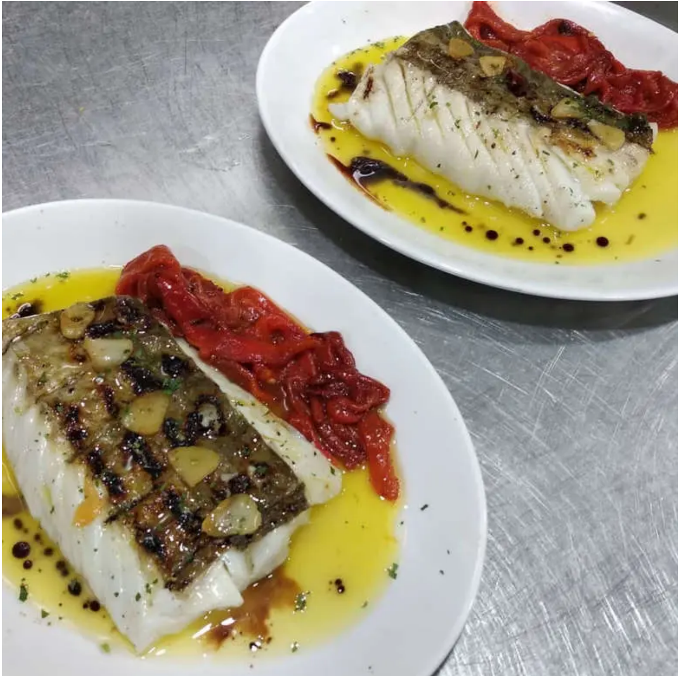
Bacalao a la parrilla de Sidrería Arizia.

Su menú de sidrería, a un precio de 40 euros , consiste en tortilla de bacalao, bacalao confitado con pimientos verdes, chuleta de vaca asada a la parrilla, queso Idiazabal , dulce de manzana, nueces, tejas y cigarrillos de Eceiza (dulces típicos vascos), y sidra al txotx . ¿Se podría pedir más? Francamente, creemos que no.