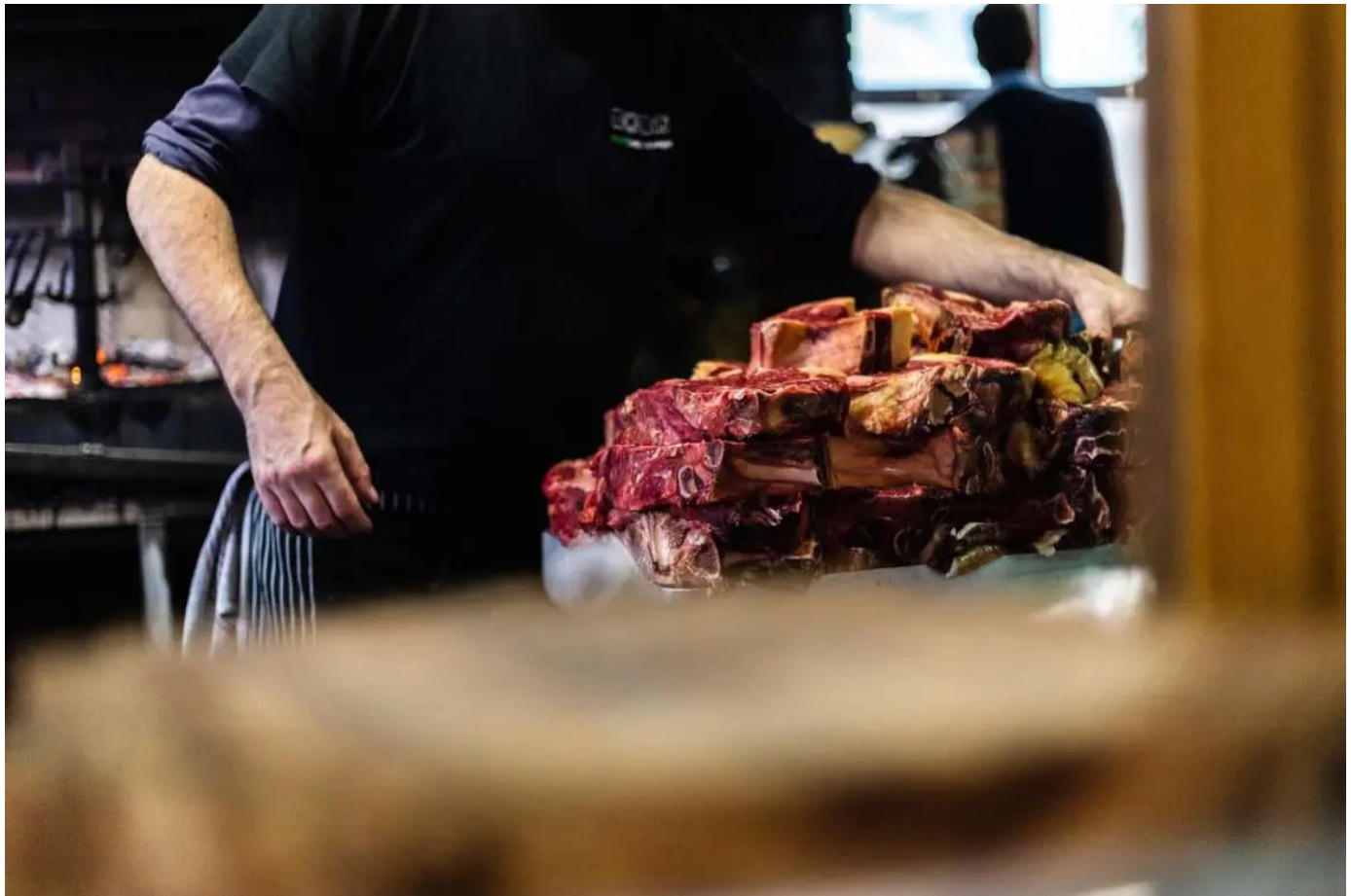
El chuletón es un 'must' en el menú de sidrería.

Una vez allí se debe pedir el menú típico de sidrería . Por unos 25-40 euros suele incluir chorizo o chistorra a la sidra, tortilla de bacalao , bacalao frito con pimientos, un chuletón de vaca y un postre que se compone de nueces, membrillo, quesos artesanos de la zona y algún dulce típico. Por supuesto, todo regado principalmente con sidra .