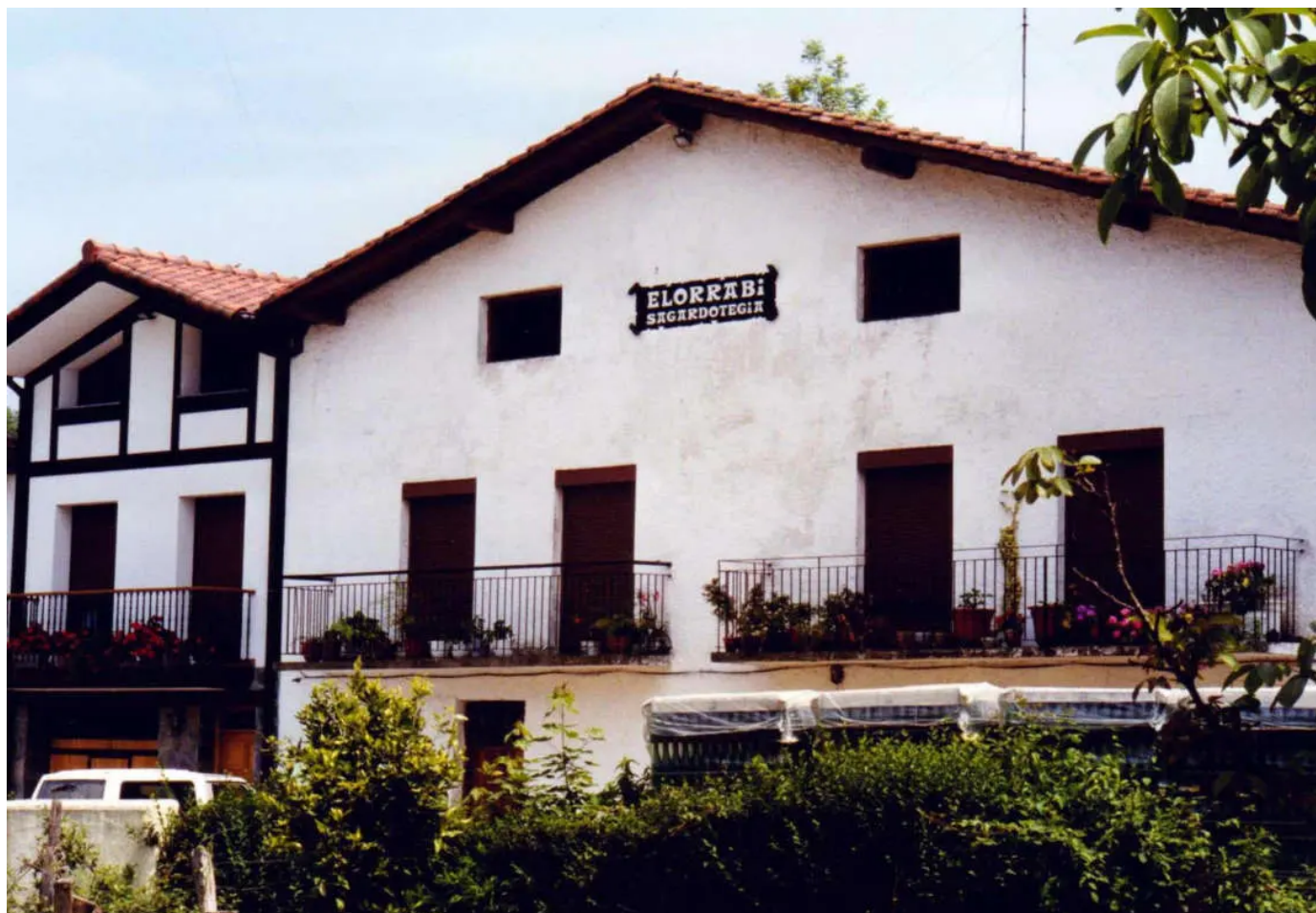
El caserío de 500 años de antigüedad de la Sidrería Elorrabi.

Aquí se elabora una sidra natural de significada calidad, tal y como lo avalan los diversos premios obtenidos en diferentes concursos. Producen alrededor de unos 106.000 litros de sidra anuales , parte de los cuales son elaborados con manzanas de cosecha propia y de caseríos de los alrededores.