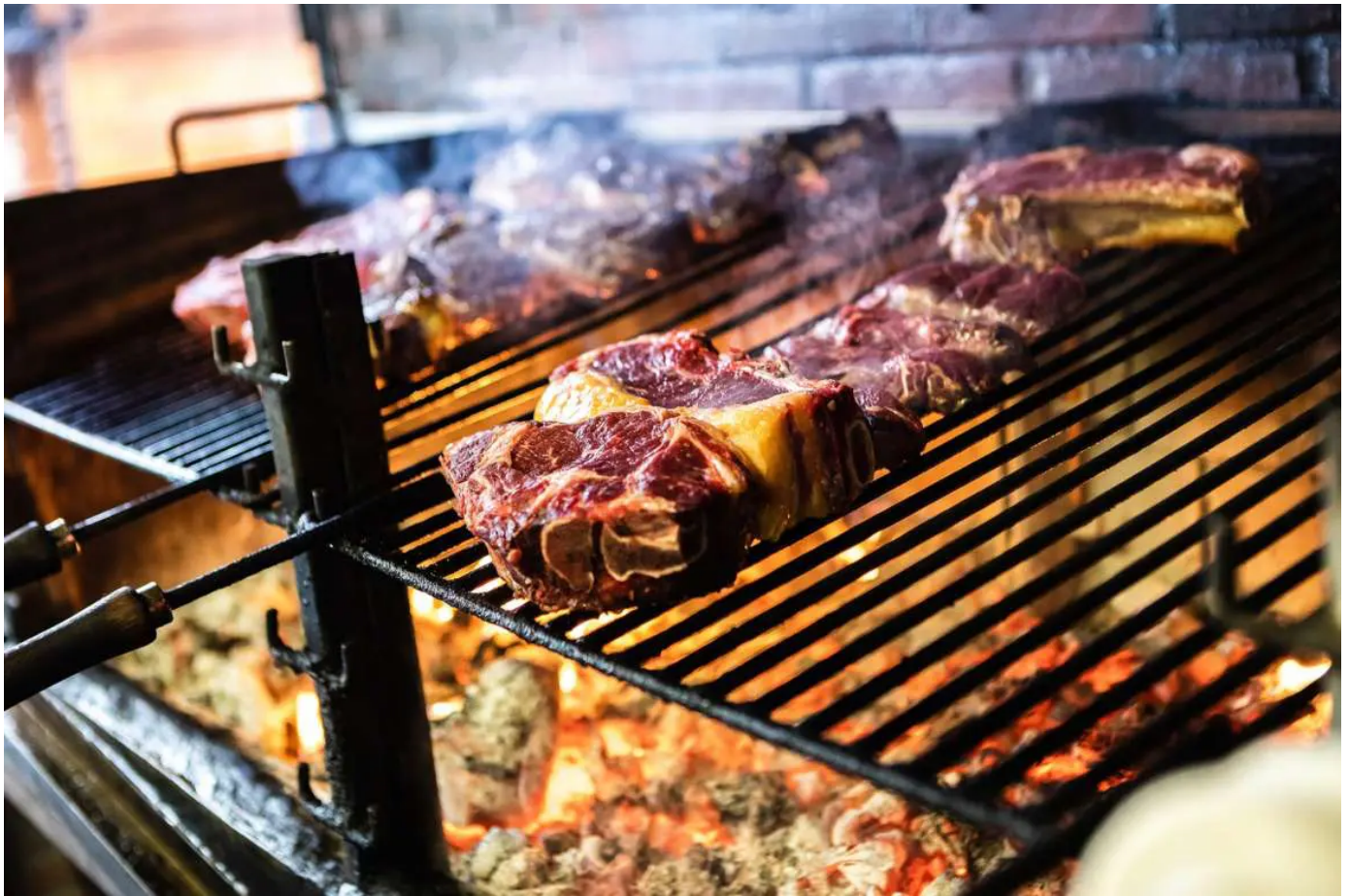
La parrilla de la Sidrería Iruin

En la Sidrería Iruin se elabora desde 1880 la conocida en todo el País Vasco Sidra Astiazaran con las manzanas que ellos mismos cultivan. Una sidra 100% natural, sin ningún tipo de añadido químico, cuya fermentación es cuidadosamente controlada para que el resultado sea óptimo. Es una elaboración de calidad muchas veces premiada y en la que confían grandes restaurantes y establecimientos gastronómicos de renombre (también a nivel internacional).