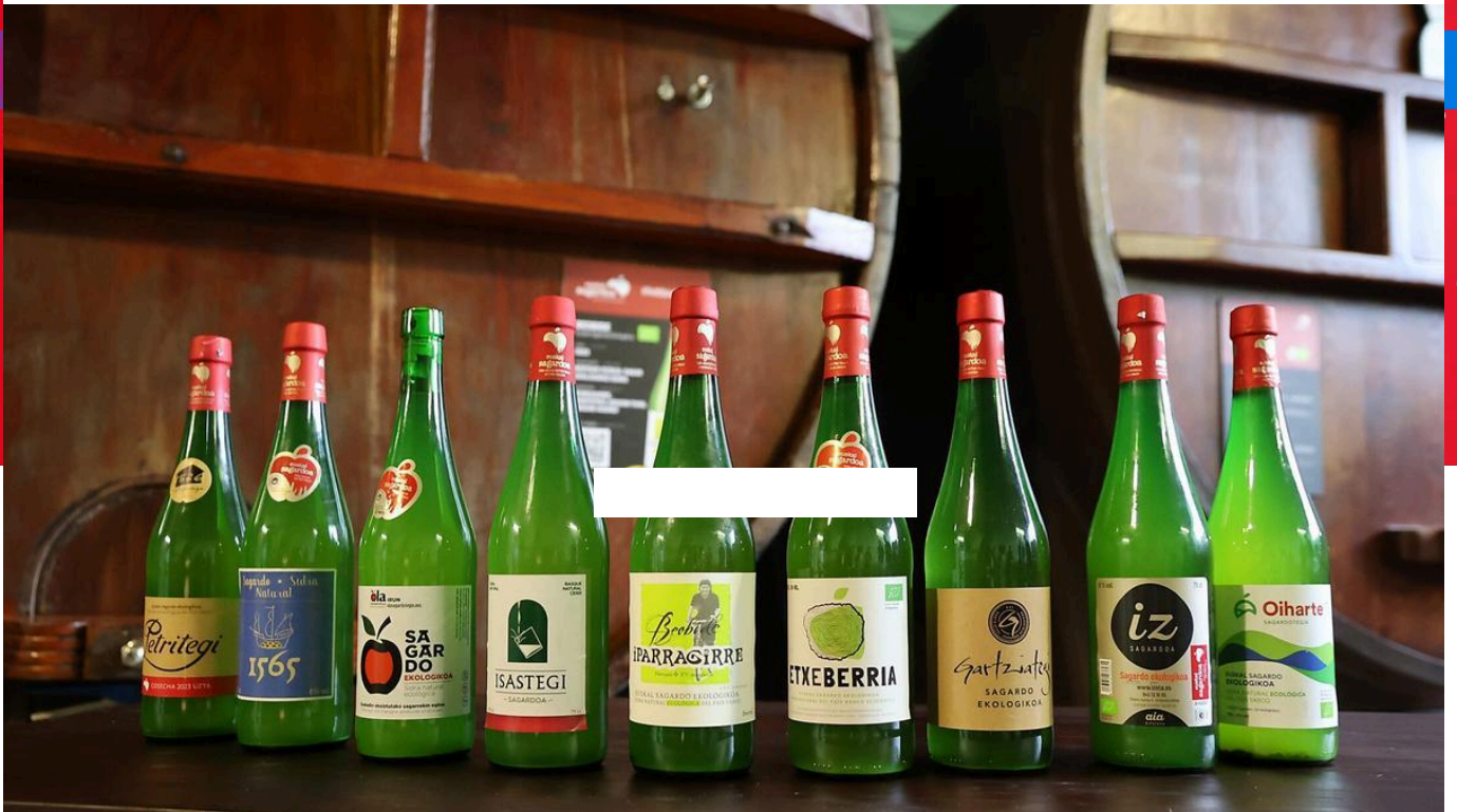
Presentación de la marca Euskal Sagardoa, donde se destaca la producción ecológica

Vivimos tiempos complejos. En un contexto global marcado por la incertidumbre económica, el cambio climático y la amenaza al equilibrio territorial, nuestras decisiones cotidianas adquieren una dimensión estratégica. En este escenario, mirar al producto local, al producto de aquí, no es un gesto romántico ni un ejercicio de nostalgia: es un acto de responsabilidad. Así se reivindicó en el foro Km 0 Kontsumo Arduratsua,