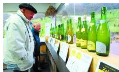
Una buena presentación. Exposición de etiquetas de sidra en Astigarraga.