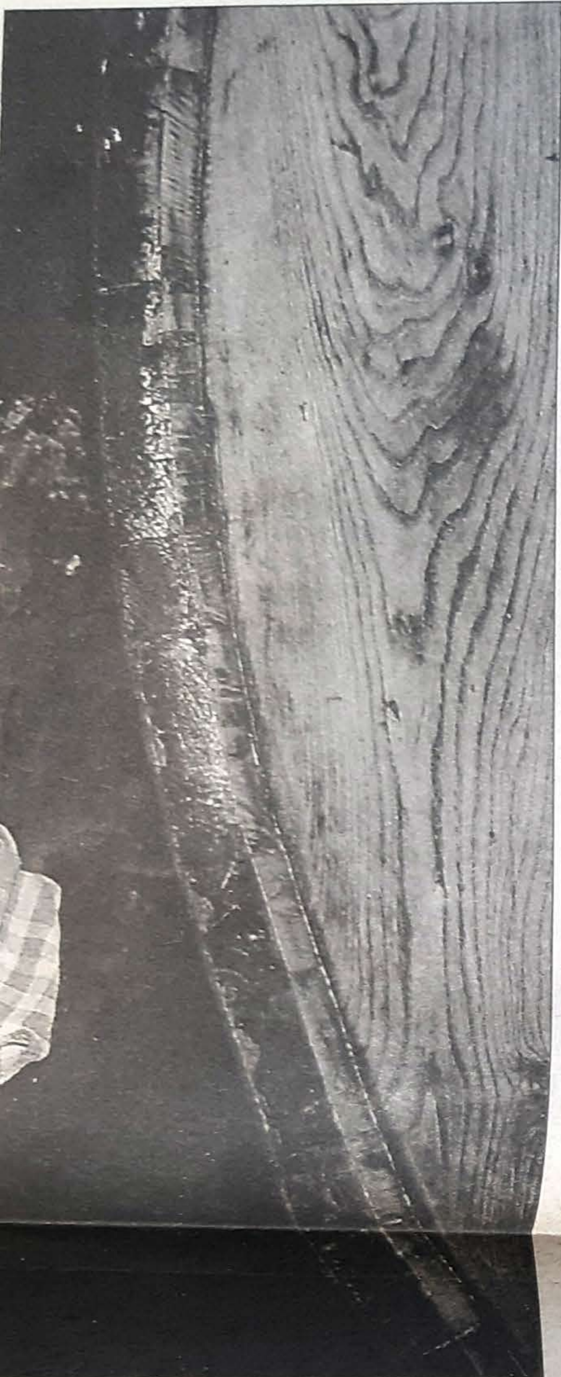
astrónomos y...«público en general»