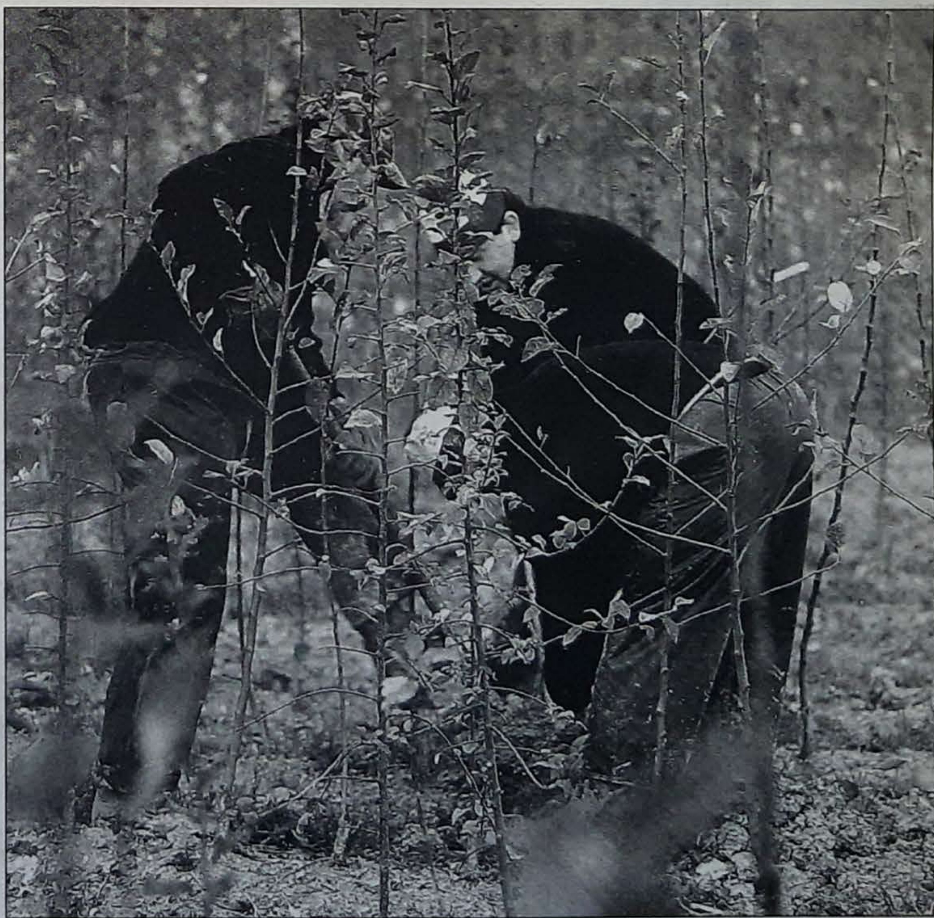
En la finca de experimentación de Hondarribia se miman los manzanos.

plantaciones por técnicos de la institución foral y si se han cumplido las normas, se devuelven las quinientas pesetas que se les ha cobrado por cada árbol.