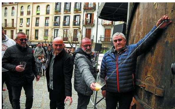
Gudarien plaza vivió una nueva apertura del txotx de la mano de los miembros de Zaporeak.