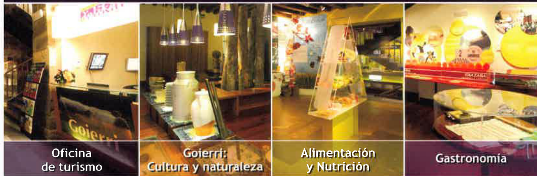
Oficina de turismo