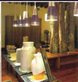
Goierri: Natura eta kultura