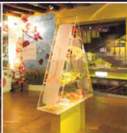
Elikadura eta nutrizioa