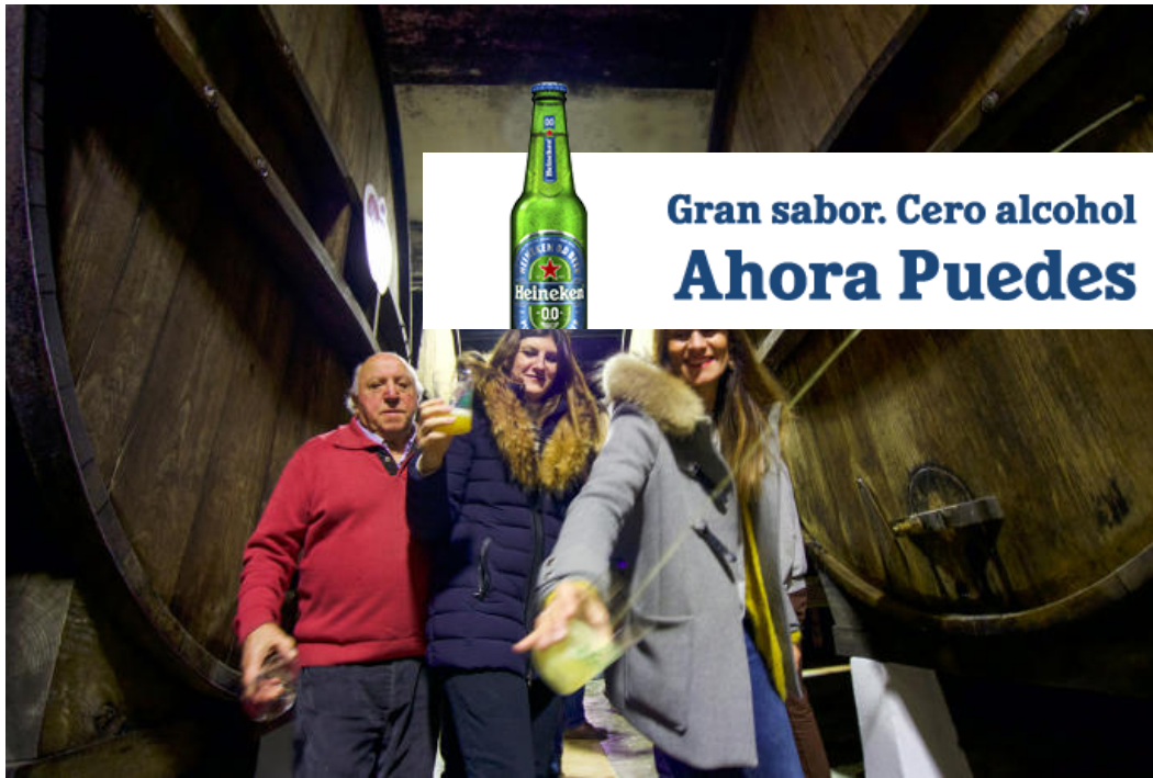
Zapiain Sagardotegia