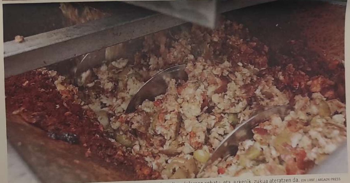
NOLA EGITEN DEN Ⓢ Dolarean sartu aurretik, sagarrak garbitu egiten dira; dolarean xehatu, eta, azkenik, zukua ateratzen da.