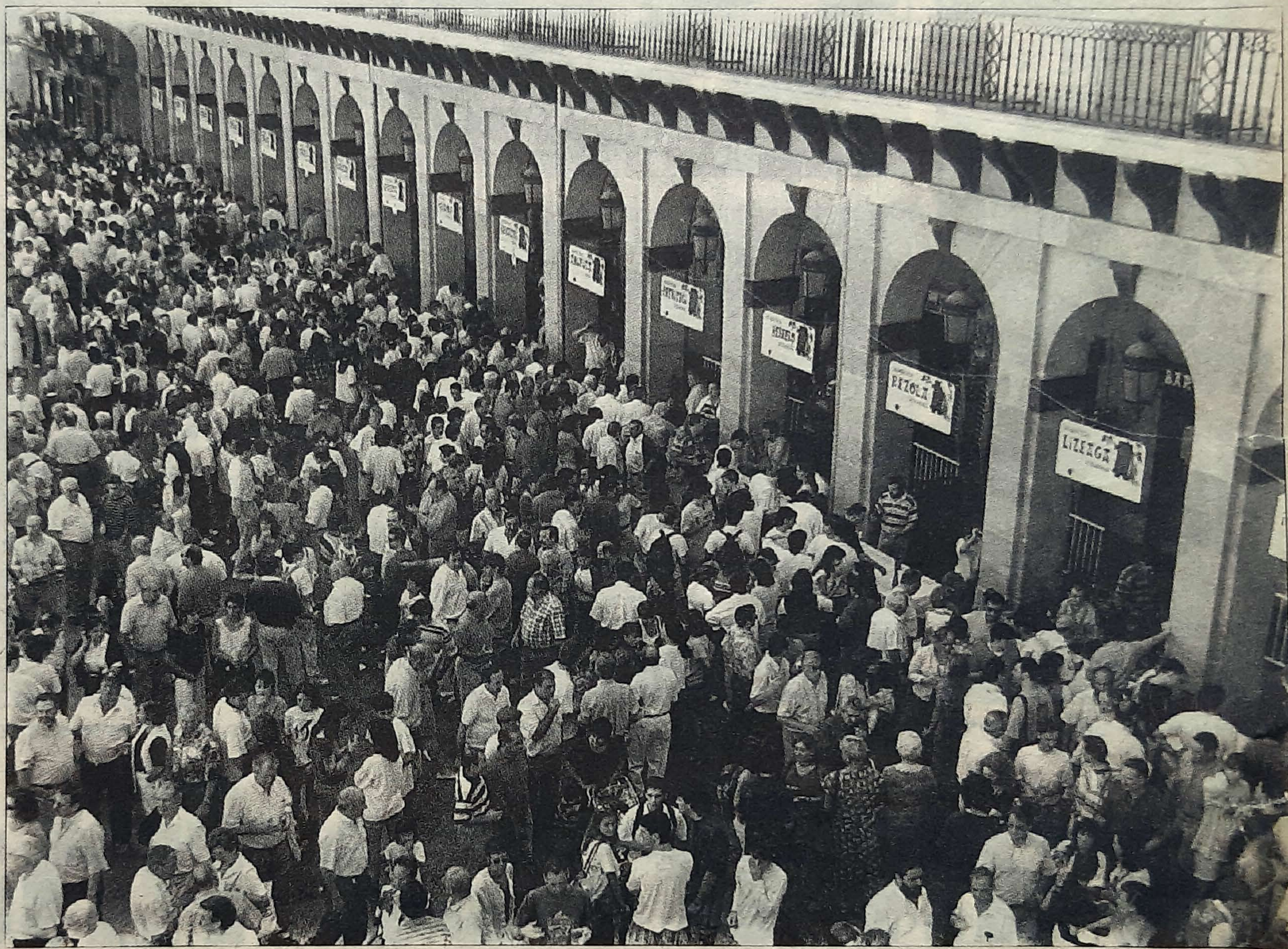
La plaza de la Constitución volverá a llenarse mañana de público en el XI Sagardo Eguna.

El presidente de los cosecheros, aseguró que «nuestra ilusión es que la gente conozca qué es la sidra, cómo se hace y cómo se comercializa». A tal fin, el Sagardo Eguna de este año presentará como principal novedad la exhibición de un vídeo realizado en Astigarraga en el que se detallan todos estos aspectos. Respecto al programa de la jornada, el presidente de los cosecheros guipuzcoanos destacó «el acto de homenaje a dos de nuestros sidreros ju-