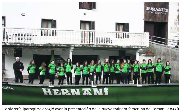
La sidrería Iparragirre acogió ayer la presentación de la nueva trainera femenina de Hernani.