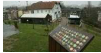
Parte del manzanal pedagógico de Astigarraga, y junto al edificio de la Casa de Cultura, el pequeño museo de la Sagardoetxea y la sala de catas.

SAN SEBASTIÁN. DV. ¿Es posible que haya dos museos de la sidra a una distancia de cinco kilómetros? ¿Es deseable? El pasado año se inauguraron varios elementos del Sagardoetxea de Astigarraga -el manzanal pedagógico, el centro de interpretación de la sidra y la sala provisional de catas- y ese mismo año se daba a conocer la líneas maestras de otro museo, el llamado SagardoGunea, que aspira a ser mucho más que un museo y que se proyecta construir en Hernani. En estos últimos tiempos, el Ayuntamiento y las sidrerías de Astigarraga están pisando fuerte para liderar el mundo sidrero. Pero Hernani no se quiere quedar atrás.