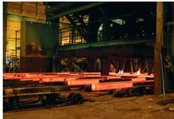
Gerdau aplica numerosas medidas medioambientales en su producción

En Europa, Gerdau cuenta con plantas productivas en el País