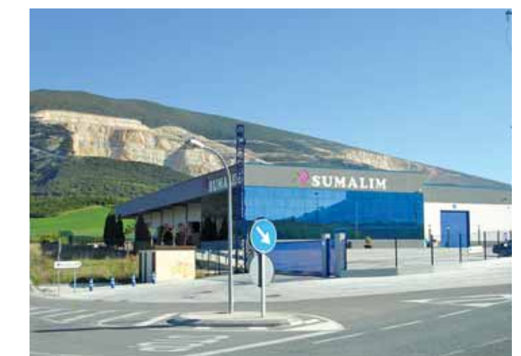
Exterior de las instalaciones de Sumalim, situadas en la Tiebas (Navarra)

La compañía cerró 2012 de manera satisfactoria además de con el re-