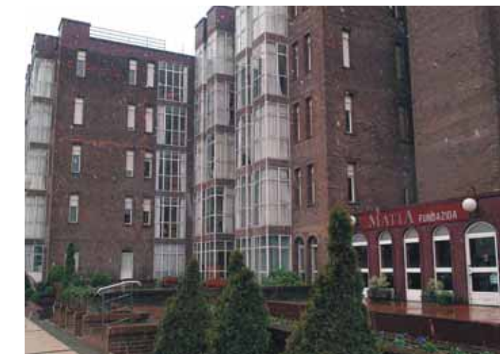
Matia Fundazioa es referente en la prestación de servicios sociosanitarios

Matia Fundazioa ha interiorizado esta nueva forma de abordar la atención a las personas mayores y, como institución de referencia en la prestación de servicios sociosanitarios a este colectivo, propone un modelo propio, integral y diferencial, centrado en la persona y basado en la personalización de los servicios a las personas usuarias y también a sus familiares. Así, Matia Fundazioa quiere acercar sus servicios a los domicilios y ha lanzado su propio servicio de