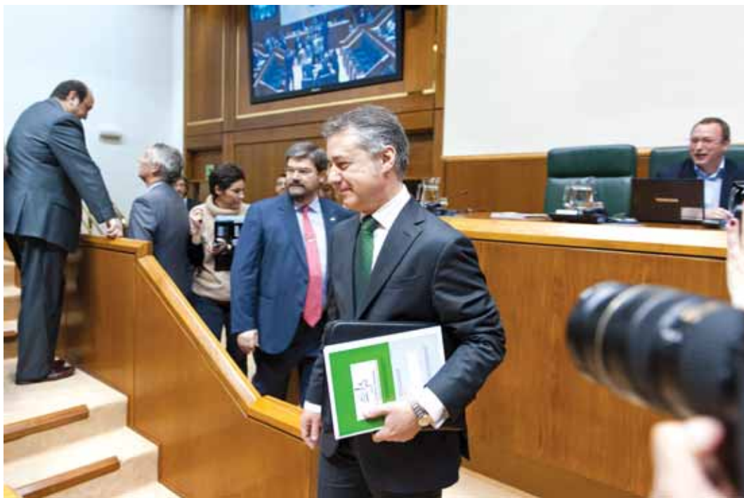
El lehendakari Iñigo Urkullu, en primer plano, en el Parlamento Vasco

En estos encuentros los presupuestos “serán una prioridad fun-