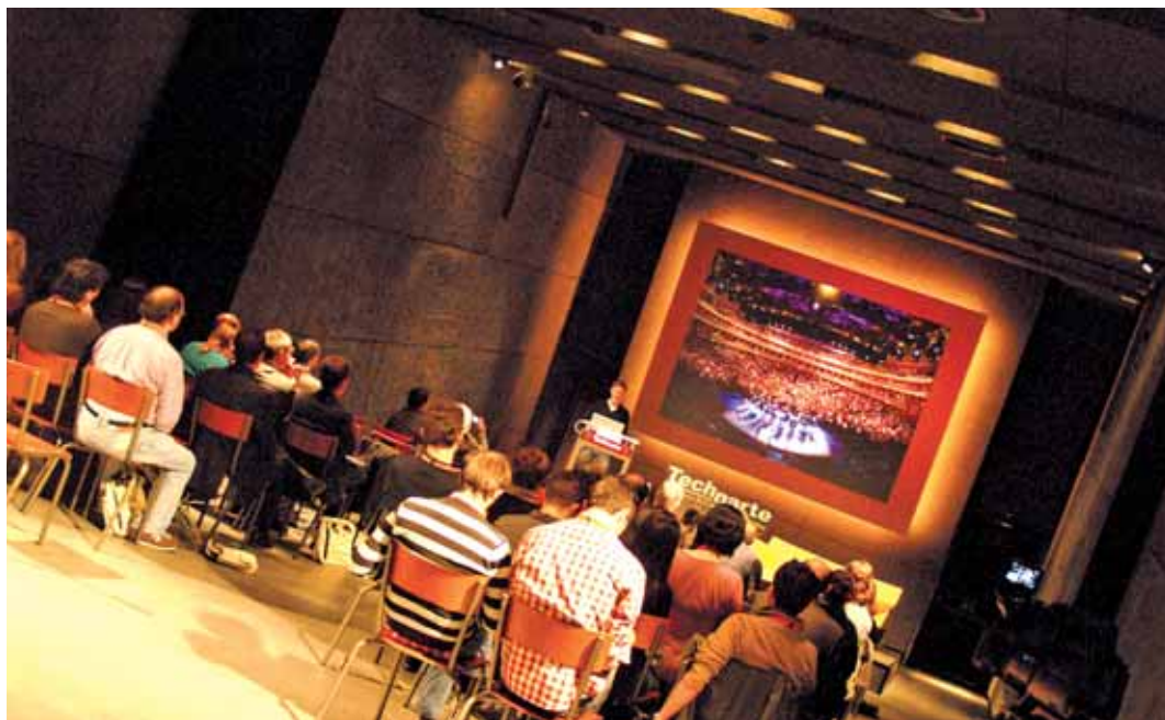
La última edición de Technarte reunió a un total de 15 artistas, tecnólogos e investigadores venidos de todo el mundo

A lo largo de estos diez años, el museo ha celebrado más de 40 exposiciones temporales, más de 65.000 niños han participado en sus actividades y ha desarrollado un completo programa de Charlas Náuticas en las que se han tratado temas relacionados con la arqueología marítima, navegación y tecnología; además de invitar y recibir en sus muelles barcos de tipologías muy variadas: guerra, salvamento, buques escuela... con el fin de que la sociedad los conozca y los pueda visitar.