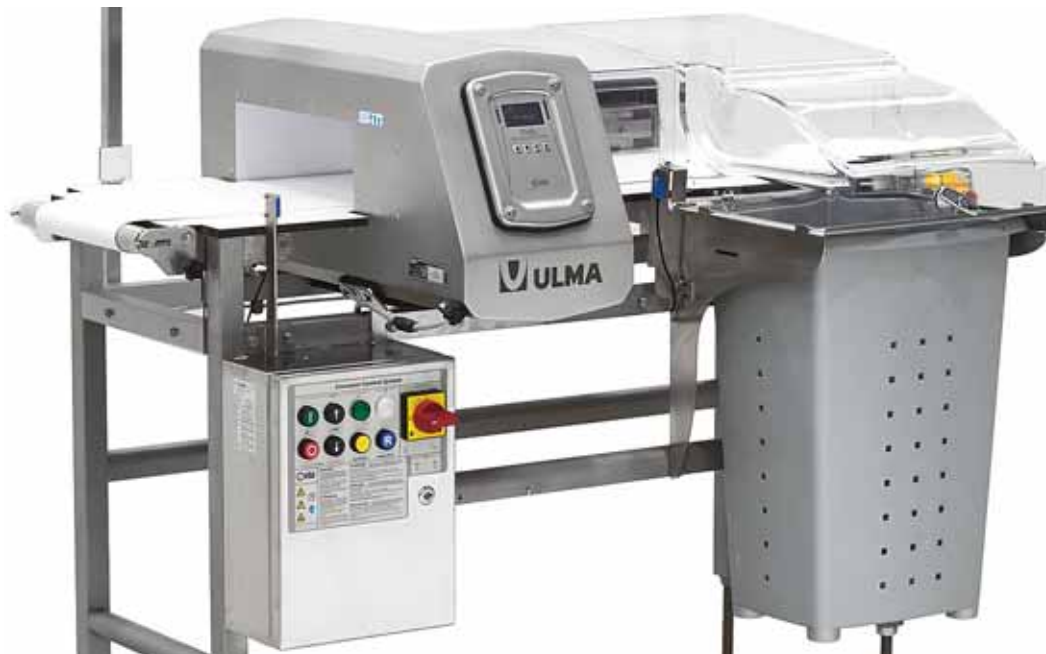
Ulma Precinox ha desarrollado detectores de metales que se integrarán en las máquinas de Ulma Packaging

Presente en el mercado desde 1993 Dinitel y su gama de productos Vivimat®, se han ganado la confianza del sector, habiendo mantenido relaciones comerciales con primeras empresas del sector. La veteranía y las excelentes relaciones que Dinitel mantiene con todos los actores del mercado, hacen que sea referente del sector.