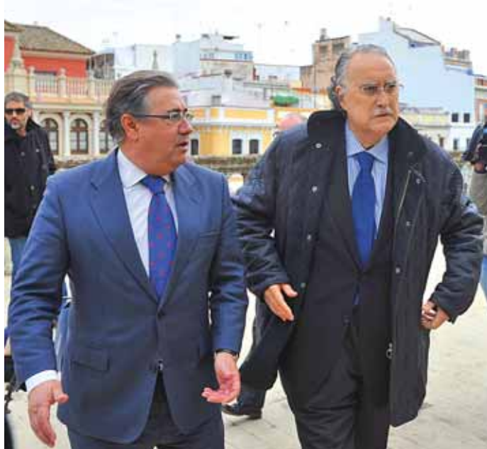
Iñaki Azkuna, alcalde de Bilbao, conoció la noticia durante su visita a Sevilla, donde se entrevistó con su homólogo, Juan Ignacio Zoido (izda.)

El saber aprovechar el tirón del Museo Guggenheim Bilbao y liderar la transformación de la Villa durante sus 13 años de gestión al frente del Ayuntamiento de Bilbao han sido determinantes para que Iñaki Azkuna haya sido reconocido como 'Alcalde del Mundo 2012' por la Fundación City Majors, entidad que también ha elogiado la gestión financiera y la transparencia del Consistorio de la capital vizcaína.