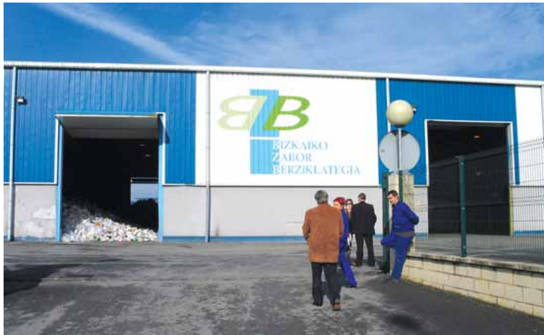
Los materiales recogidos en el contenedor amarillo se tratan en la planta BZB (Bizkaiko Zabor Berziklatetia)

Otras de las conclusiones más destacables que recoge el estudio son que el 85% de la ciudadanía conoce el tipo de reciclaje que requiere cada contenedor; un 80% afirma no tener queja en cuanto a la ubicación; un 84% asegura que recicla en el hogar; un 52% dice estar de acuerdo con que quien más basura genere y menos recicle pague más tasa de basuras; y que la satisfacción general de las personas con respecto al contenedor amarillo alcanza un 7,7 sobre 10.