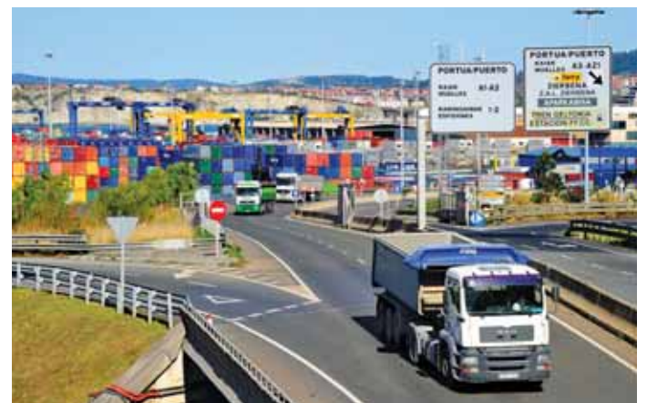
Hasta noviembre, el Puerto de Bilbao movió 26,14 millones de toneladas

Los datos del de Bilbao, con cerca de un 11% menos de tráfico entre enero y noviembre del año pasado contrasta con el crecimiento del 4,95% del conjunto de puertos españoles, aunque este incremento se