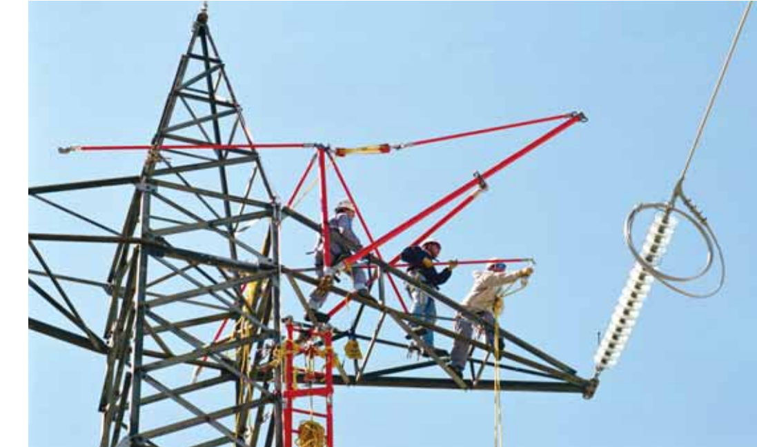
La línea Abanto-Güeñes posibilitará la conexión del 'eje norte' de líneas eléctricas estratégicas

El programa en el que se detallan las infraestructuras aprobadas distribuidas por comunidades autónomas, publicado en el Boletín Oficial del Estado (BOE) del pasado día 11 de enero, representa el 15% de las inversiones pendientes previstas en la última planificación. El BOE detalla que una de las líneas es la que conectará las subestaciones de origen de Abanto con la de Güeñes. Esta línea se unirá con la Güeñes-Penagos (Cantabria) que