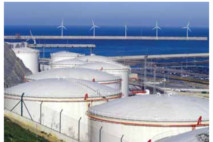
CLH invertirá unos cuatro millones en la nueva construcción

El Grupo CLH ha desarrollado en los últimos seis meses el plan de inversiones más ambicioso de su historia, de más de 750 millones de euros, que ha permitido incorporar 1,2 millones de metros cúbicos de nueva capacidad de almacenamiento y construir más de 500 kilómetros de oleoductos.