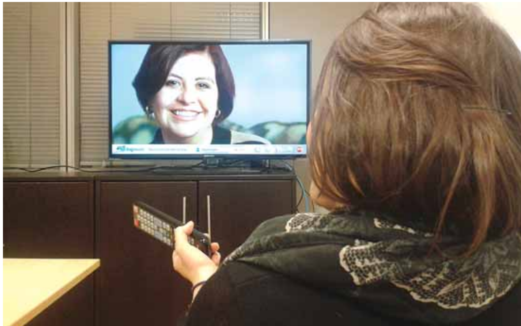
En la imagen, dos personas realizando una comunicación a través del sistema de telepresencia de Enigmedia

En cuanto a sus potenciales clientes, esta tecnología es útil tanto para compañías multinacionales o firmas en fase de internacionalización como para el sector financiero, ONG, medios de comunicación etc. Esto es, cualquier empresa u organización con información sensible para sus intereses o para los de terceras personas.