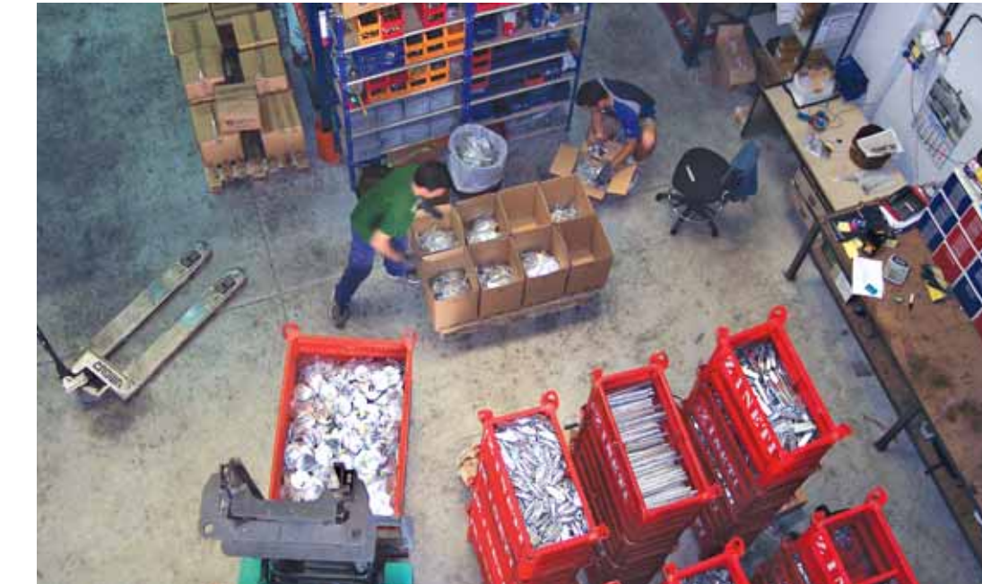
Zona de almacén de Zineti en el polígono industrial Larrondo, en Loiu (Bizkaia)

El primer objetivo de esta empresa vasca es tratar de diversificar los sectores a los que suministra e introducirse principalmente en mercados como los de las