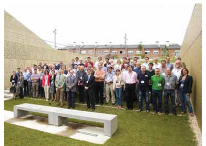
El pasado año se recibieron más de 1.500 solicitudes para cubrir 65 plazas de investigación en universidades y centros tecnológicos vascos

Por áreas de conocimiento, un 73% están especializados en ciencias experimentales, frente a un 12% en medicina y ciencias de la