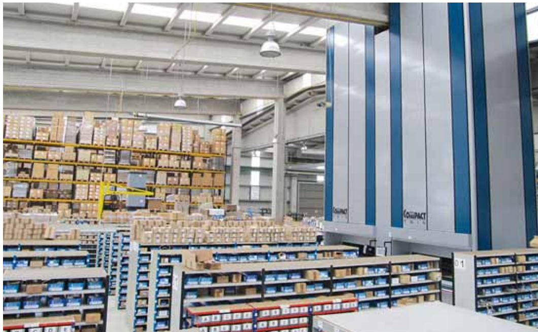
La compañía Izar Cutting Tools vende sus productos en 80 mercados en todo el mundo

El Ebitda (resultado bruto de explotación) de la empresa superó, de nuevo, el 12%, "lo que permite continuar con la política de fuertes inversiones en maquinaria e instalaciones", que superan el millón anual, "sin olvidar su principal objetivo social, que no es otro que la consolidación y la creación de empleo". "No hay que olvidar, que cada empleo en la industria, genera además cinco empleos indirectos a su alrededor", puntualizó Izar.