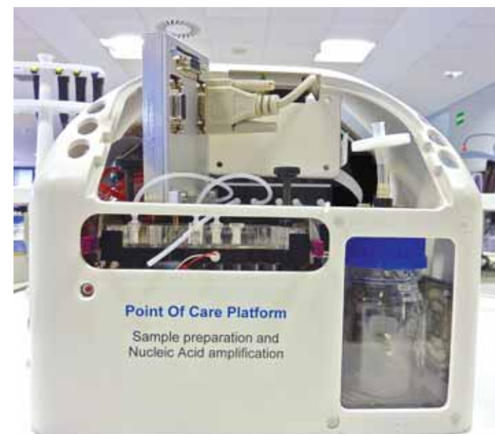
El proyecto Predetec desarrolla herramientas de diagnóstico rápido para descubrir los posibles patógenos presentes en los alimentos

Por otro lado, y de manera complementaria, se está avanzando en la utilización de la resonancia de plasmones localizados superficiales, una técnica óptica basada en el estudio de la transmisión de la