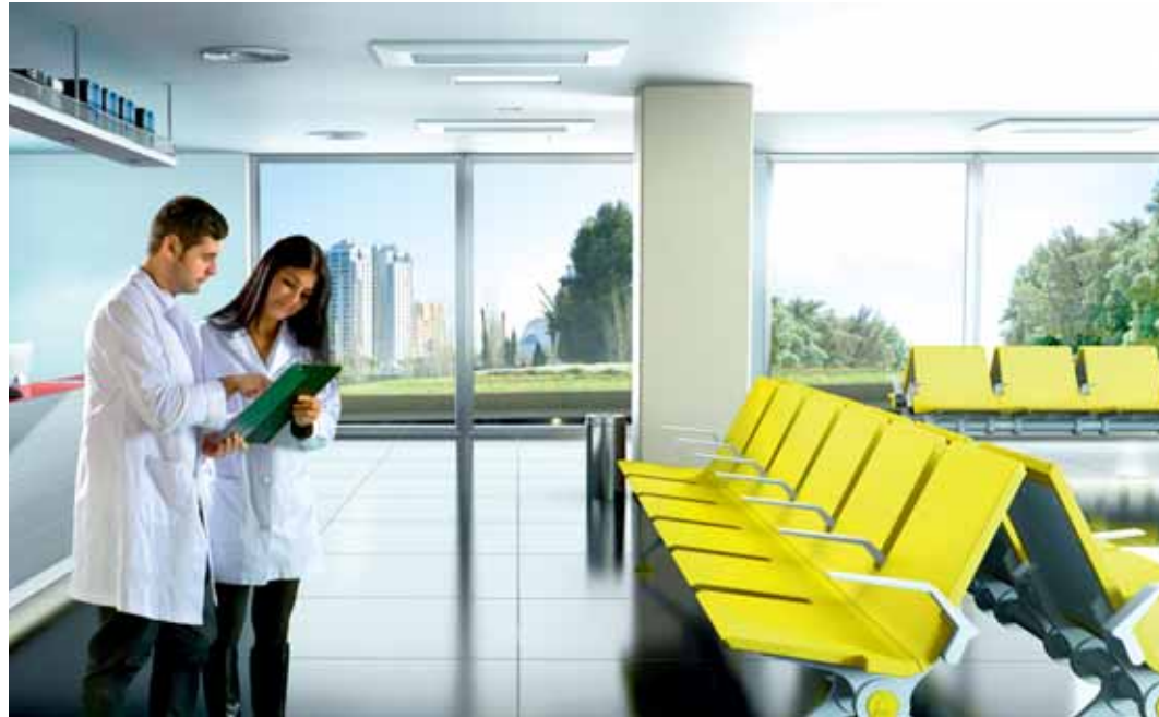
El modelo Wave de Imat ya se encuentra en zonas de espera de aeropuertos, hospitales y estaciones

Para este año y 2014 la empresa alavesa seguirá avanzando en dos nuevos productos de los que ya tienen el diseño muy adelantado y que se dirigirá a seguir tra-