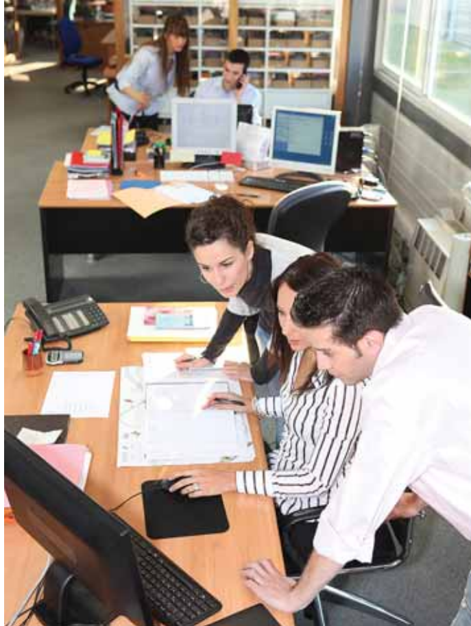
El área comercial y de venta fue el que lideró el ranking de contrataciones el pasado año, posición que podría revalidar este año también

Con respecto a la evolución de la contratación en 2013, Adecco prevé que sea similar a la de 2012, si bien