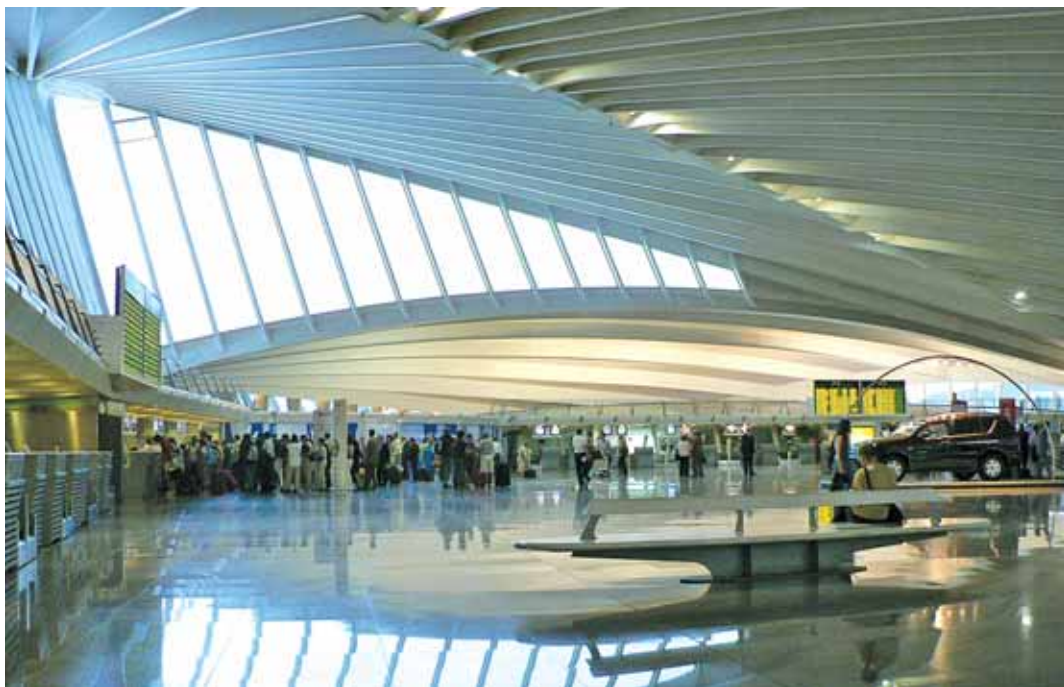
Las conexiones internacionales volvieron a ser el año pasado las que tiraron con más fuerza del tráfico de pasajeros, ya que los viajeros que se desplazaron fuera del Estado se incrementó en un 14,5%

Aeropuertos Fue el aeropuerto de Aena con mayor aumento en 2012