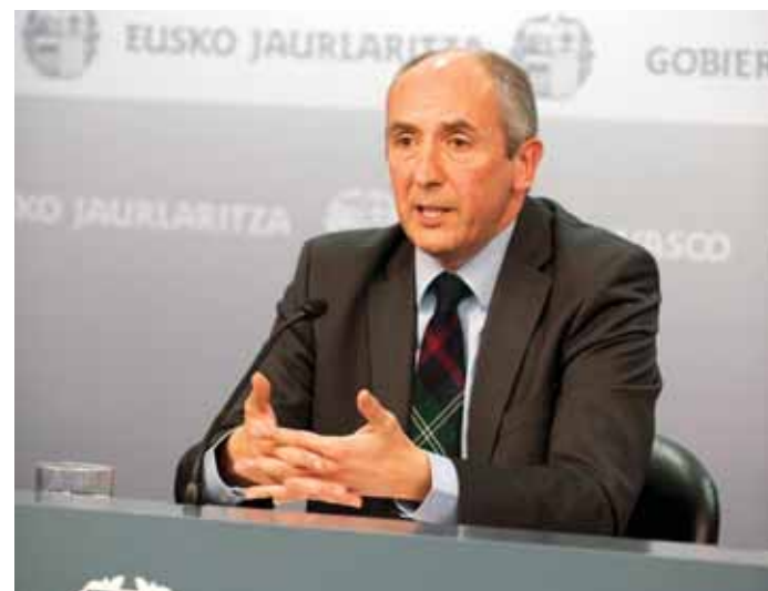
Josu Erkoreka, portavoz del Gobierno, explicó los planes de reducción

Como ejemplo de optimización de recursos sin despedir a empleados, Erkoreka se refirió a la posibilidad de unir varias estructuras societarias públicas dispersas que se pueden simplificar en una