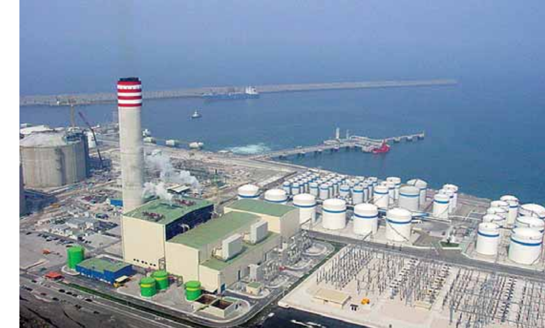
Planta de Bahía de Bizkaia Electricidad, en el Puerto de Bilbao, participada por Iberdrola

De otro lado, Iberdrola ha alcanzado un acuerdo con el consorcio formado por EDF Energies Nouvelles (20%), MEAG, filial de asset management de Munich RE y ERGO (40%), y GE Energy Financial Services (40%) para la venta de 32 parques eólicos terrestres en Francia con una capacidad instalada de 321,4 MW. El importe de la operación, cuya materialización está