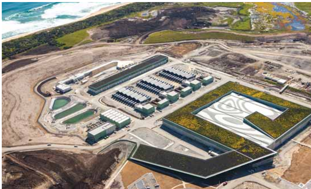
Vista de la planta desalinizadora que Degrémont ha puesto en marcha para abastecer de agua potable a Melbourne

La planta desalinizadora, que se ubica en Wonthaggi, cerca de Melbourne, se terminó de construir en junio de 2012. En septiembre ya empezó a producir agua tras la puesta en servicio de la primera línea de tratamiento de 150.000 m 3 /día, y en diciembre se obtuvo la recepción de la planta con la puesta en servicio de la segunda y