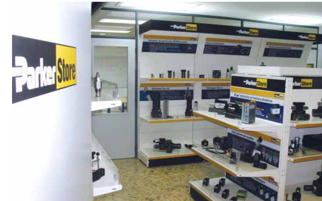
Ha dado un paso adelante aumentando el stock para poder tener una mayor capacidad de respuesta

En el segundo proyecto, perteneciente al programa Etorgai y que se encuentra en su fase de finalización, HRE Hidraulic está apoyando un desarrollo de proceso de mecanizado. En este caso, el líder del mismo es un fabrican-