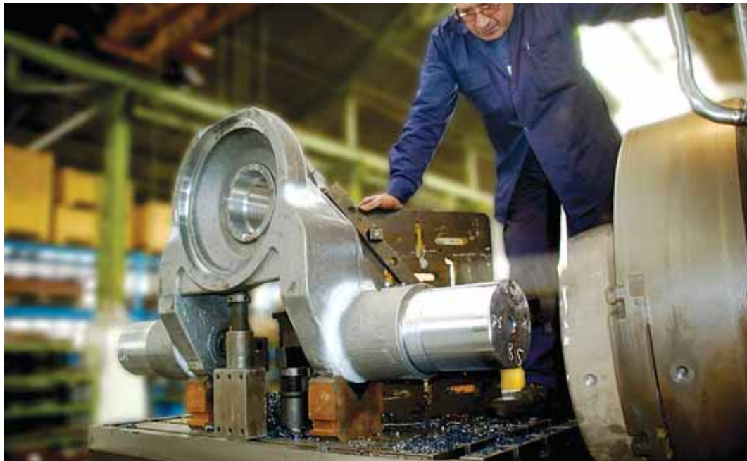
La producción de bienes de equipo registró en noviembre de 2012 una caída interanual del 17,4%

Por otro lado, la afiliación media a la Seguridad Social en Euskadi durante el mes de diciembre fue de 887.660 personas, 4.169 menos que en el mes anterior.