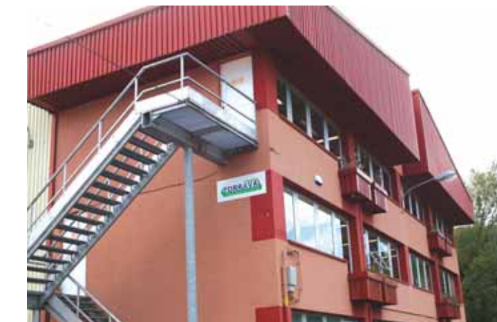
Torralval se encuentra en el polígono industrial Torrelarragoiti, de Bizkaia

Torralval lleva instaladas, desde 1967, más de 12.000 torres de refrigeración en todo el mundo, gracias a su 'know how', la calidad y fiabilidad de sus productos, así como el nivel y profesionalidad de su servicio de mantenimiento. Suministra