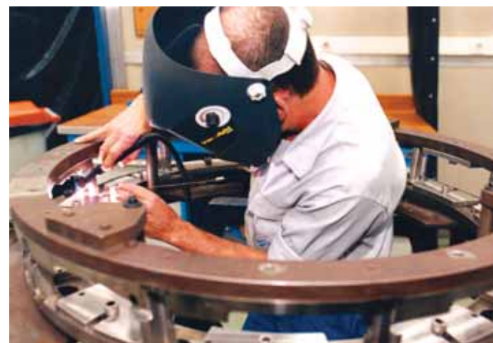
Los certificados afectan a ITP Ingeniería y Fabricación (ITP I&F), Industria de Tuberías Aeronáuticas México (ITAM) y Turborreactores (ITR)

ITR ubicada en Querétaro (México) se dedica a la reparación de los motores y pruebas de los mismos, JT8, TP331 y, a corto plazo, CFM-56 mediante la 'joint venture' al-