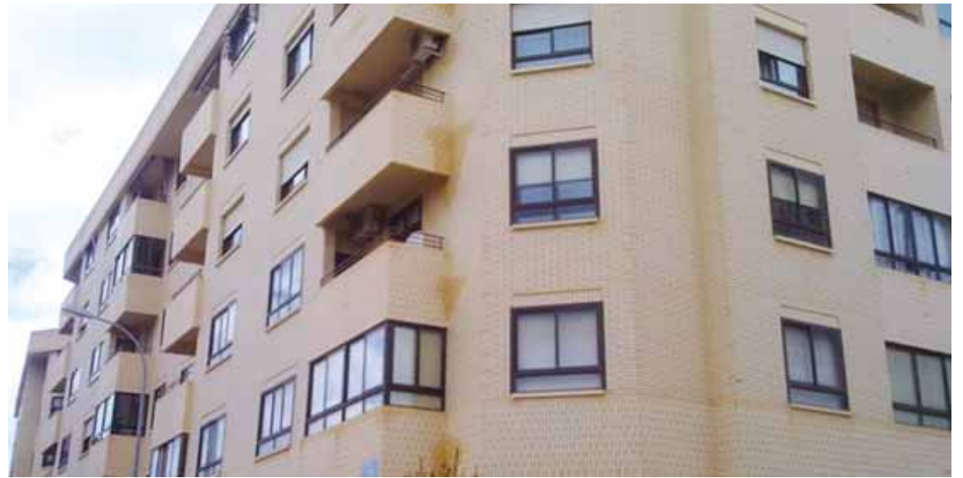
Uno de los objetivos de la nueva empresa es ir más allá de la mera reforma o rehabilitación de inmuebles