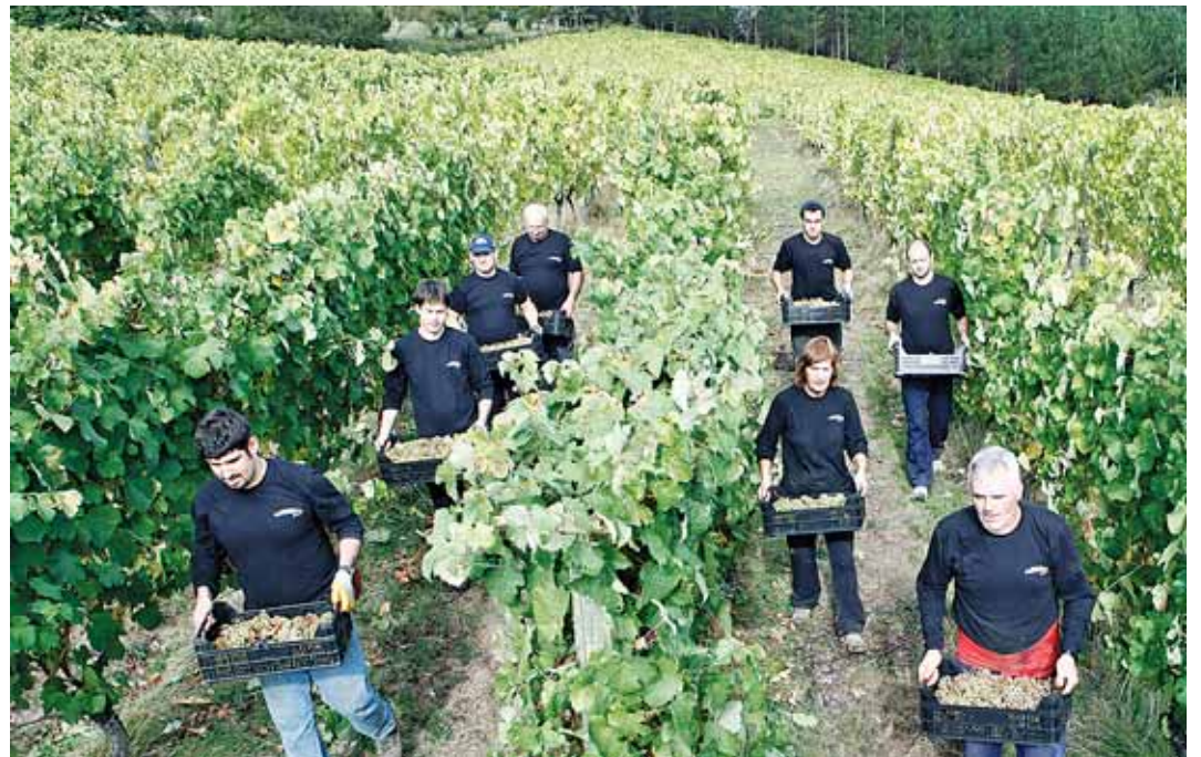
Astobiza realiza manualmente el proceso de recolección de la uva, separando así las impurezas existentes

Por su parte, la Sagardoetxea, Museo de la Sidra Vasca, hizo un balance del ejercicio 2012 en el que mantuvo la afluencia de visitantes, acogiendo a más de 10.000 personas en sus instalaciones, una cifra que valoró de forma muy positiva.