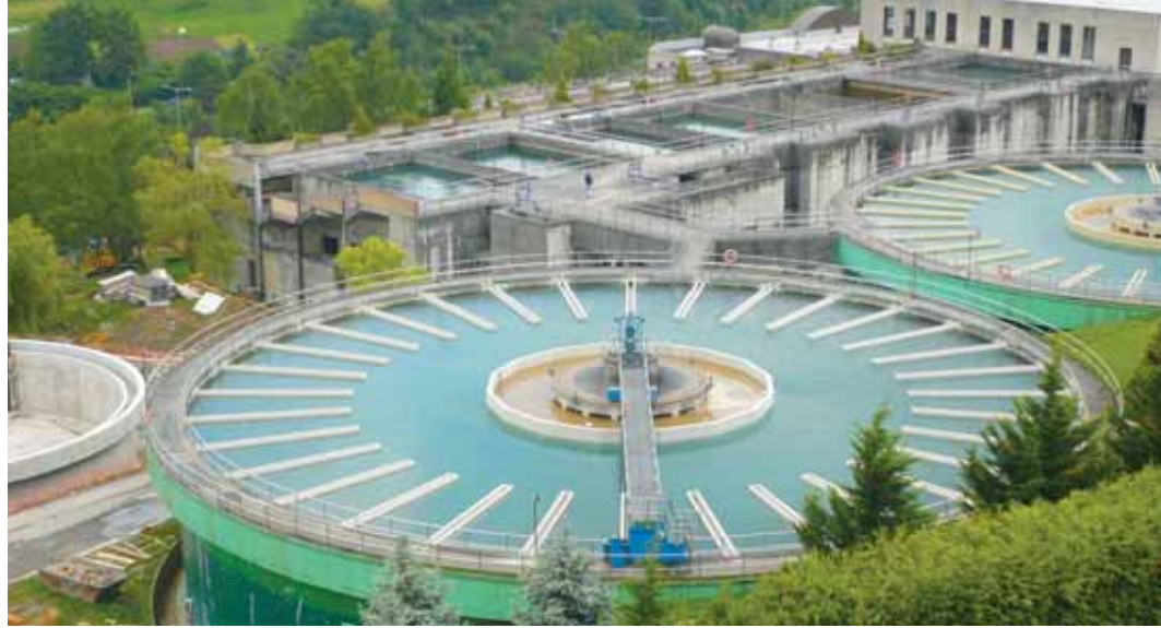
Vista parcial de las instalaciones que el Consorcio de Aguas Bilbao Bizkaia tiene en Venta Alta

Concretamente, este año se contemplan obras en los colectores de Karrantza (cinco millones), Trutzios (3,7 millones), Berriatua-Ondarroa y Sopuerta-Galdames (tres millones cada uno), así como en las EDAR de Karrantza (tres millones), Sopuerta (1,8 millones) y Trutzios (1,5 millones). También está previsto destinar cuatro millones de euros al saneamiento del Medio Bu-