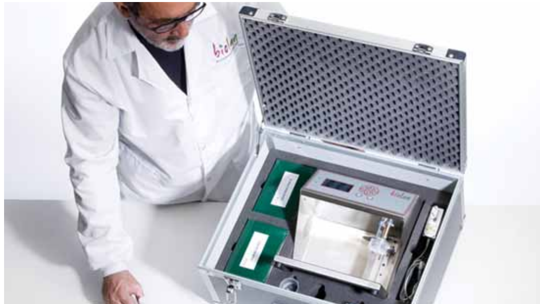
Biolan ha vendido 120 equipos de diagnóstico en más de 10 países de todo el mundo

Pero el principal hito de 2012 ha sido la diversificación hacia el sector de la agroalimentación, orientado a la seguridad alimentaria. El vino ha aportado a Biolan conocimientos amplios sobre biosensórica, porque su matriz es muy compleja, y ha visto que la histamina, por ejemplo, tiene aplicación en otros sectores, como el pescado.