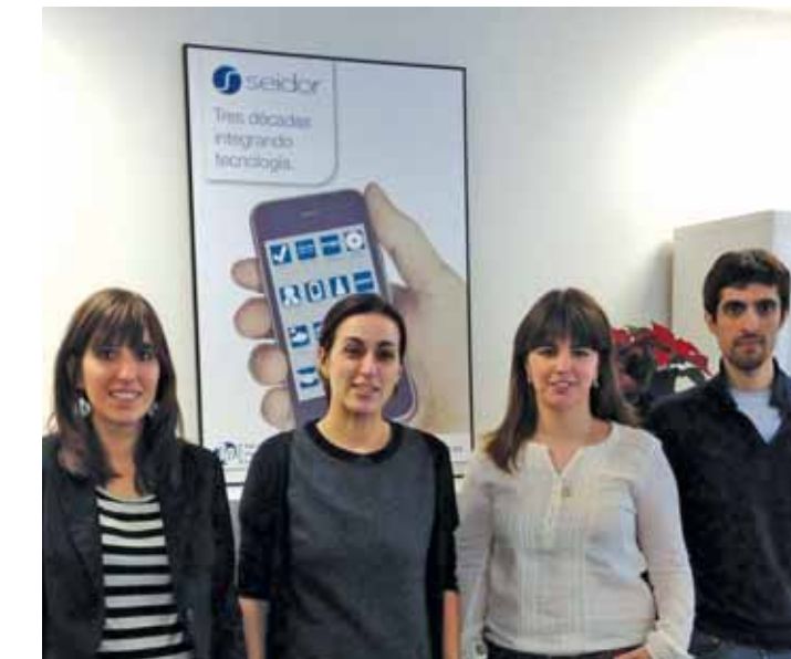
Equipo de Addonia al completo en sus instalaciones de Zuzatu

Para aprovechar todo el know-how creado, la compañía guipuz-