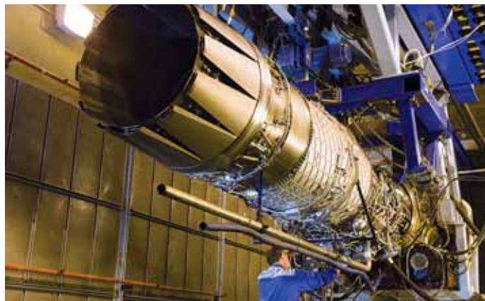
Empresas vascas como Iberdrola, Gamesa, CAF, Fagor o ITP (en la imagen) incrementaron en un 37% su inversión en I+D en el año 2011

Aunque sólo una fracción de esta inversión en I+D de las multinacionales se haya canalizado en Euskadi, estas cifras dan una idea del enorme potencial de negocio abierto a la contribución de nuestros propios agentes de ciencia, tecnología e innovación lo que, según Innobas-