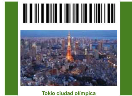
Tokio ciudad olímpica

Otro de los objetivos busca aumentar la notoriedad de la marca turística de Euskadi en mercados prioritarios; incrementar el número de viajeros en Euskadi y aumentar su gasto medio; lograr que Euskadi disponga de un modelo de gestión turística sostenible; disponer de información que permita la monitorización, gestión y seguimiento del destino y de la industria turística de Euskadi; conseguir altos niveles de calidad (percibida) por parte de viajeros y disponer de una oferta que satisfaga los deseos de viajeros en Euskadi