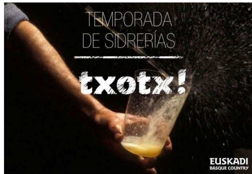
Txotx, el primer escanciado de sidra el año. Da inicio a la temporada de la sidra en Gipuzkoa.

La temporada de sidrerías o “ sagardotegis ” en territorio guipuzcoano suele iniciarse a mediados del mes de enero y comienza con un ¡ Txotx! , el grito con el que el sidrero invita a pobrar la sidra de cada “kupela” o tonel.