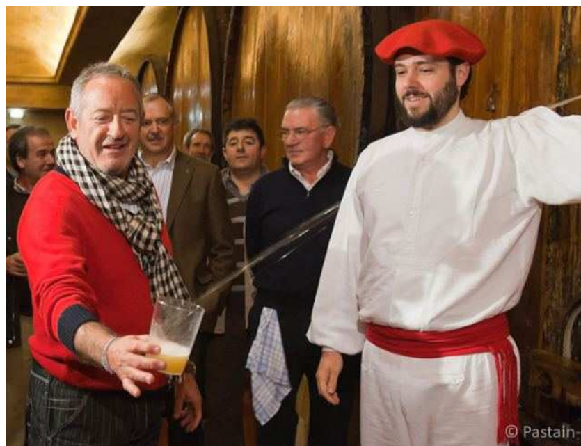
El cocinero Karlos Argiñano da inicio a la temporada de sidra de 2011 en la sidrería Petritegi de Astigarraga.

El rito de la sidra se resuelve, como no, en torno a una buena comida que suele incluir tortilla de bacalao, bacalao frito con pimientos verdes, chuleta a la brasa, y de postre, queso con membrillo y nueces. La oferta se divide entre sagardotegis en las que es posible comer sentados o las más tradicionales en las que se come de pie y de un mismo plato. Así que hay para elegir entre lo más tradicional y lo más cómodo.