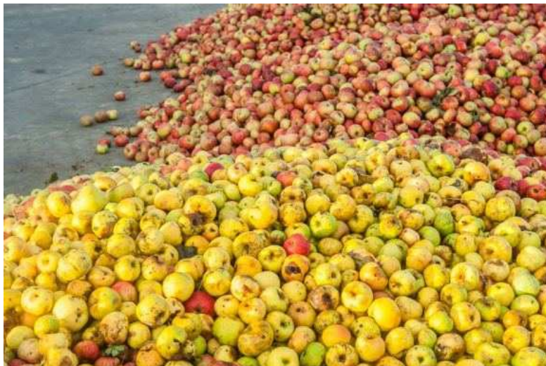
La sidra guipuzcoana se elabora con diferentes tipos de manzanas ácidas y amargas

Dicen los expertos que la sidra hay que que beberla de trago, en el momento, y en cantidades muy pequeñas. Es momento de charlas con los amigos en la bodega mientras llega el siguiente plato, o de seguir probando el contenido de las kupelas abiertas.