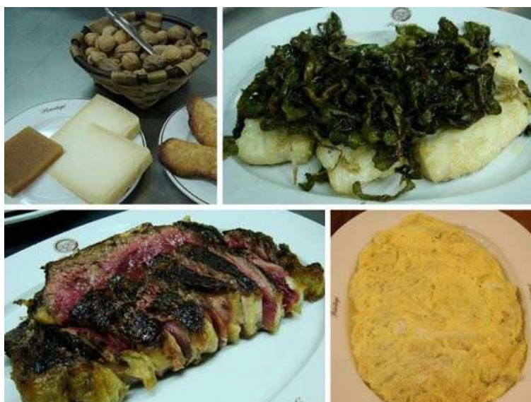
Menú de sagardotegia.

El rito de la sidra se resuelve, como no, en torno a una buena comida que suele incluir tortilla de bacalao, bacalao frito con pimientos verdes, chuleta a la brasa, y de postre, queso con membrillo y nueces. La oferta se divide entre sagardotegis en las que es posible comer sentados o las más tradicionales en las que se come de pie y de un mismo plato. Así que hay para elegir entre lo más tradicional y lo más cómodo.