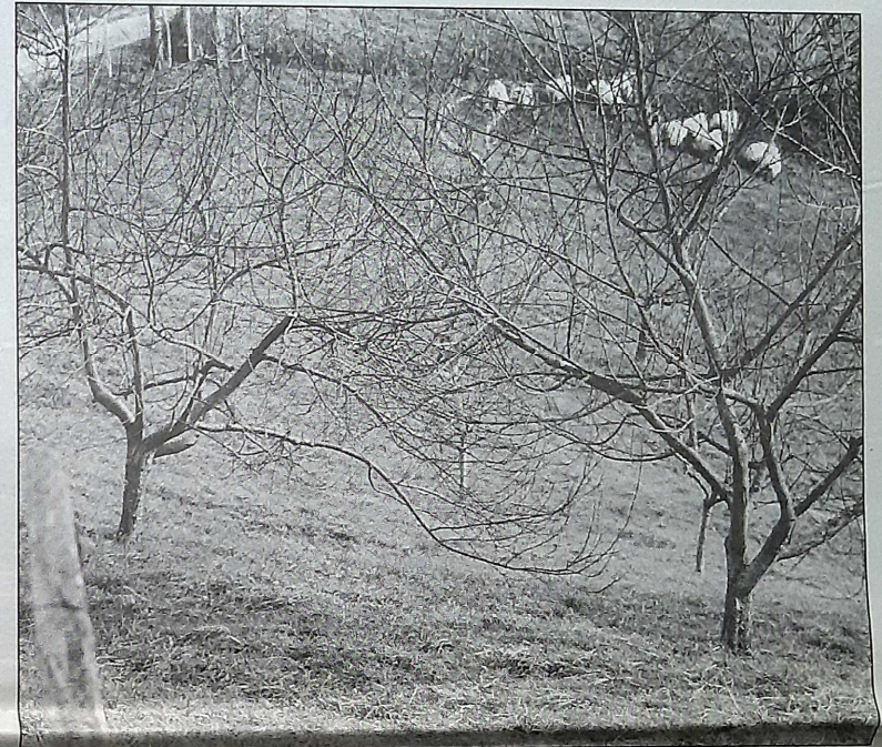
Iazko sagarraren erdia baino ez da bildu aurten Euskal Herriko sagasietan.