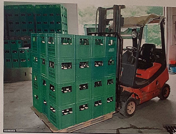
••• Sagardo asko botillatu egiten da ondoren denda, taberna eta jatetxeetan saltzeko.

Txotxerako erabiltzen ez den sagardoa botillatu egiten da. Prozesu horretan, garbitasuna ezinbestekoa da. Botilak behar bezala garbituta daudela ziur-