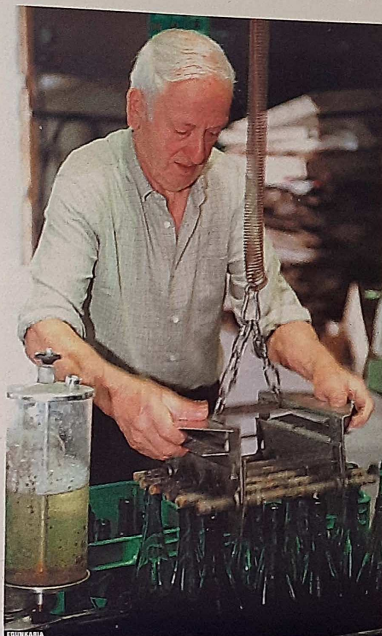
••• Sagardo botilak ondo garbitu ostean, zintan jartzen dira.

Upelek temperatura ona izatea garrantzitsua da, edaria