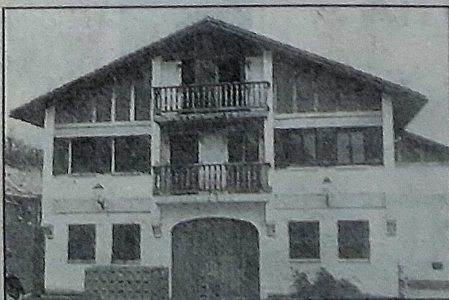
OSIÑAGA AUZOA - Tel.: 55 68 94 HERNANI