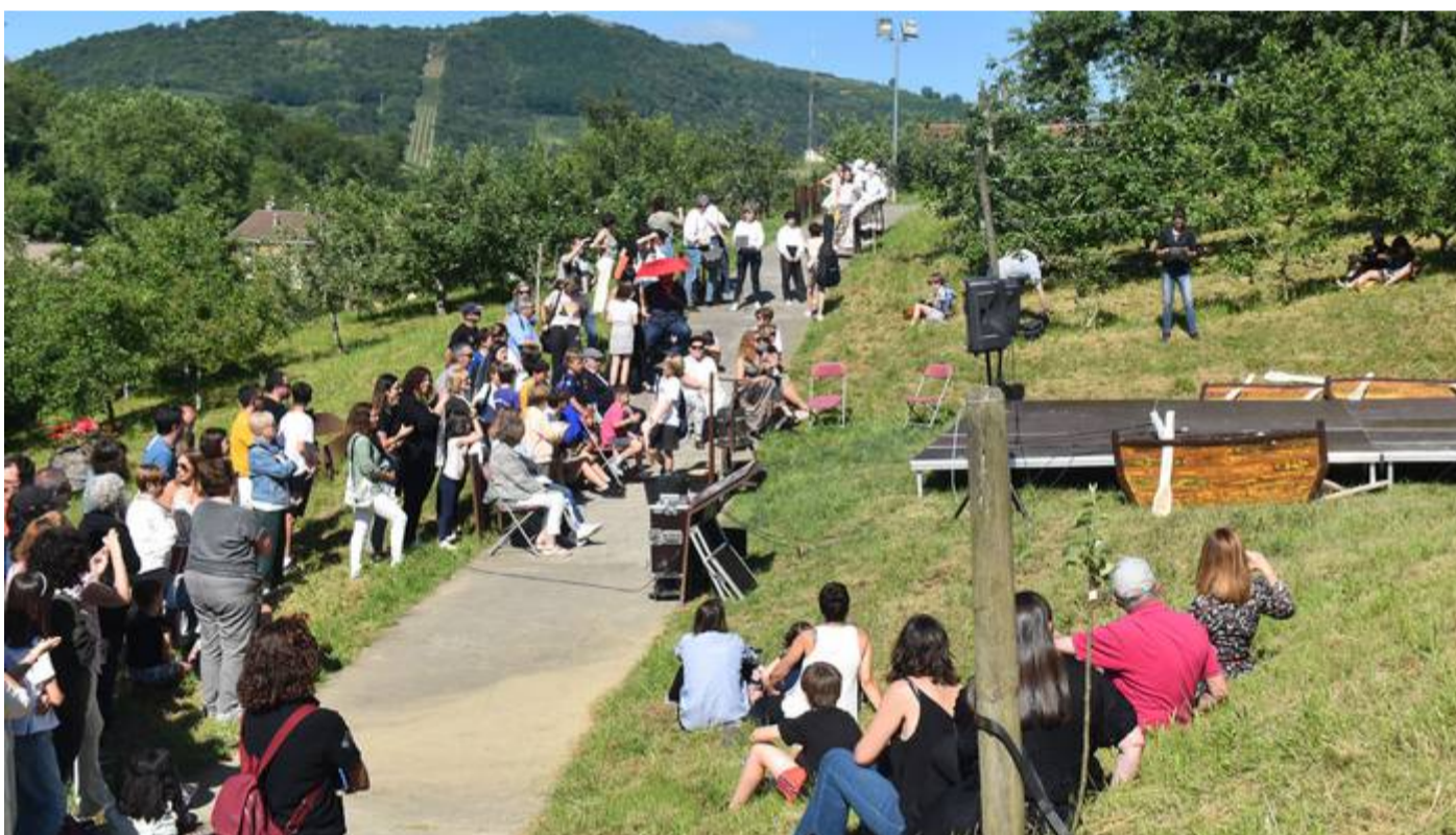
Herritar ugari bertaratu ziren Sagardoetxera.