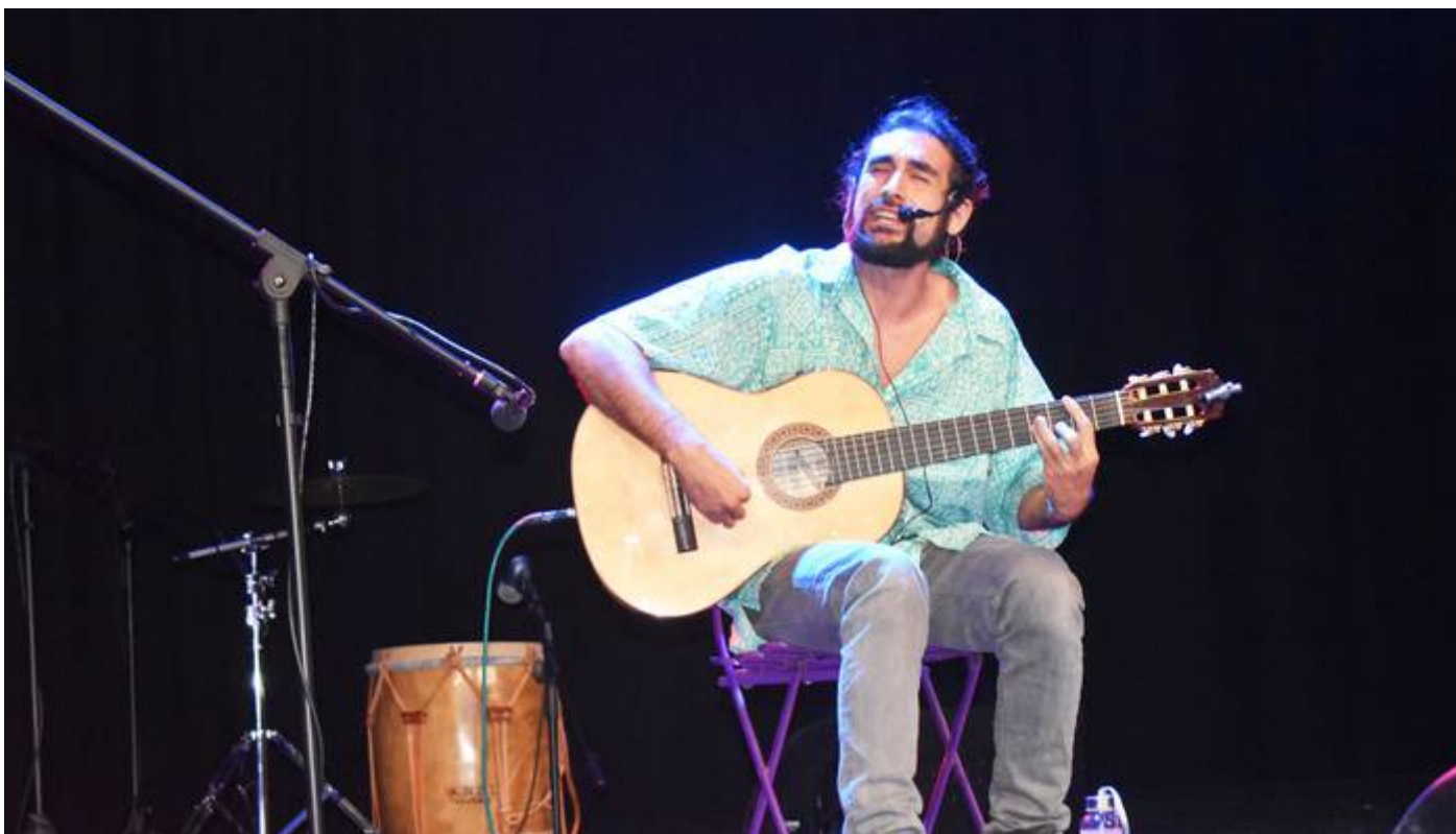
'Paradoxus Luporum' taldeak Erribera bisitatu zuen, larunbatean.