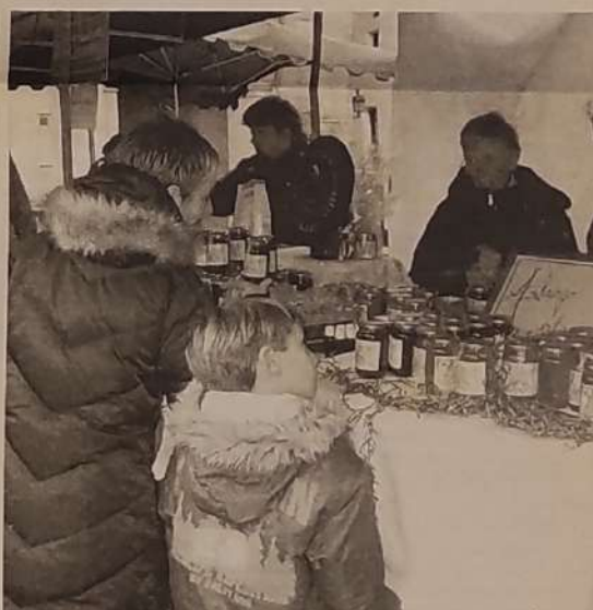
Erletik eratorritako produktuak egon ziren postuetan. (JOSU ARANBERRI)