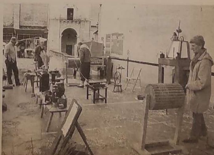
Frontoian argizaiola nola egiten den ikusteko aukera izan zen. (JOSU ARANBERRI)