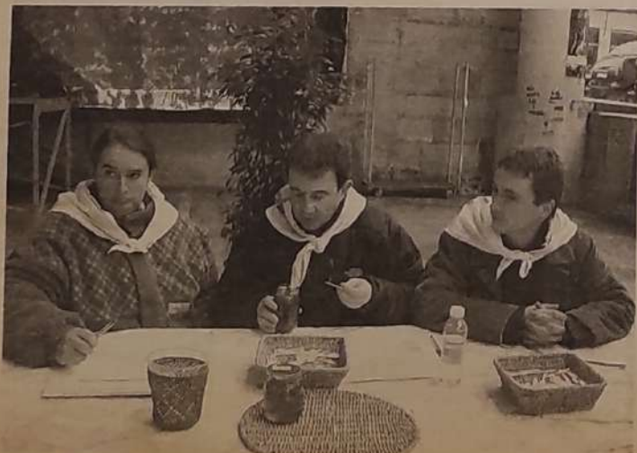
Ezti lehiaketako epaimahikoan sukaldari famatuak egon ziren besteak beste. (ARANBERRI)