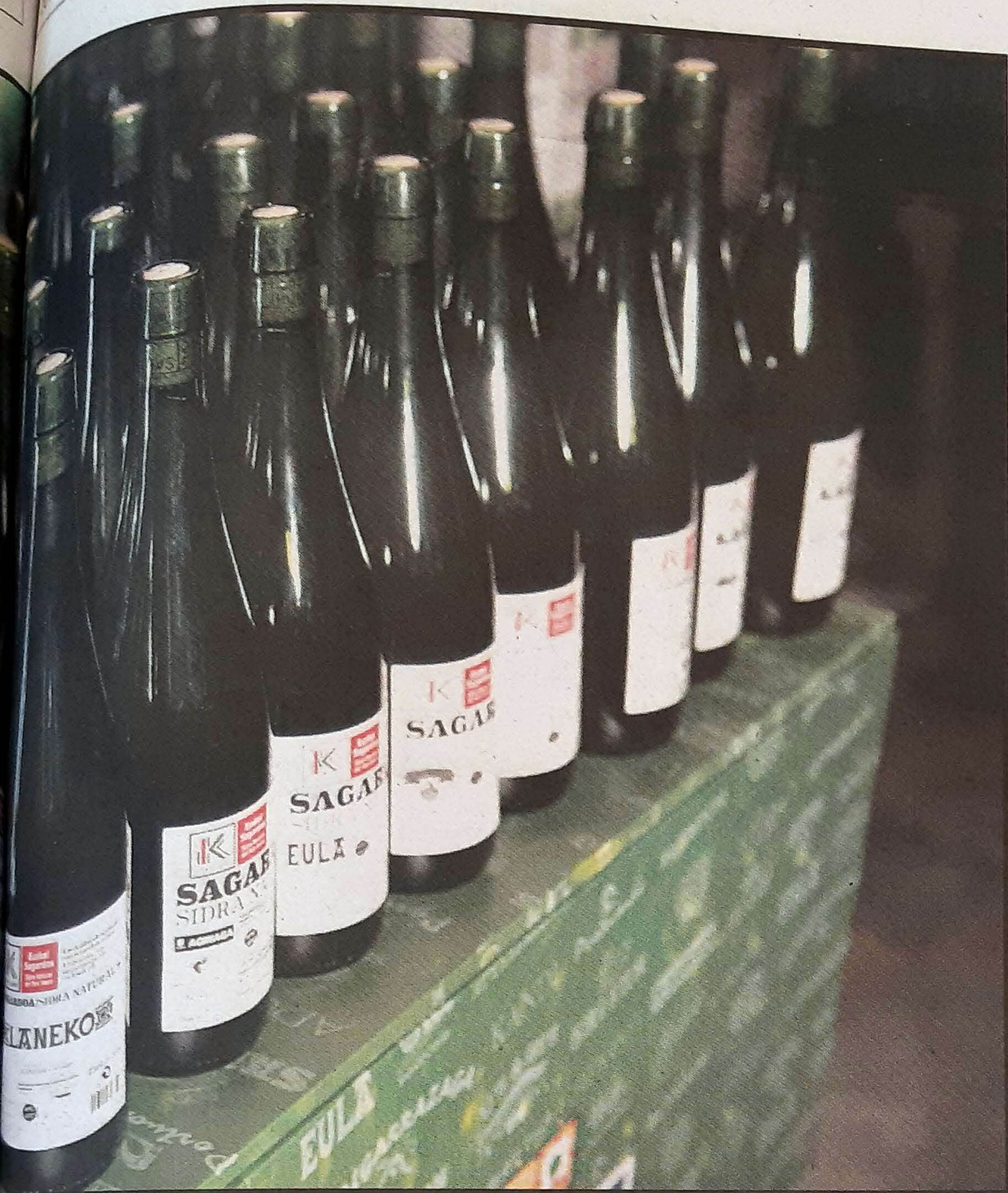
... ahora seis años.

... las fases específicas del ... de elaboración de la si- ... es decir, el cultivo de la ... ana, la cosecha, el lavado, ... para la obtención del ... fermentación, almace- ... y embotellado se de- ... llevar a cabo en la zona ... ífica delimitada.