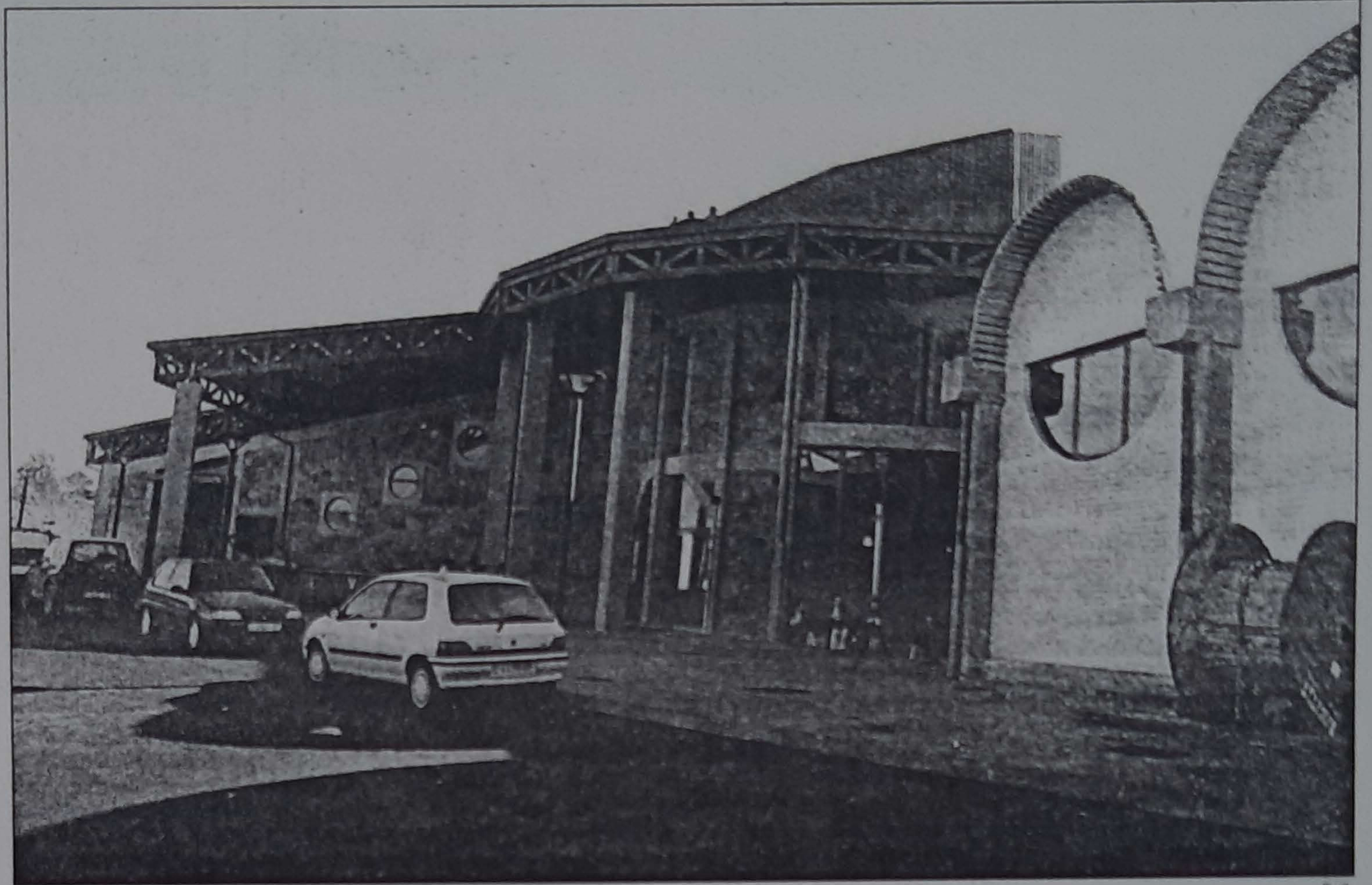
El Museo de la Sidra es el principal referente sidrero de un concejo totalmente volcado con la tradicional bebida.