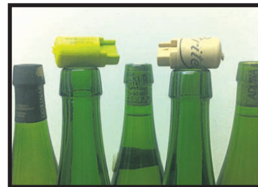
Tapoi isurle berriak.

Petritegik eta Olak ez ezik, gaur egun gero eta gehiago dira kortxo berezi hori erabiltzen duten sagardotegiak, hala nola Astigarragako Gurutzeta, Hernaniko Iparragirre, Aiako Izeta, eta Zeraingo Oiharte eta Oatza, beste batzuen artean. J.S.