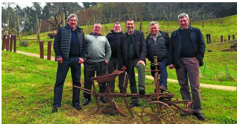
Los seis integrantes que en la actualidad componen el grupo Goldea.