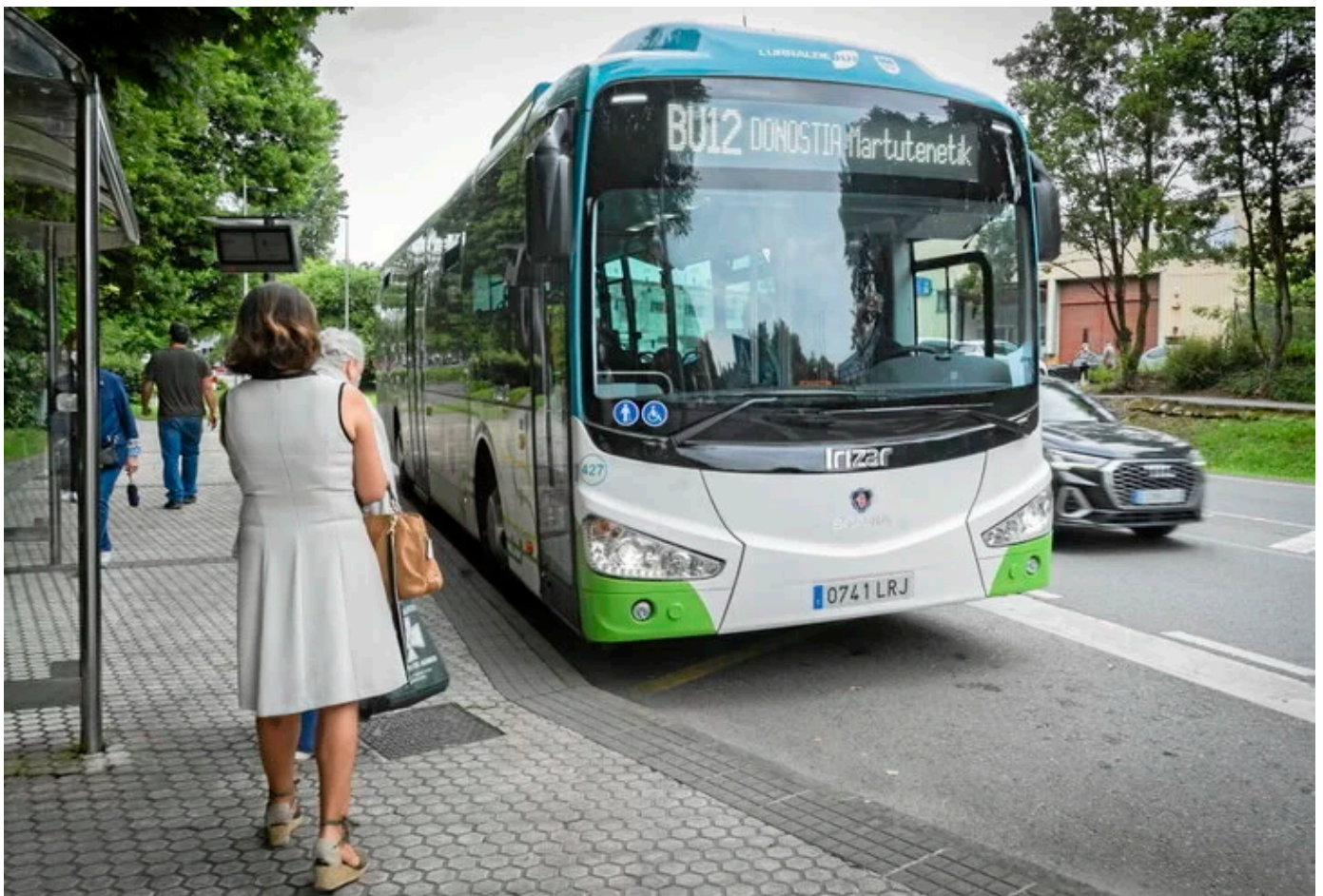
Gaur egun sei dira Donostialdeko sagardotegietara gerturatzen diren Lurraldebusko ibilbideak.

Joan den astean Donostian egindako txotx denboraldiaren aurkezpeneko gai nagusietako bat mugikortasuna izan zen. Sagardotegiak hirietatik urrun daude eta