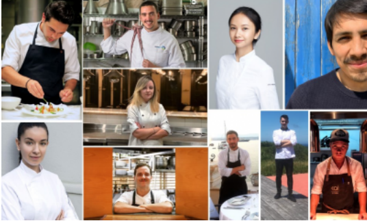
¿Quiénes son los finalistas de S. Pellegrino Young Chef 2019?