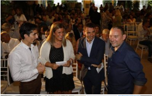
Ganadores de Las Calderetas de Don Calixto