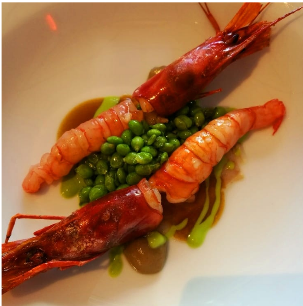
Gamba de Palamós, flor de guisante y paceta ibérica de Marc Gascons