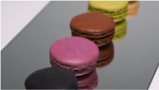
Conoce Francia a través del tour