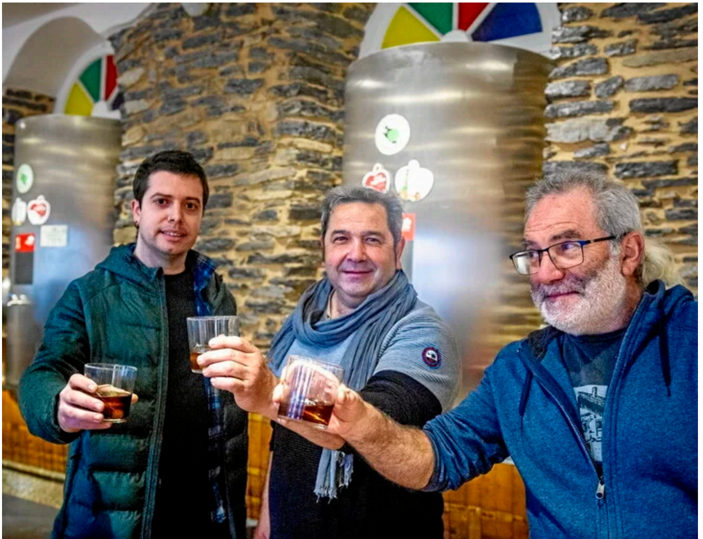
Trebiñu, Kuartango eta Iturrietako arduradunak, iazko irekiera ekitaldian.

Aurtengo Arabako txotx denboraldiaren irekiera Aramaioko Iturrietari egokitu zaio. Ostegun honetan egin dute eta bertan izan dira Euskal Herriko Hazien Sareko kideak, «bertako barrietateak berreskuratzeko egiten duten lana eskertzeko», Iturrietako