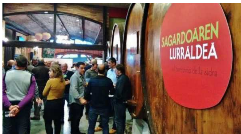
Txotx en sidrería Bereziartua de Astigarraga

Publicado por José Luis Sarralde el día 11 enero 2018