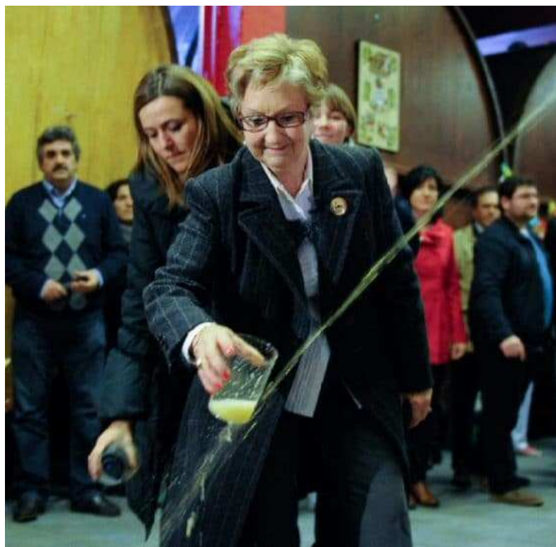
Apertura del txotx en sidrería Bereziartua de Astigarraga

Qué mejor época para hacerlo que durante la temporada del txotx , la cual este año 2018 se inicia en Euskadi el día 15 de enero y se prolonga hasta el mes de abril.